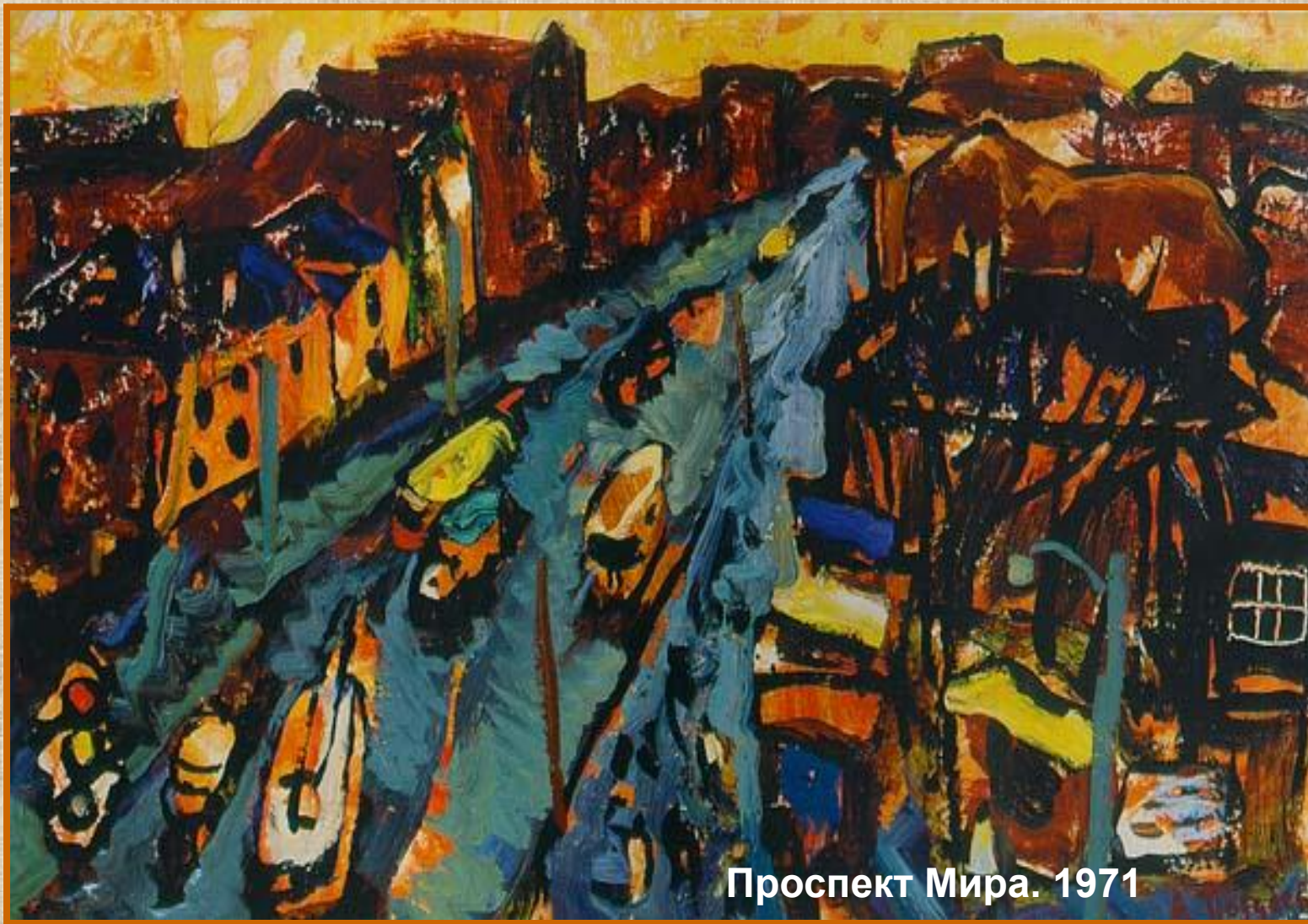
Проспект Мира. 1971