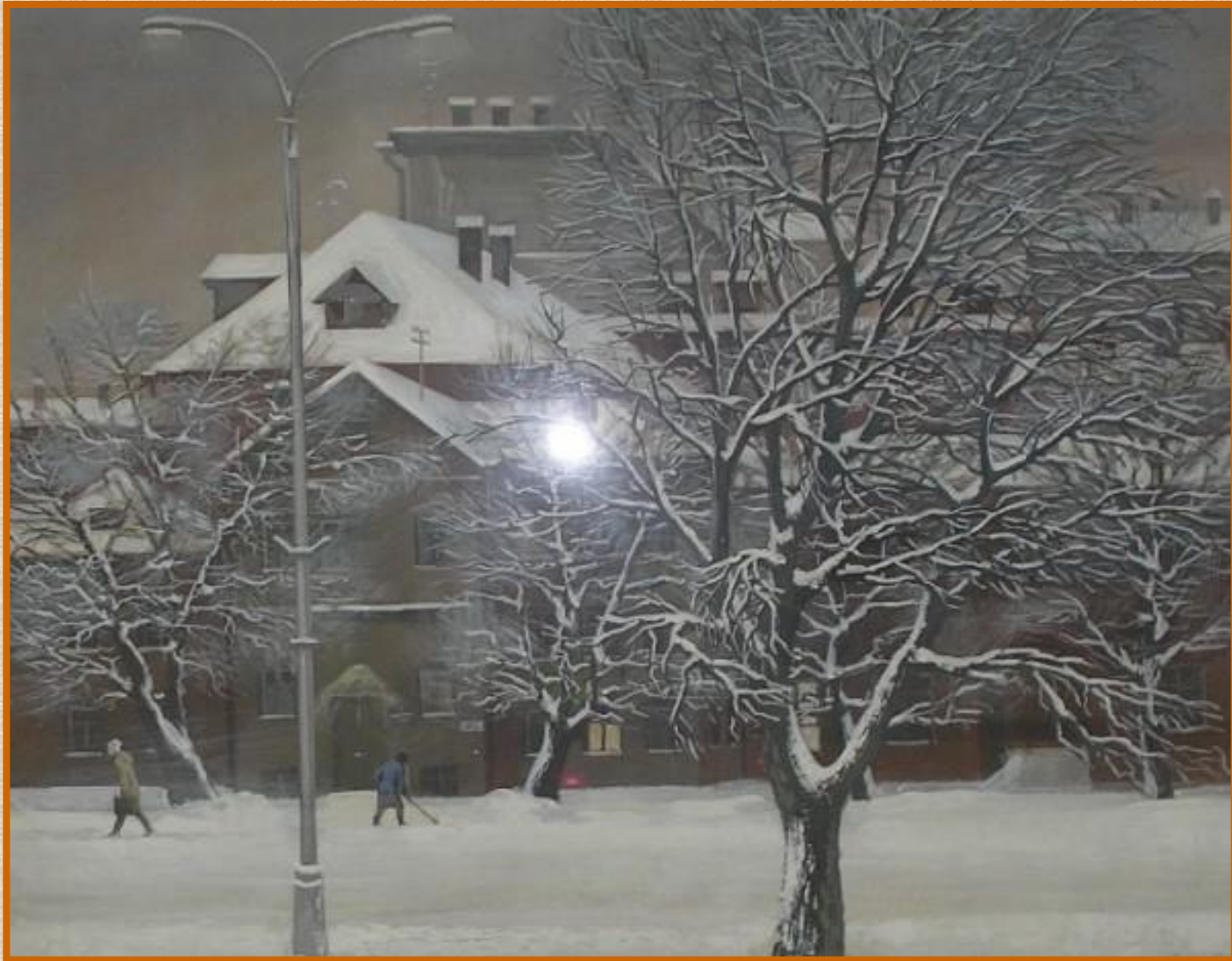
Старый город. 1986, бум., смеш.тех.