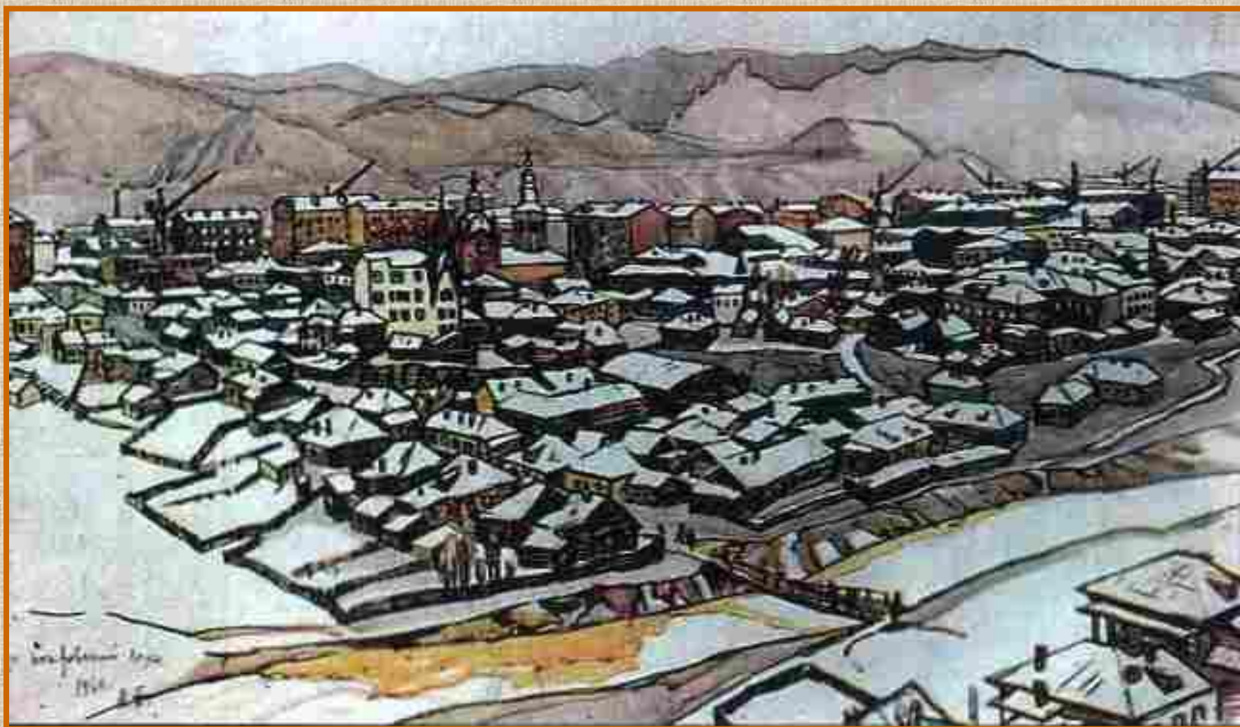
Вид с Покровской горы.