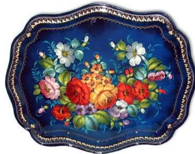
букет в раскидку