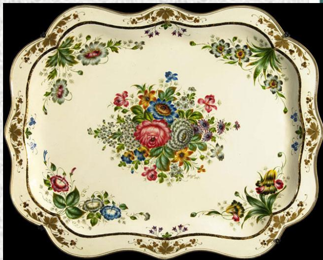
роспись с углов