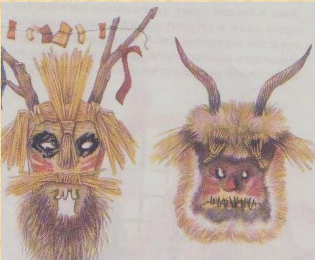
Русские святочные маски