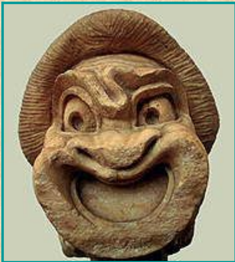
Древнегреческая театральная маска

Маски театральные употреблялись в античном театре, скоморохами, в итальянской комедии дель арте, традиционном театре Японии, Южной и Юго-Восточной Азии.