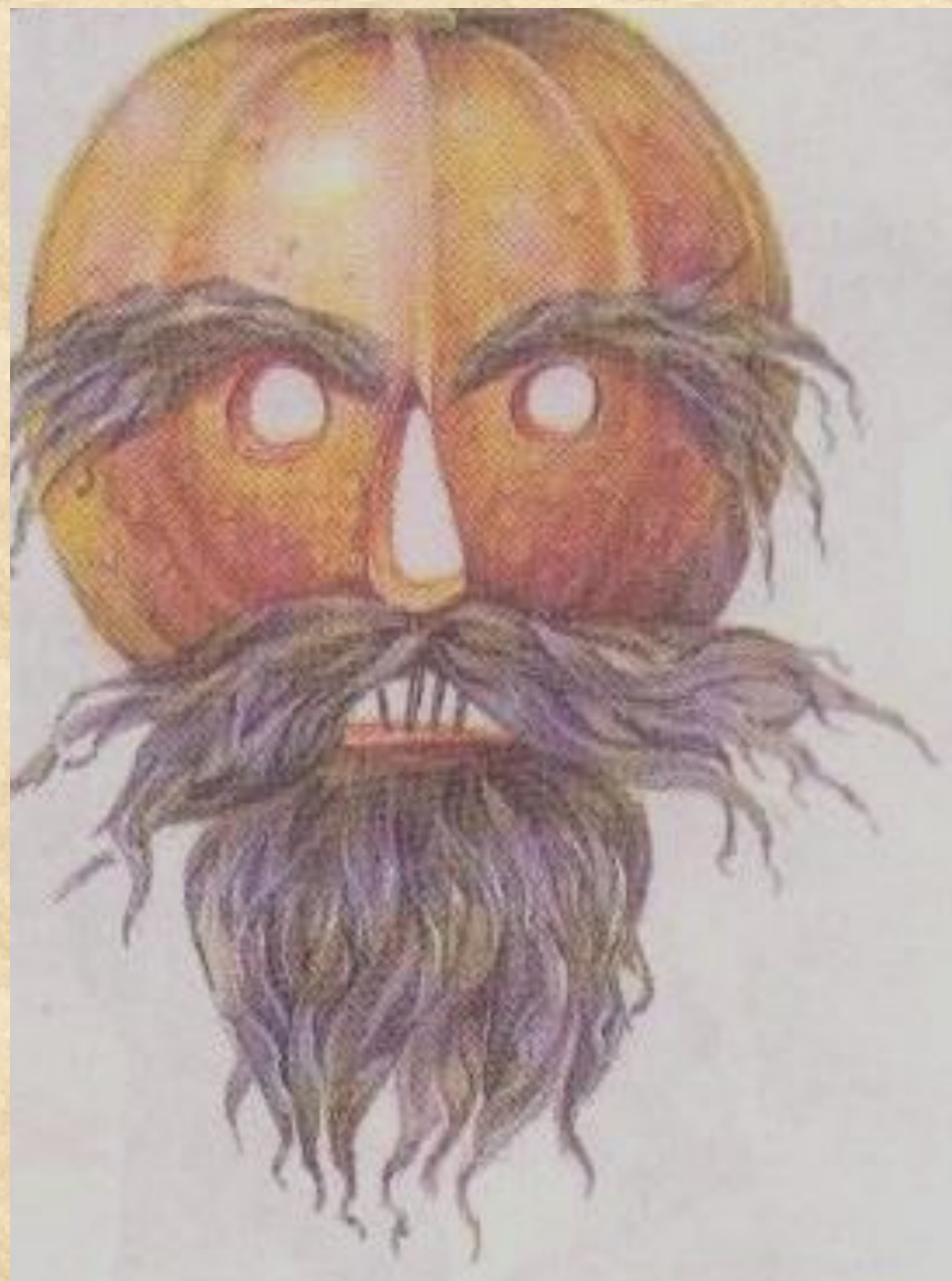
Адыгейская маска из тыквы