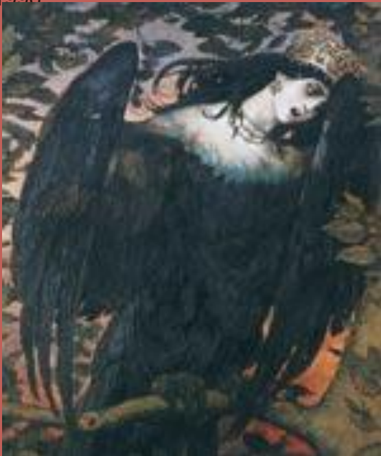
Сирина (фрагм) Виктор Васнецов

Сирина - это одна из райских птиц, даже самое ее название созвучно с названием рая: Ирий.