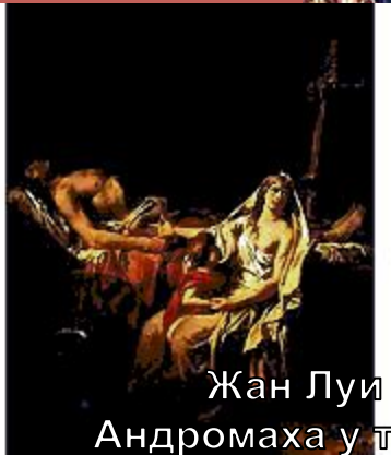
Жан Луи Давид. Андромаха у тела Гектора.