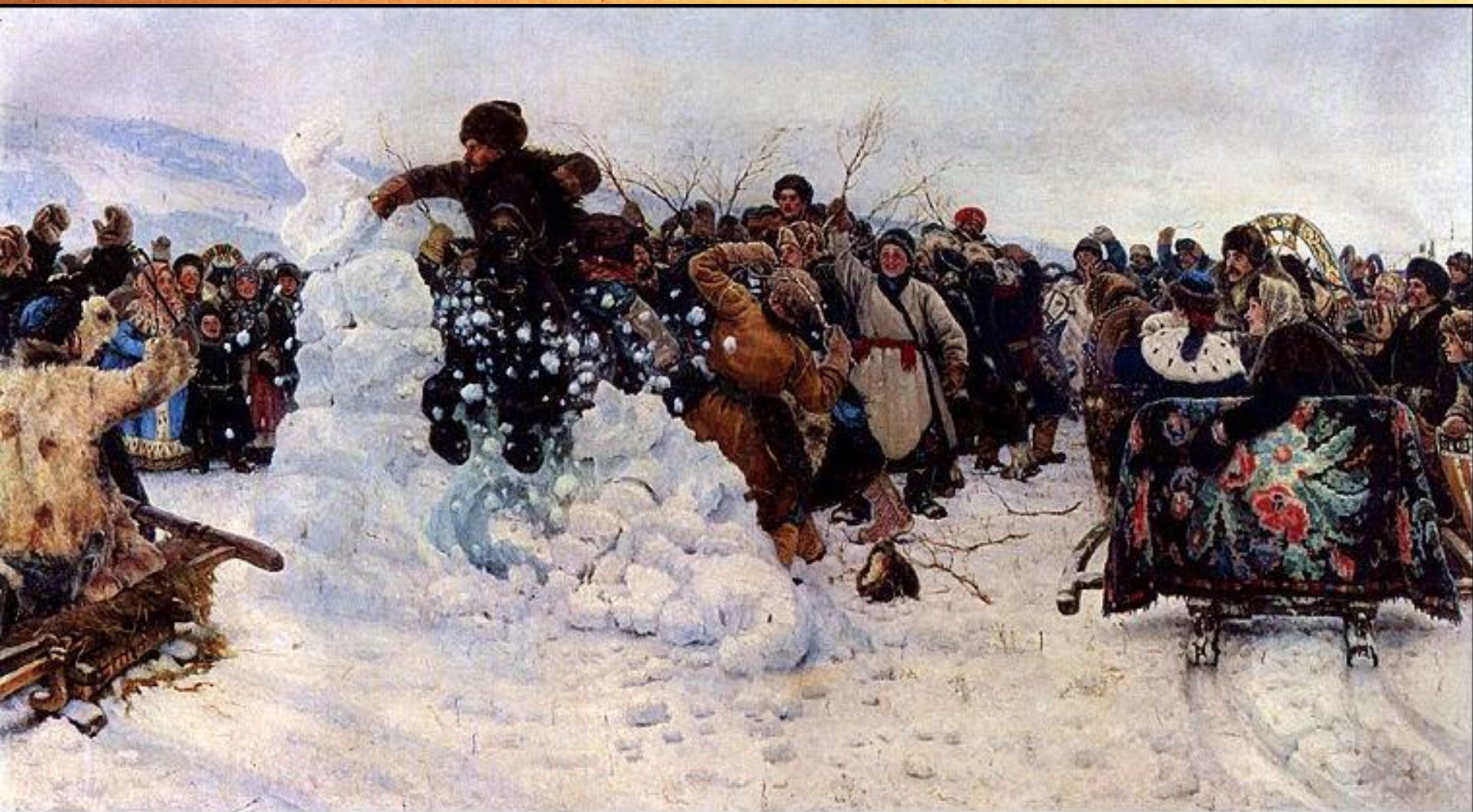
В.И. Суриков. Взятие снежного городка. 1891