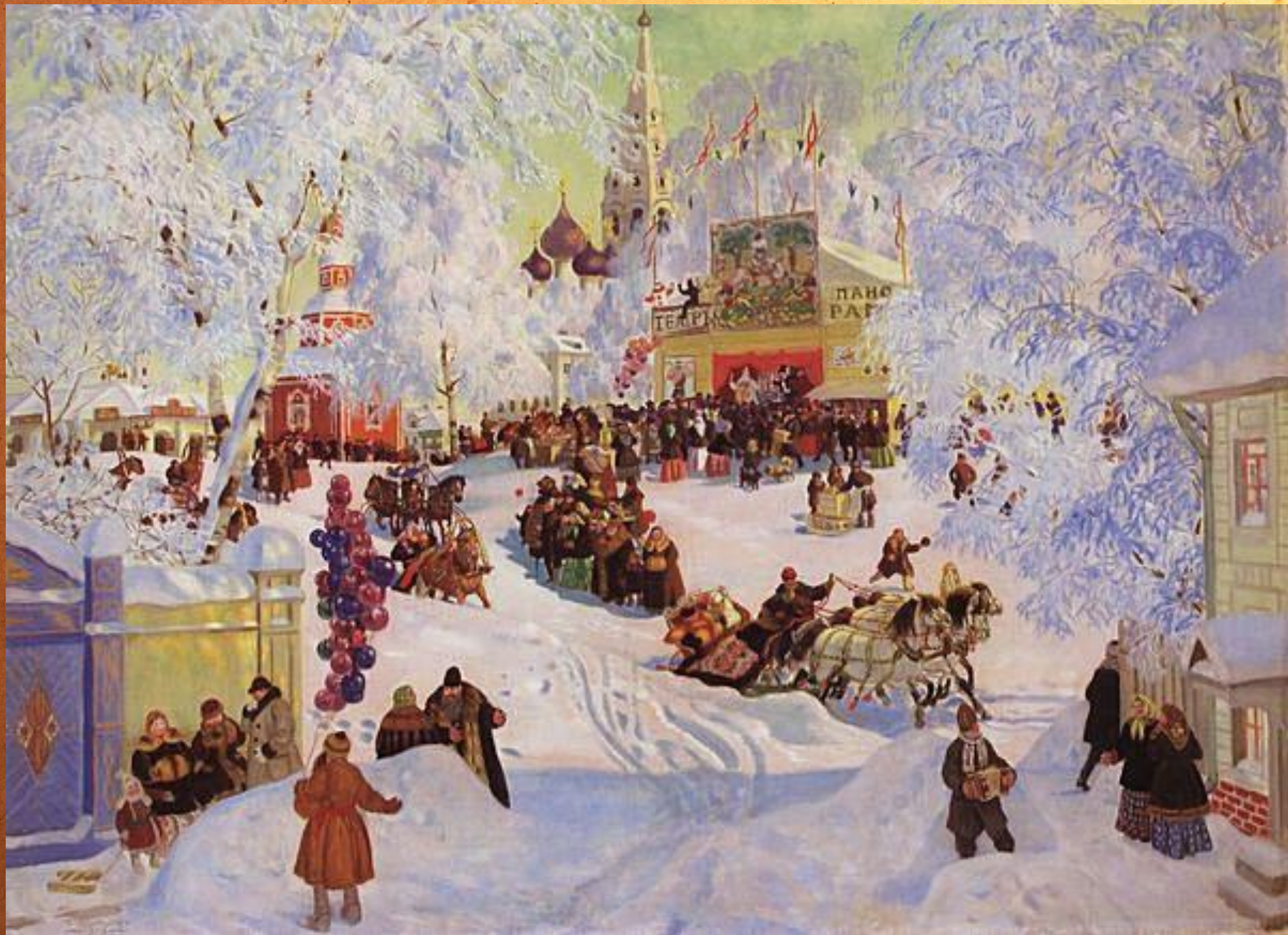
Борис Михайлович Кустодиев. Гулянья на Масленицу.