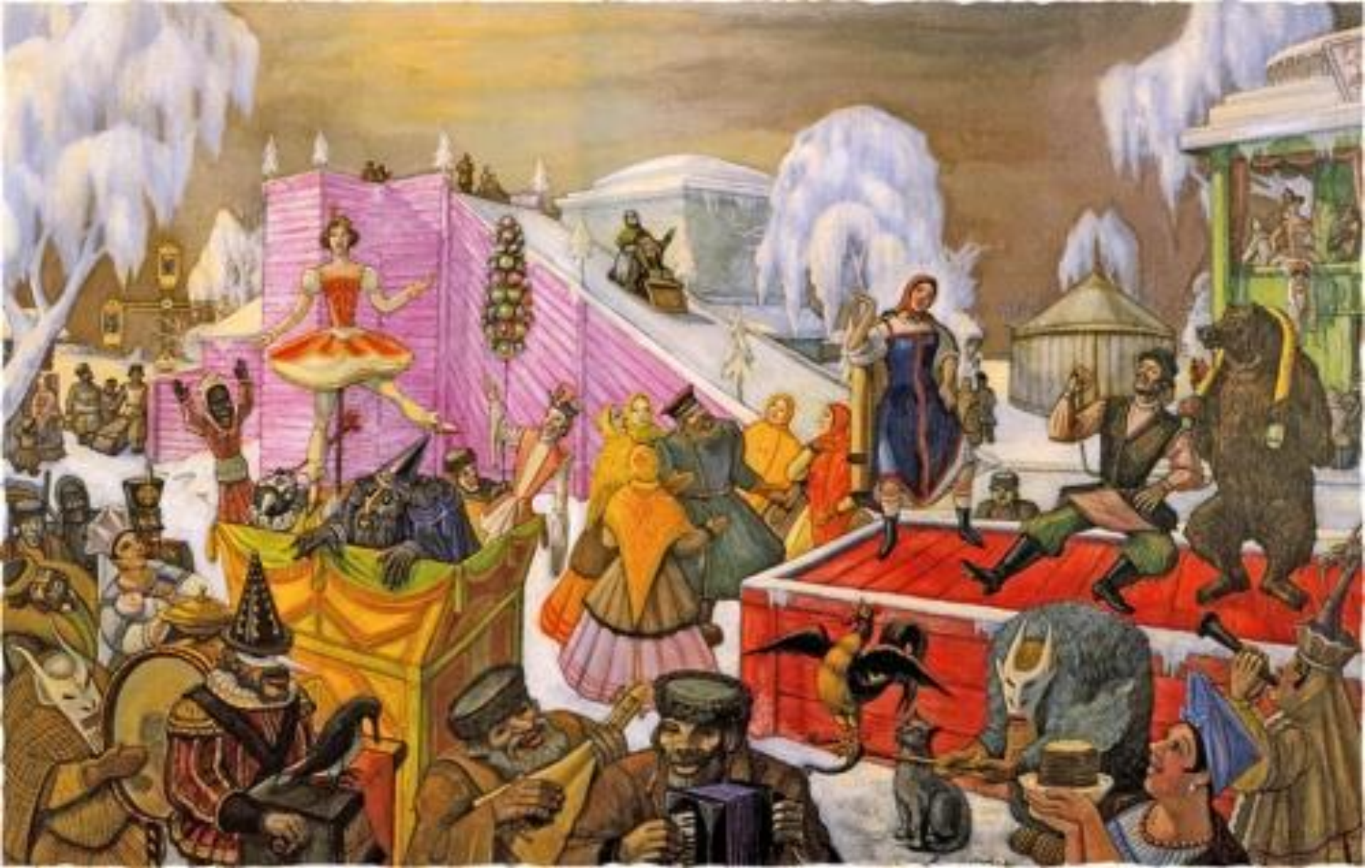
С.Судейкин. Масленица. 1923-1924