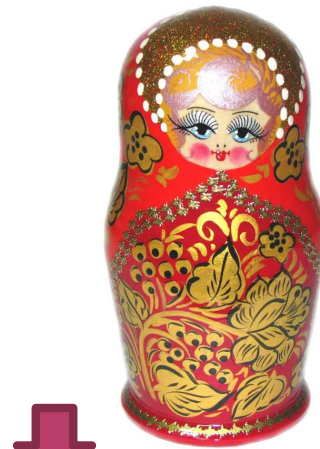
В стиле росписи «Хохлома»