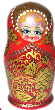
В стиле росписи «Хохлома»