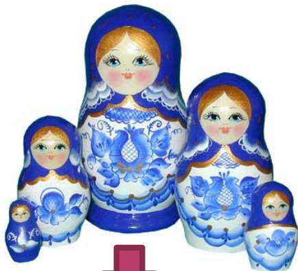
В стиле росписи «Гжель»