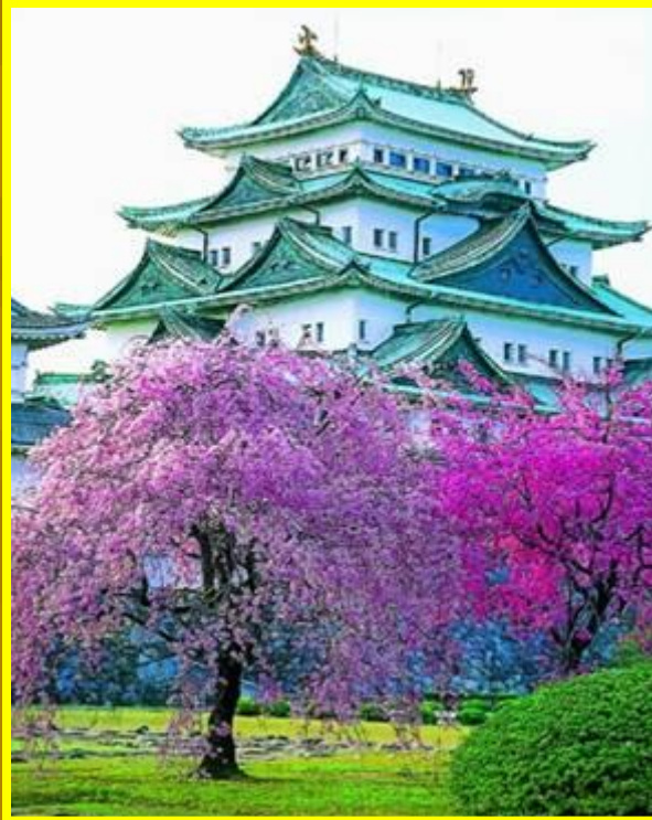
Замок г. Нагоя

Есть в Тихом океане голубые острова Кюсю, Хонсю, Хоккайдо и Сикоку. На них лежит Япония , волшебная страна, Краса и гордость Дальнего Востока.