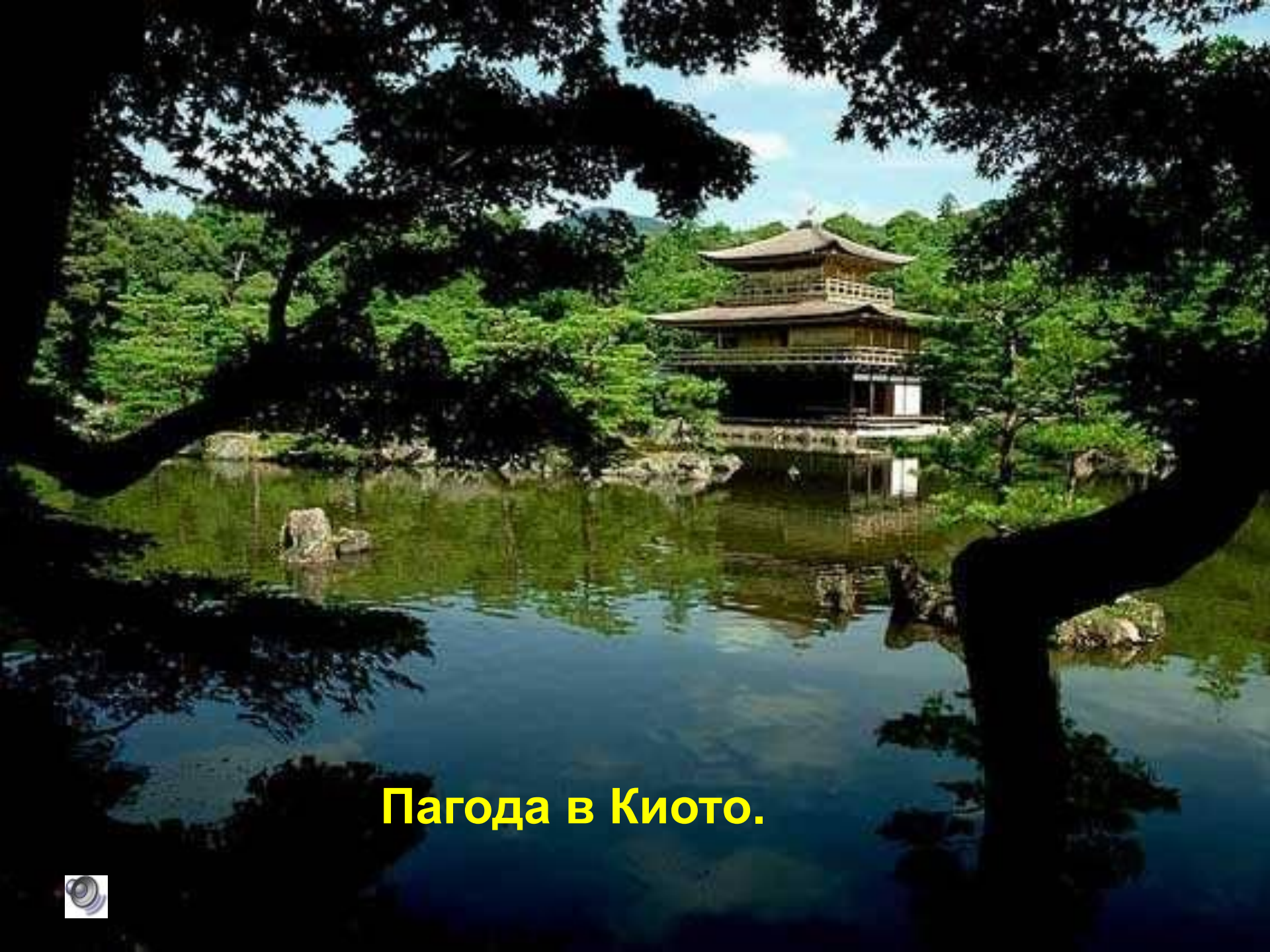
Пагода в Киото.