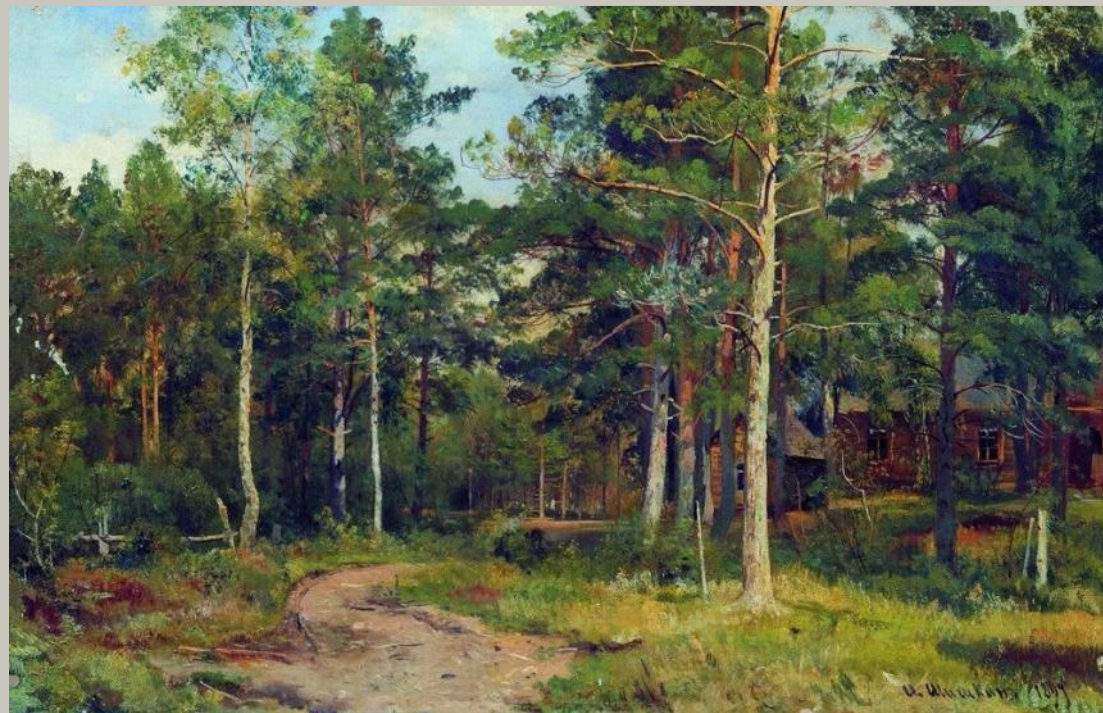
Осенний пейзаж. Дорожка в лесу Художник Шишкин И.И.