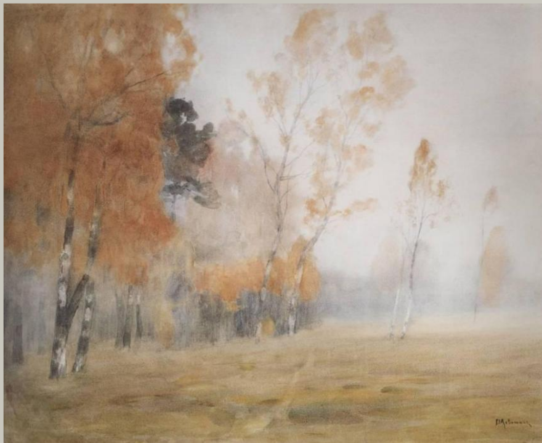
Туман. Осень. 1899 Художник Левитан И. И.