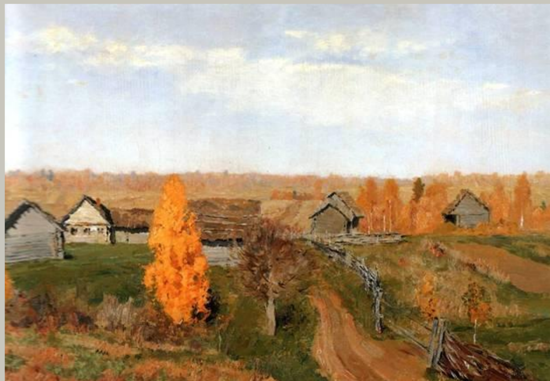
Левитан И.И. Золотая осень. Слободка 1889