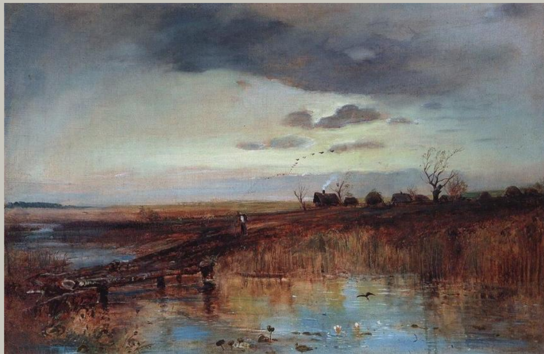
Осень. Деревушка у ручья Художник Саврасов А.К.