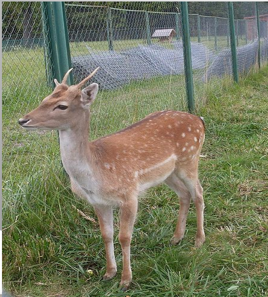
Лань у Кавалерского корпуса