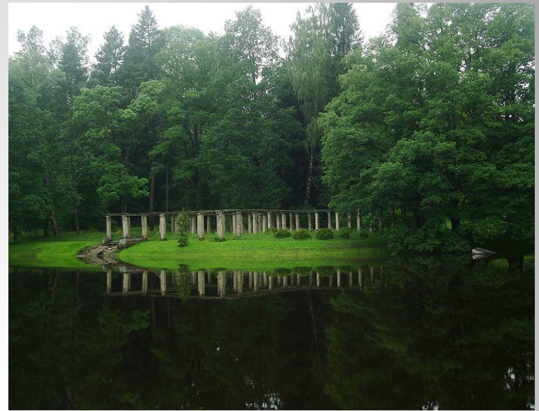
Пергола у Китайского дворца