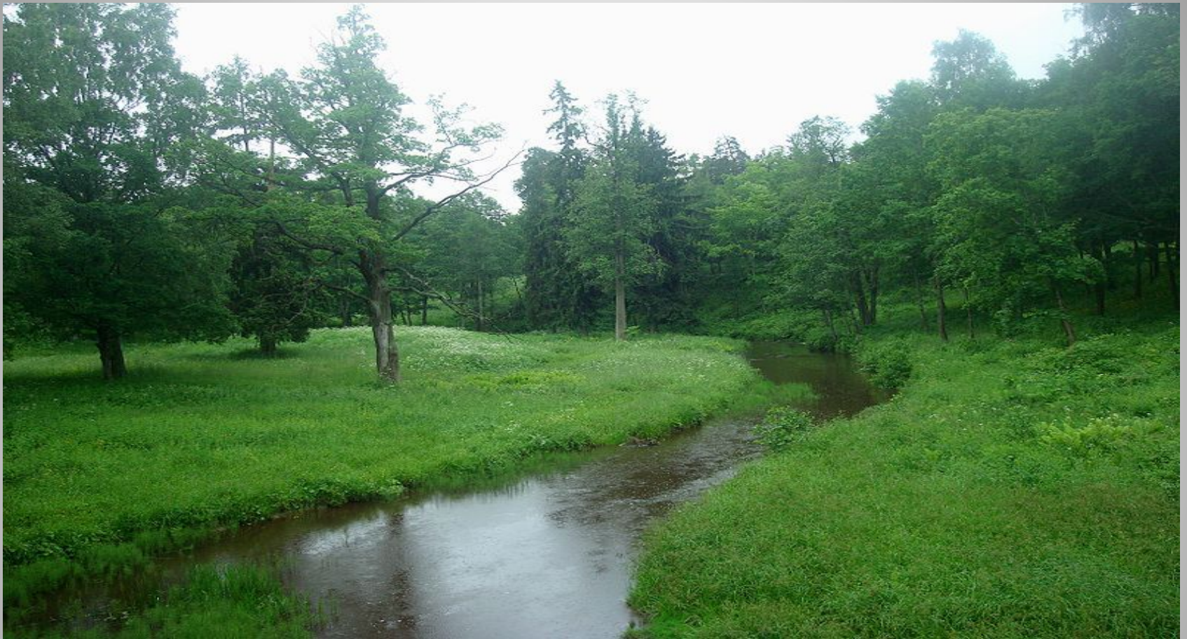
Долина реки Карасты