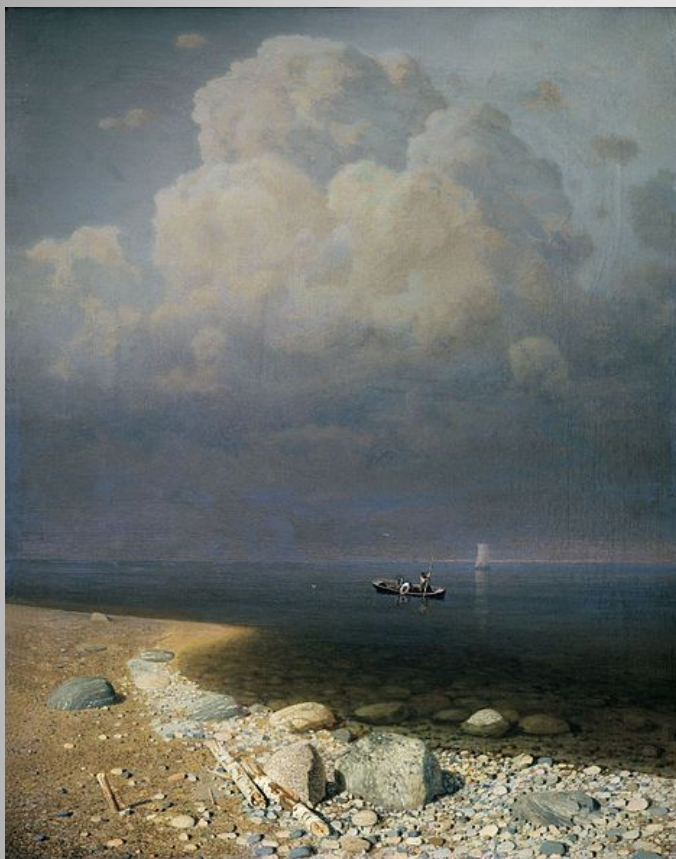
А. И. Куинджи. Ладожское озеро. 1873 г.