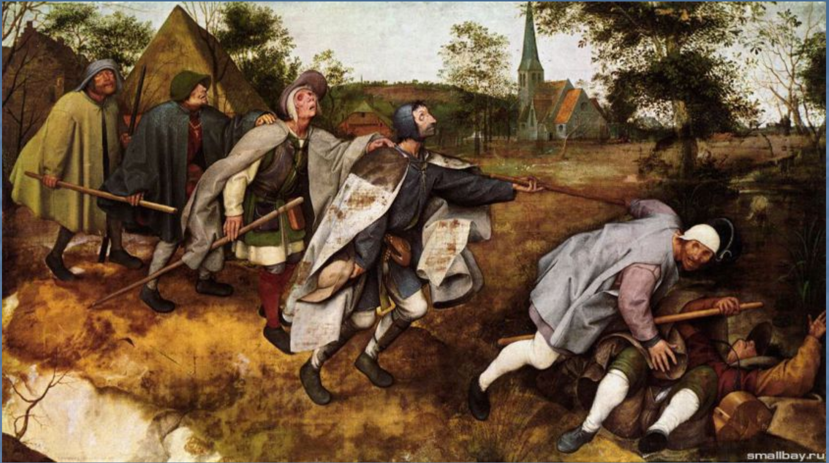
Притча о слепых. 1568