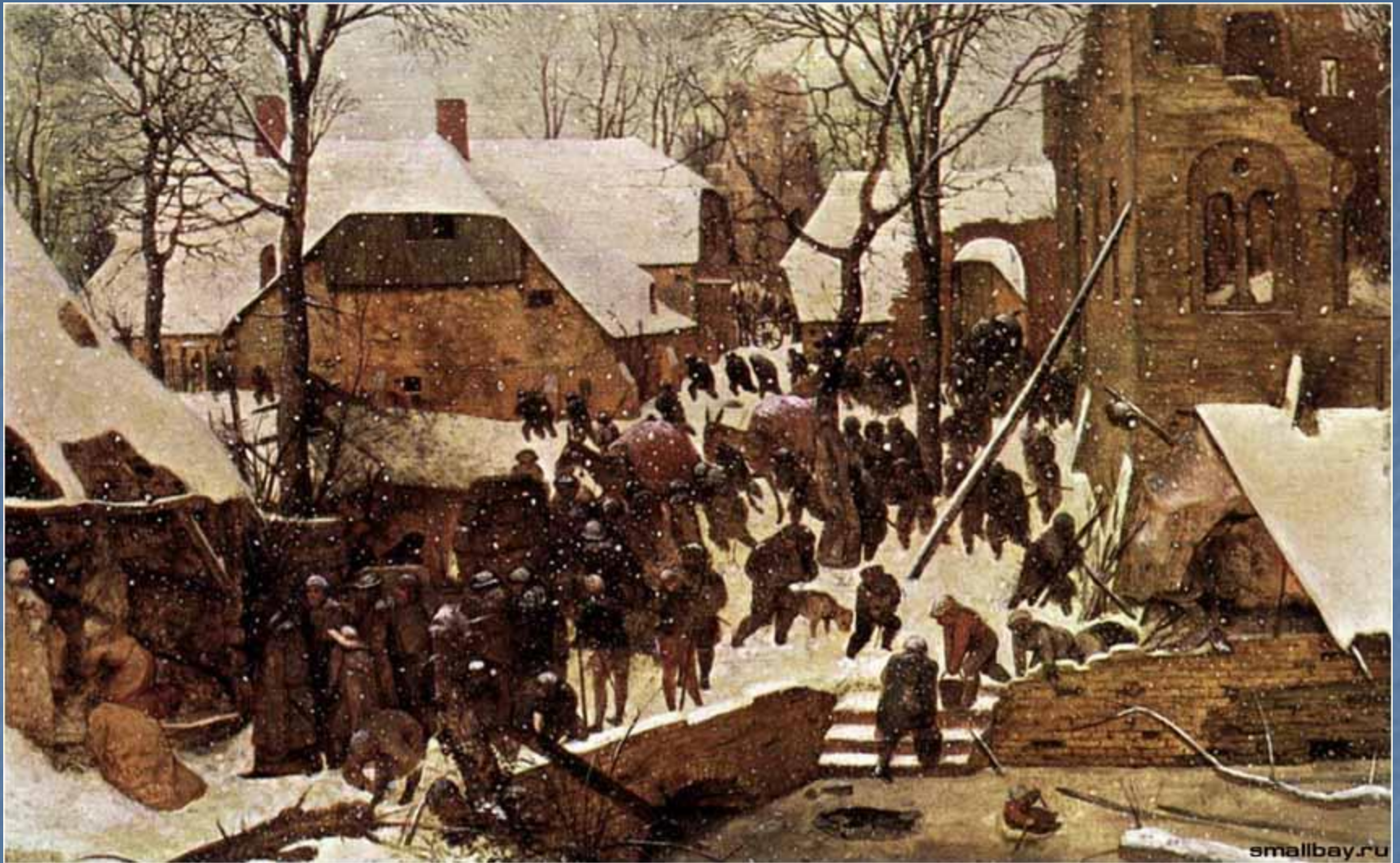
Поклонение волхвов в зимнем пейзаже. 1567.