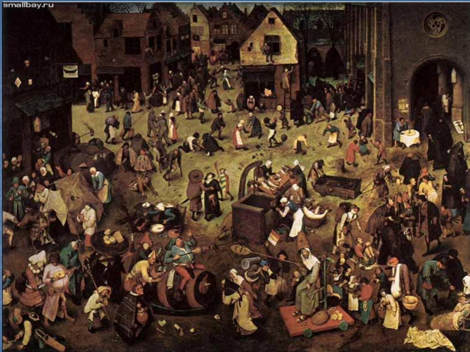
Битва Масленицы и Поста. 1559.