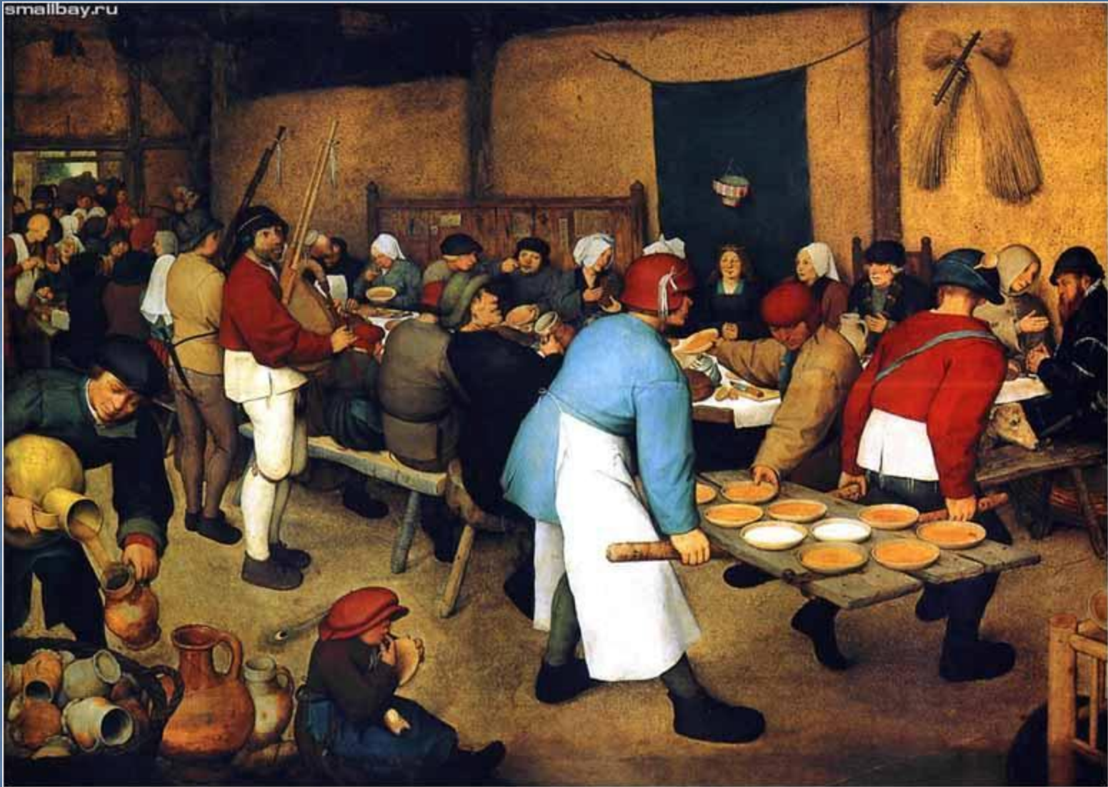
Крестьянская свадьба. 1568.