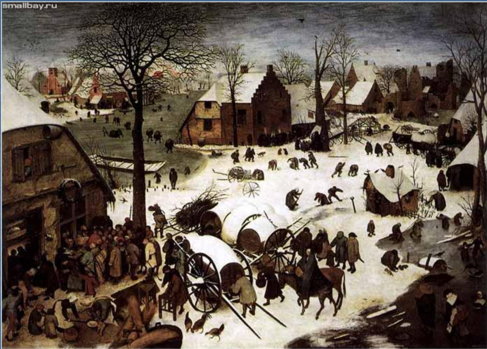
Перепись в Вифлееме. 1566