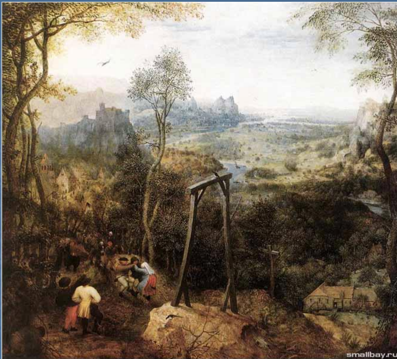
Сорока на виселице. 1568.