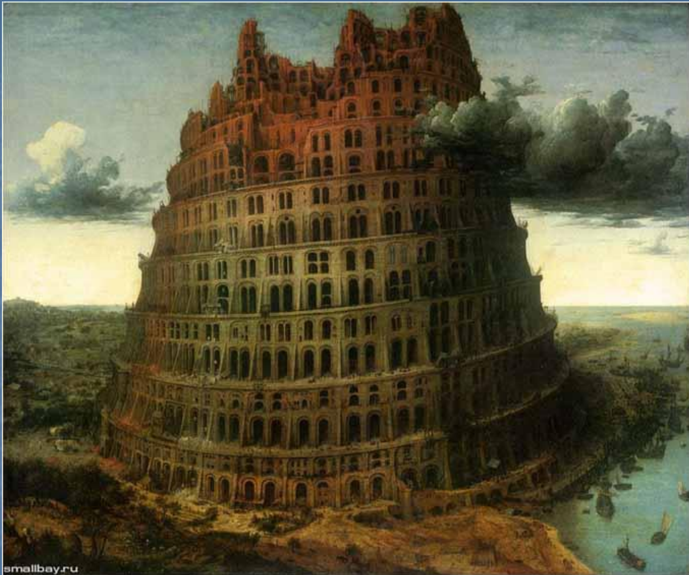
Малая Вавилонская башня.