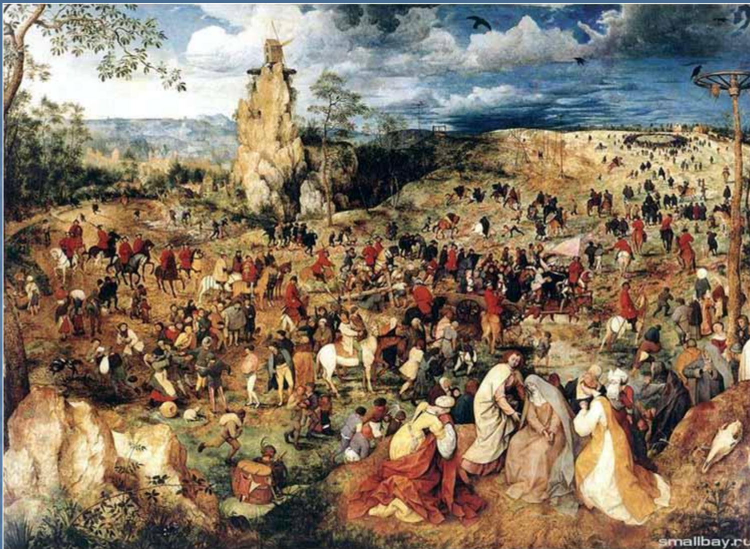
Путь на Голгофу. 1564