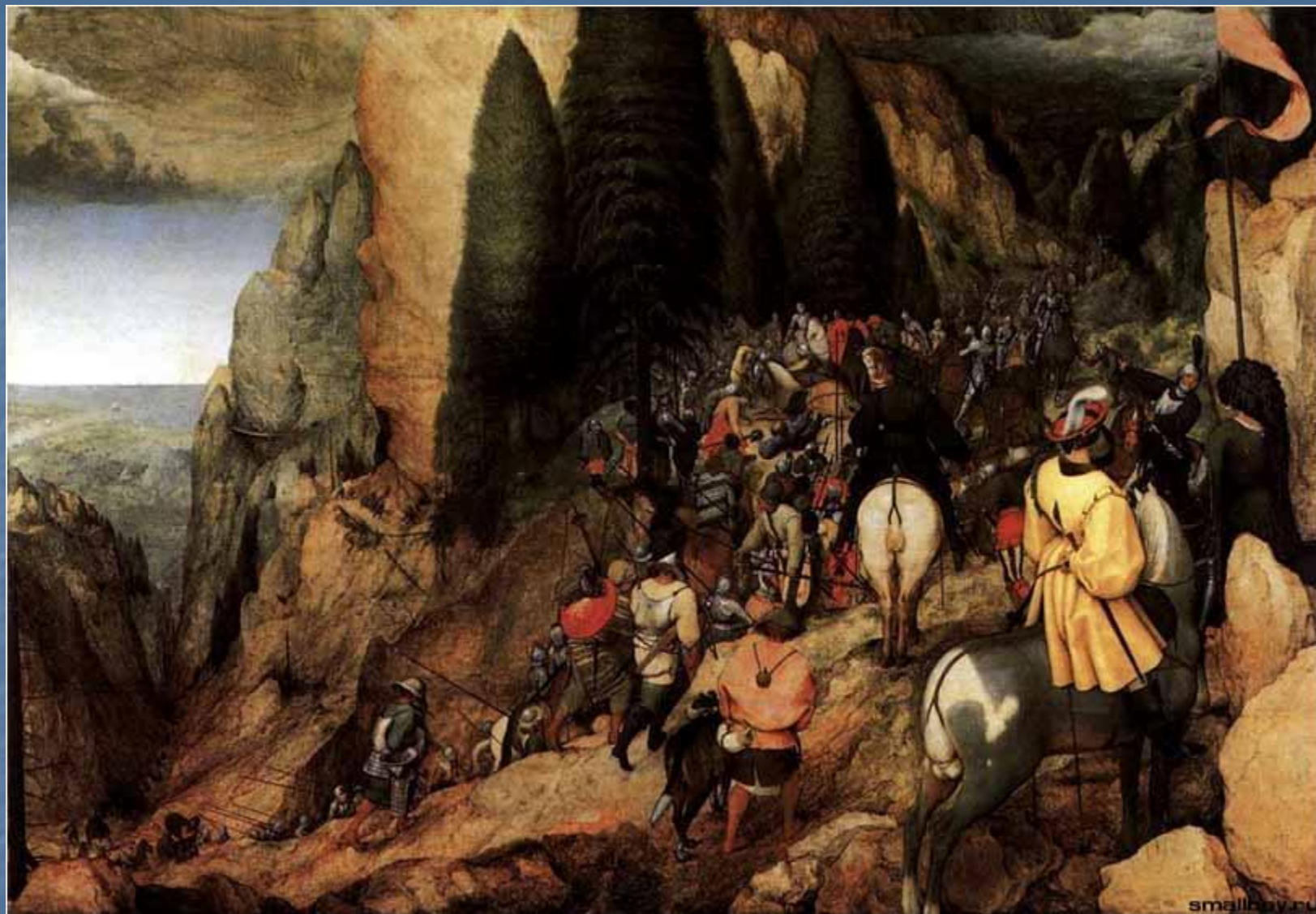
Обращение Савла. 1567.