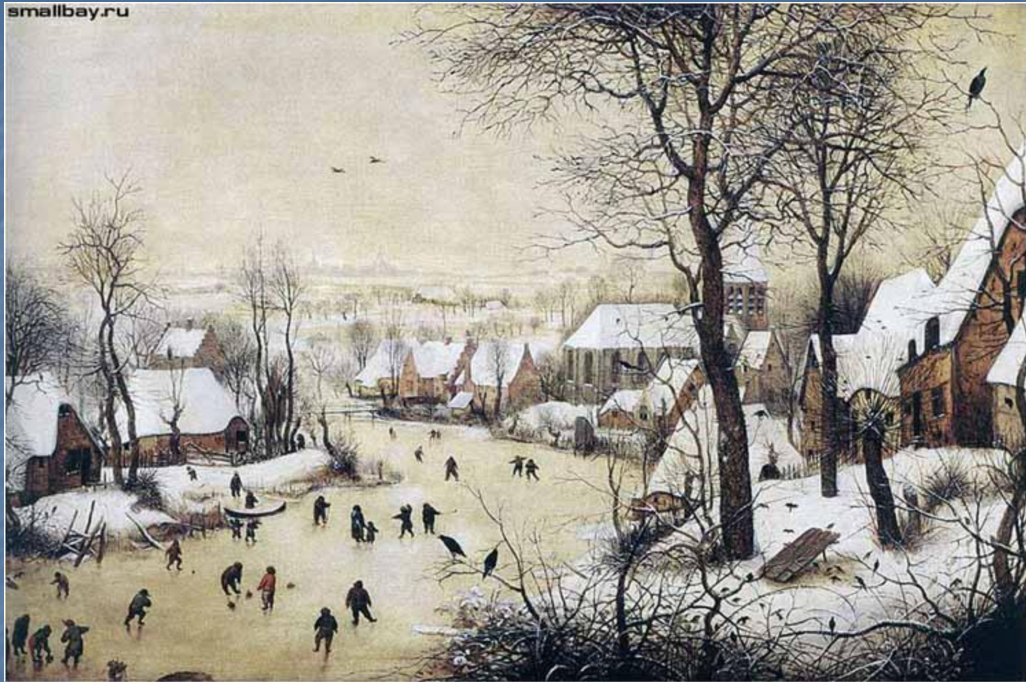
Пейзаж с конькобежцами и ловушкой для птиц. 1565.