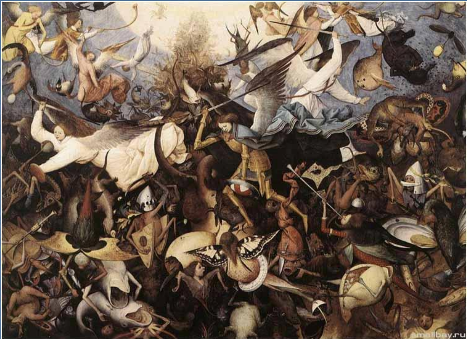
Падение мятежных ангелов. 1562