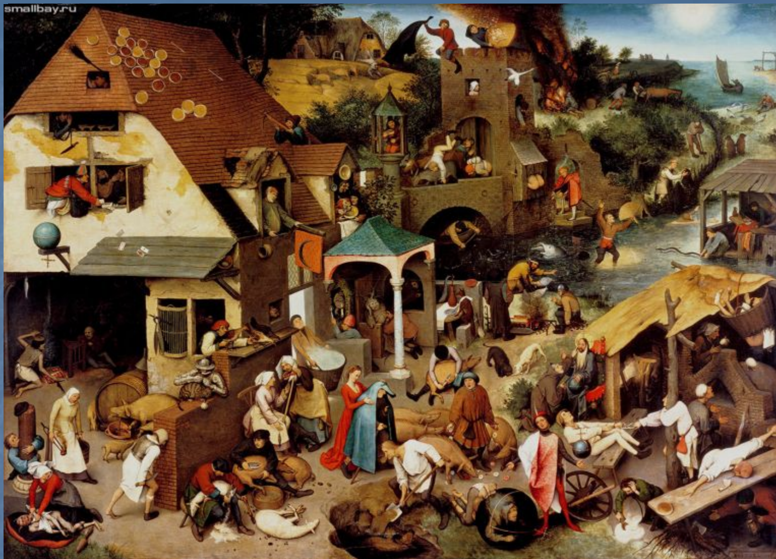
Фламандские пословицы. 1559.