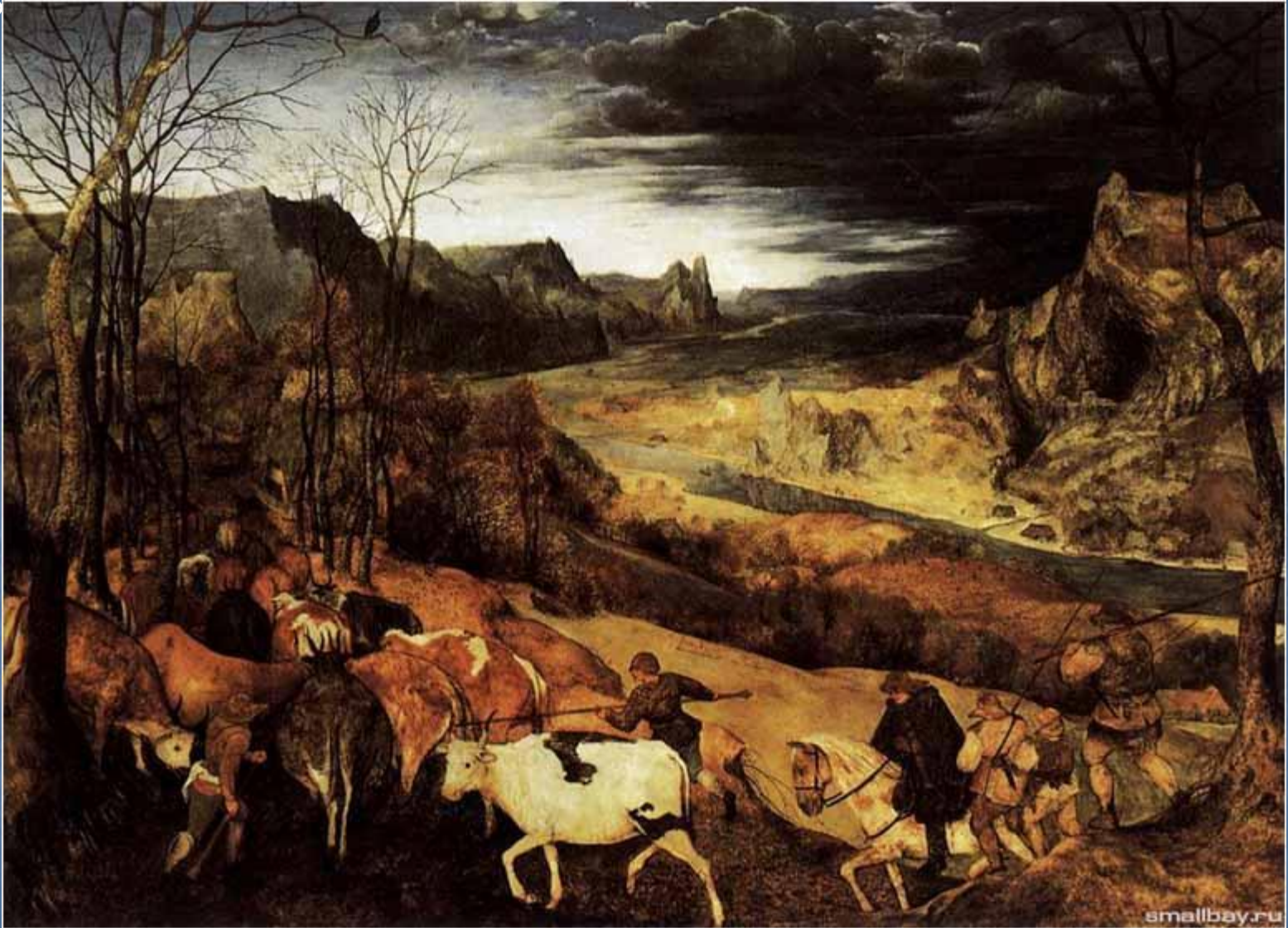
Возвращение стад. 1565.