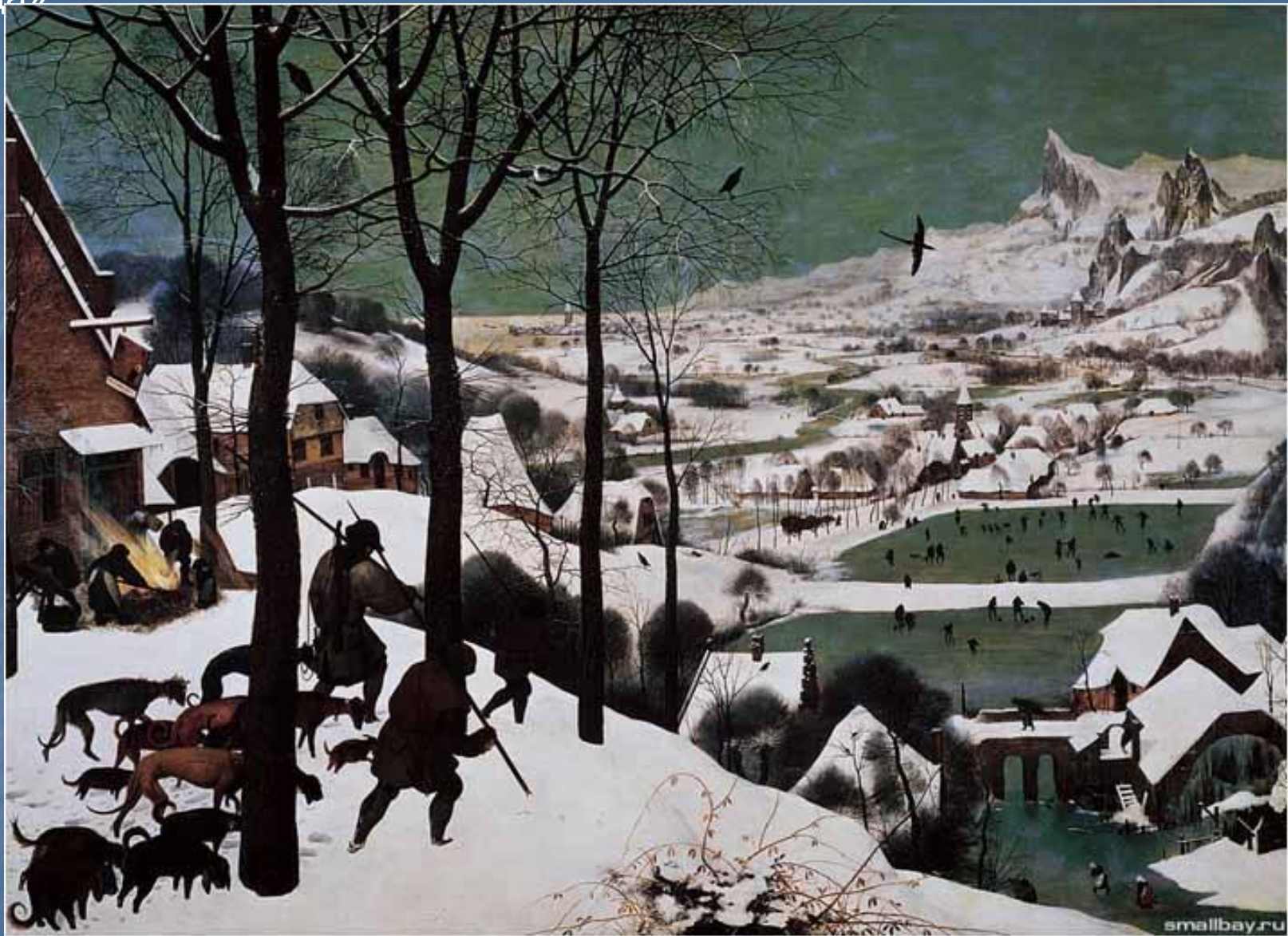
Охотники на снегу. 1565.