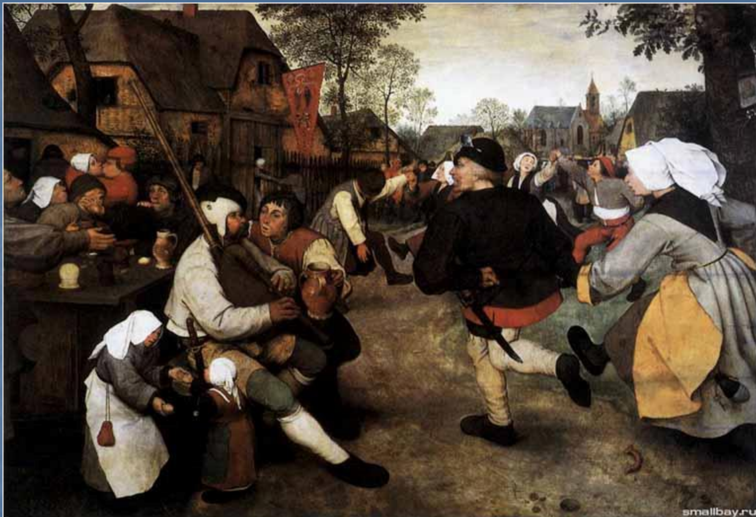
Крестьянский танец. 1568.