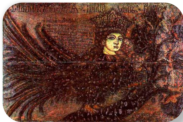
РИСУНОК НА КРЫШКЕ СУНДУКА

Одним из древнейших образов в русском народном искусстве являются птицы с красивыми женскими головами . Их рисовали на сундучках и прялках, вырезали на избах и чеканили на женских подвесках. Кто они и от куда пришли? Попробуем разобраться.