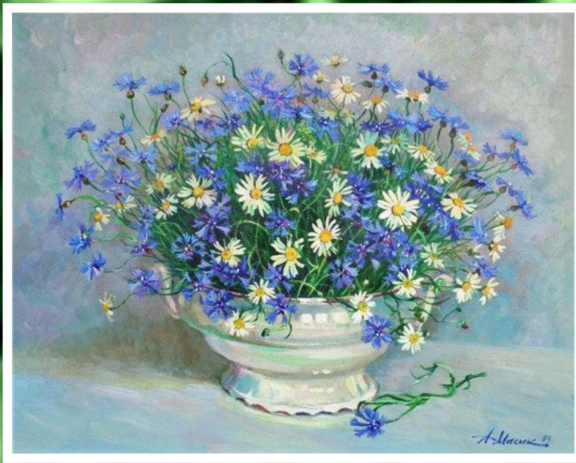
Картина «Васильки» А. Масик