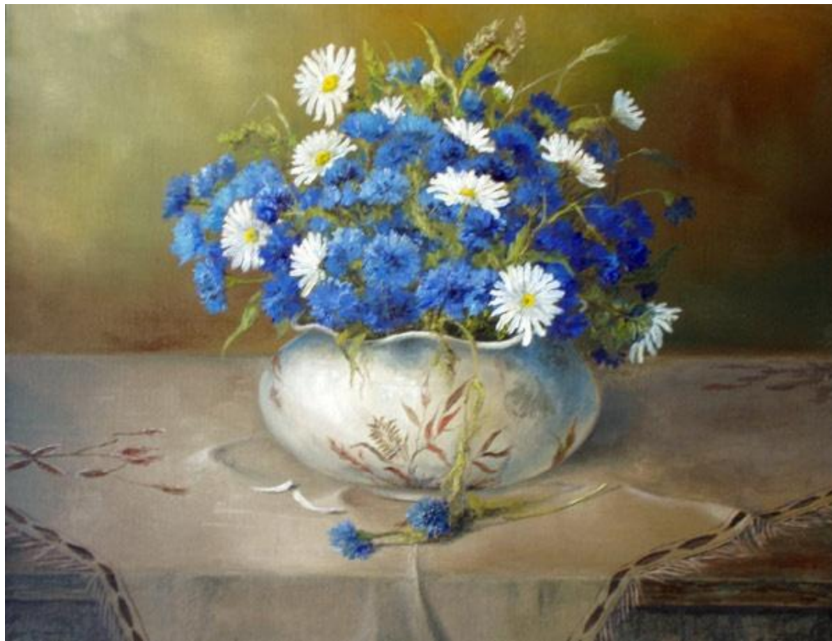
Картина «Васильки» С. Дорофеев.