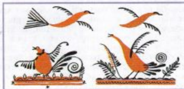
Варианты изображения коня и птицы