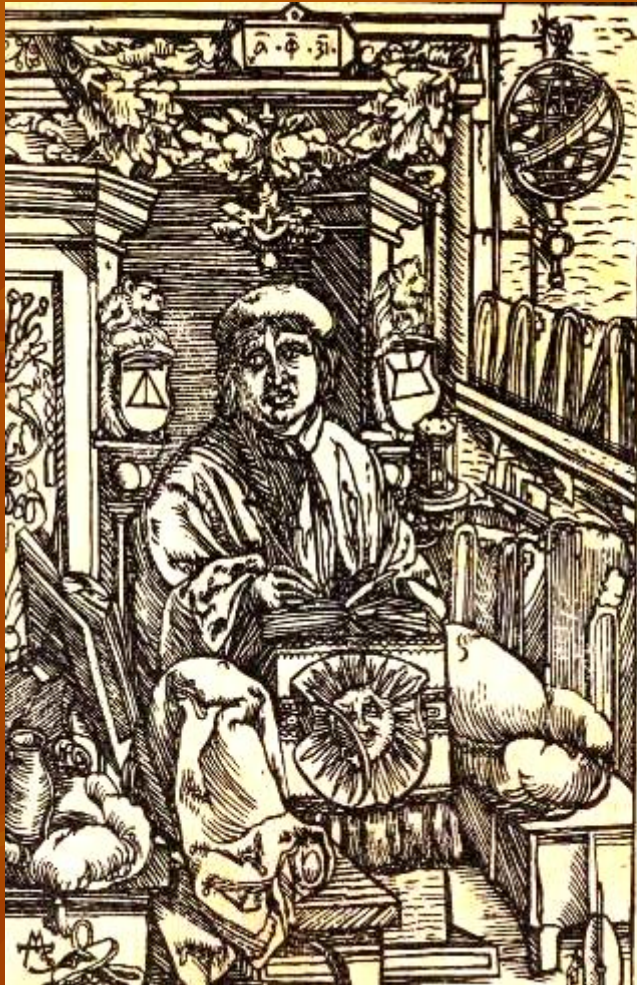
Портрет Франциско Скорины