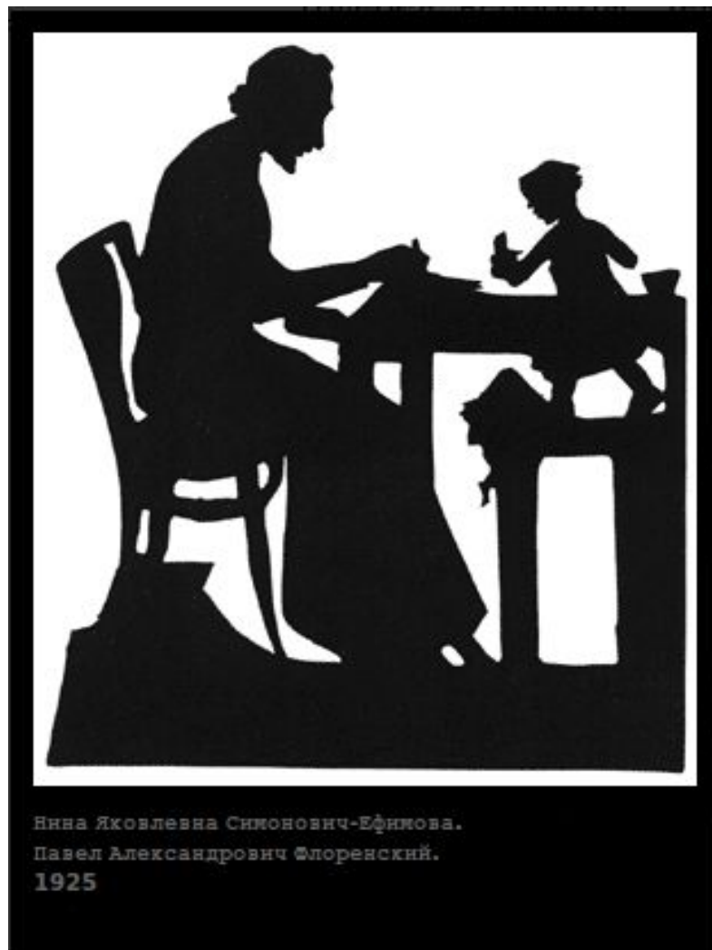
Нина Яковлевна Симонович-Ефимова. Павел Александрович Флоренский. 1925