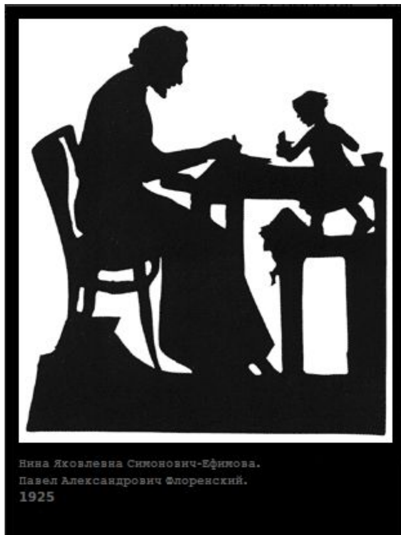
Нина Яковлевна Симонович-Ефимова. Павел Александрович Флоренский. 1925