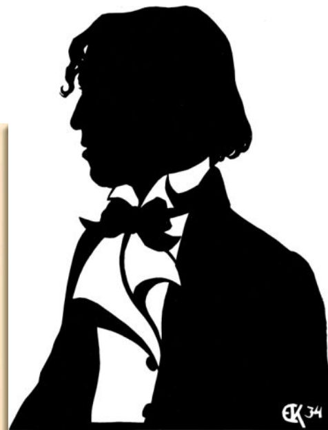
Автопортрет, Силуэт, 1934. Е.С. Кругликова