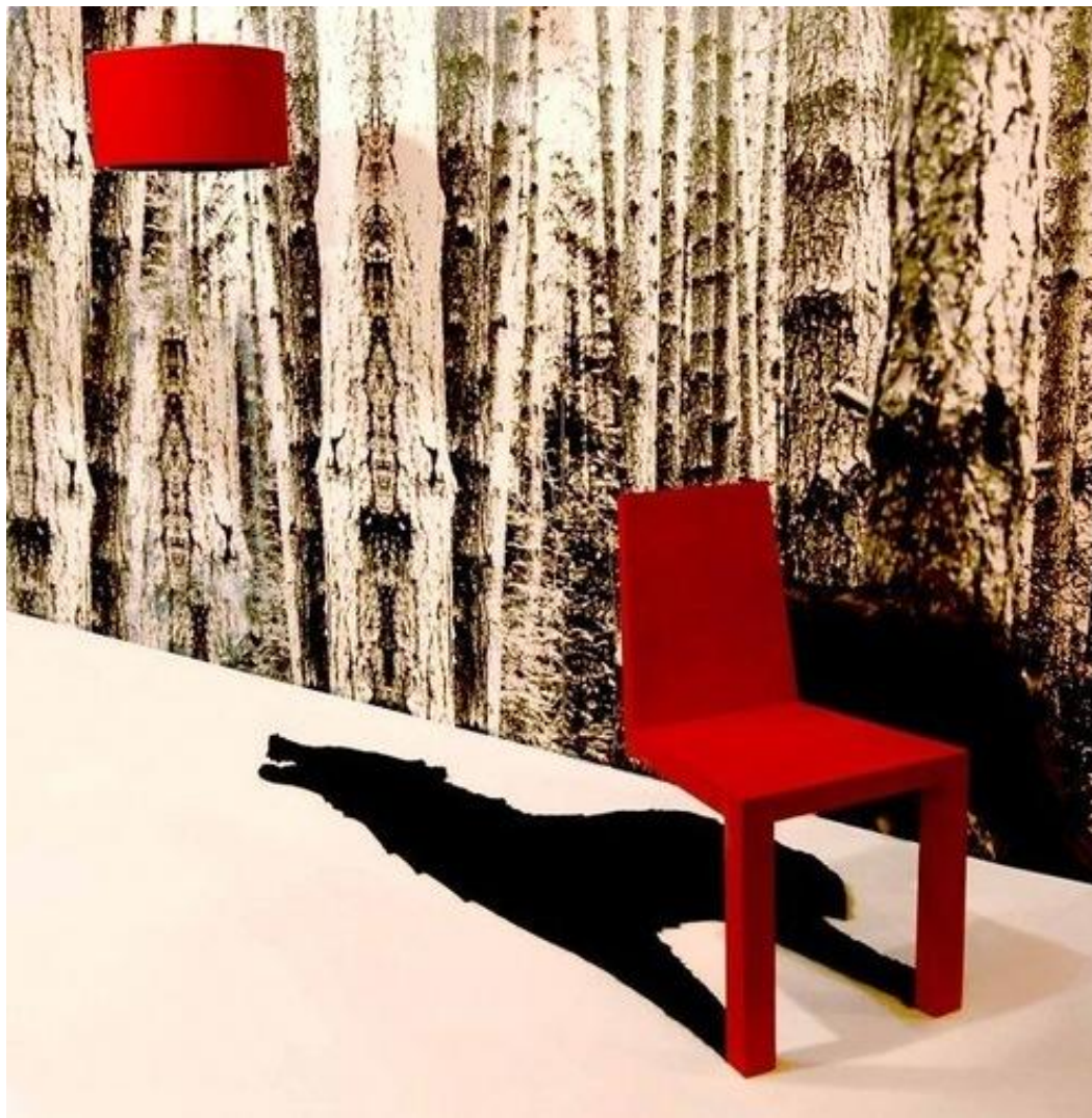
Волк тень от стула