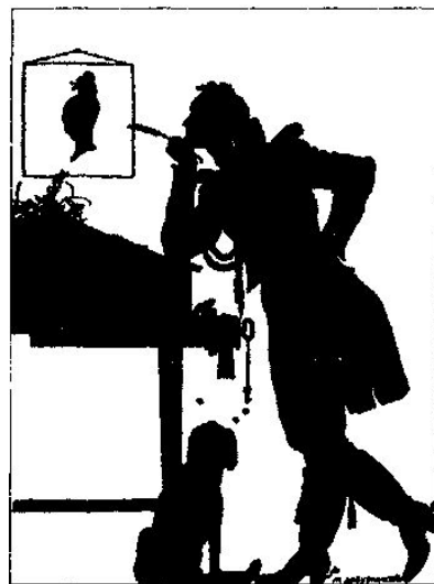
Н. Ильин. Иллюстрация