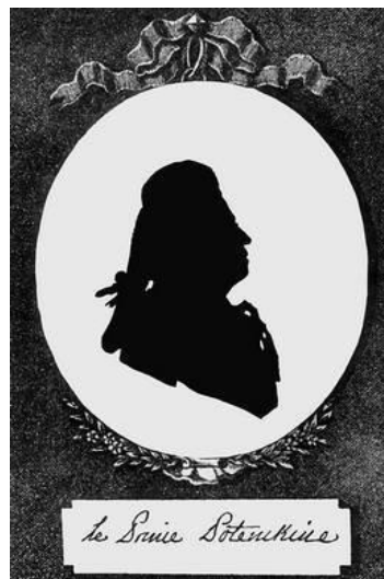
Ф. Сидо. Портрет князя Г. А. Потемкина и портрет самой Императрицы

В семнадцатом, восемнадцатом и девятнадцатом веках в качестве дешевого и быстрого изображения портрета стали популярны силуэты. Зачастую создаваемые любителями, в основном женщинами, они являются сентиментальной реликвией викторианской эпохи, милыми сувенирами с нарисованными неизвестными людьми из прошлого, застывшими в чернилах, красках, вырезанными из бумаги или отображенными на фарфоре. В Европе как самостоятельный вид графики искусство силуэта сформировалось впервой половине XVIII в. во Франции. В это время были и профессиональные рисовальщики силуэтов. В основном мужчины, которые рекламировали свою скорость и аккуратность исполнения работы. А в середине девятнадцатого века несколько художников создали машины и устройства, которые помогали аккуратно дублировать силуэты.