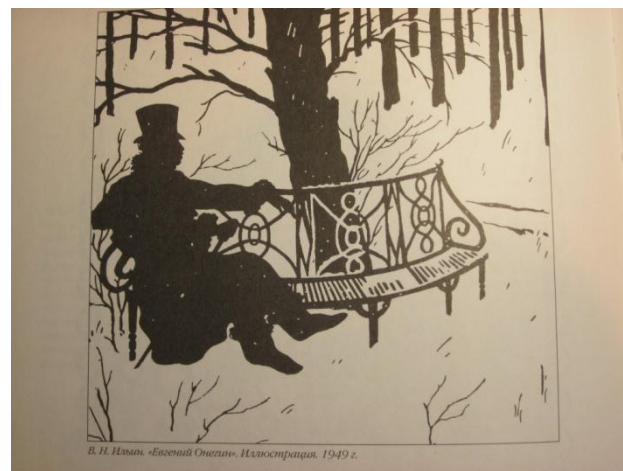
В.Ильин «Евгений Онегин». Иллюстрация. 1949 г.