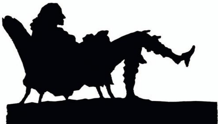
Ж. Юбер. Вольтер

В силуэтном рисунке не может быть случайностей, он лаконичный, выразительный. С его помощью можно делать реалистические и декоративные изображения.