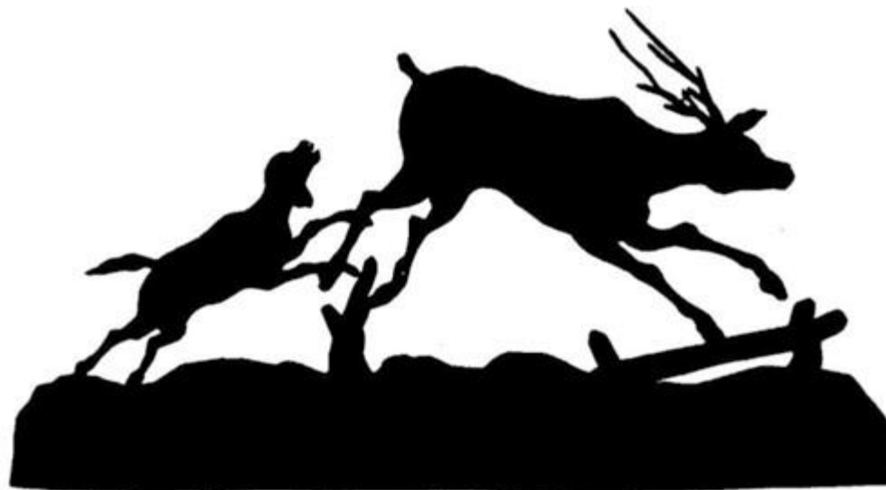
Ф.Толстой Сцена охоты.

Мастером миниатюрного силуэтного портрета был Дмитрий Иванович Евреинов (1742—1814). Лучшим мастером силуэта начала XIX века был русский художник-дилетант граф Федор Толстой . Его пейзажи с батальными или сельскими сценами в силуэтах, искусно вырезанные из бумаги, хорошо передают увлечения общества пушкинского времени.