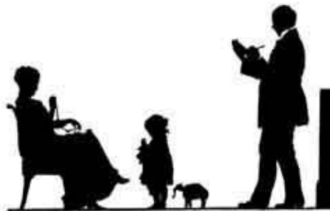
Георгий Нарбут. Автопортрет с семьей.

К графике относятся все виды гравюры — ксилография, линогравюра, литография, офорт, сухая игла, гравюра на картине. Существует промышленная и прикладная графика: марки, наклейки на спичечных коробках, торговые этикетки, денежные знаки.