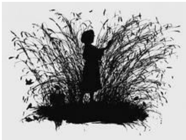
Е. М. Бём. Силуэт из цикла "Дети". 1875. Бумага, тушь, перо. Санкт-Петербург, Русский музей

Художница Елизавета Меркурьевна Эндагурова — псевдоним Бём (1843—1914). Выпускница Рисовальной школы Общества Поощрения художеств, Е. Бём издавала книги для детей, произведения писателей русской натуральной школы, иллюстрированные собственными силуэтами с мельчайшей проработкой деталей пером и тушью.