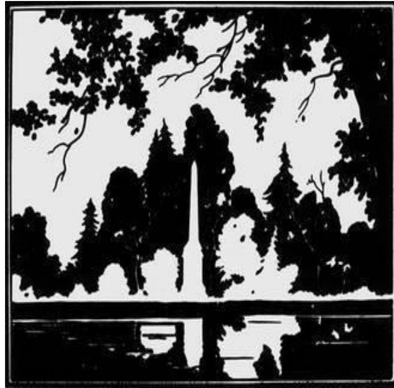
Н. В. Ильин. Иллюстрация к книге: А. С. Пушкин. Лирика. Москва, 1949. Коллаж из черной и белой бумаги