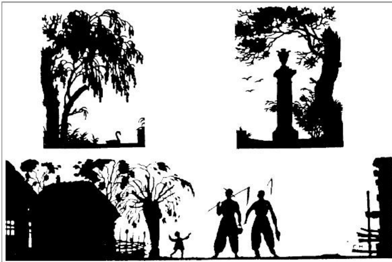
Г.Нарбут. Силуэтные рисунки.