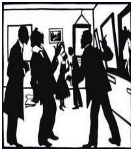
Е. Кругликова. На выставке «Мира искусства».

В России искусством силуэта особенно увлекались известные художники М. В. Добужинский , Е. С. Кругликова , Н.В.Ильин. В XX веке наиболее частой сферой бытования силуэта была книжная графика, иллюстрации. Сообщники "Мира искусства", возвращаясь к традициям русской культуры прошлых веков, оценили прелесть силуэтных изображений: появились изумительные силуэтные иллюстрации Г. Нарбута к сказкам Г. Андерсена и басням А. Крылова. Силуэт предстает в работах Сомова, Добужинского, Александра Бенуа, Остроумовой-Лебедевой, Кустодиева, Д. И. Митрохина, С. В. Чехонина, В. Н. Левитского.