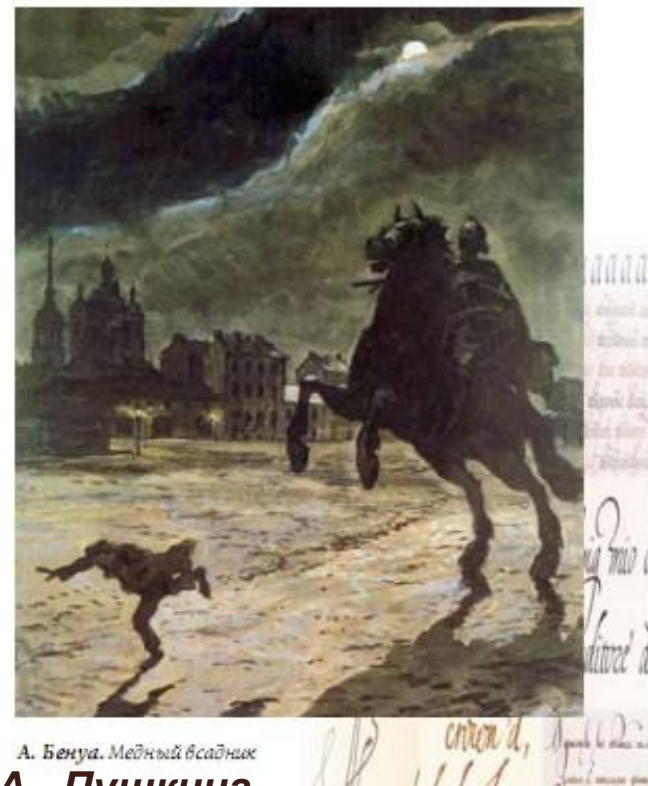
А. Бенуа. Медный всадник

В иллюстрациях А. Бенуа к произведениям А. Пушкина объединились большая эрудиция и безупречный вкус. Рисунки Бенуа к «Пиковой даме», «Медному всаднику», «Капитанской дочке» — явление высокой художественной культуры.