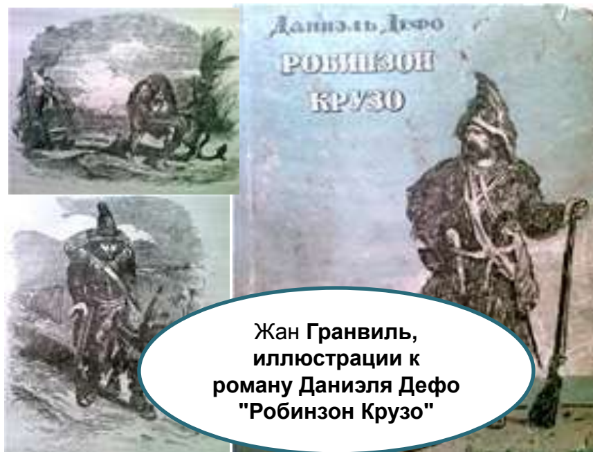
Жан Гранвиль, иллюстрации к роману Даниэля Дефо "Робинзон Крузо"