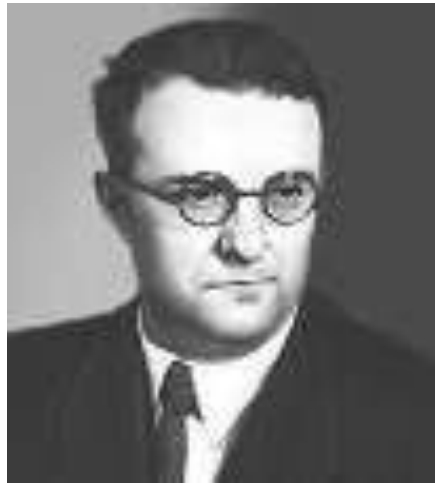
Георгий Васильевич Свиридов

В XX в. жанр иллюстрации представлен не только в книжной графике. Уникальным явлением в истории русской музыкальной культуры стало создание иллюстраций к литературным произведениям в музыке. Это и «Музыкальные иллюстрации к повести А. Пушкина «Метель» Г. Свиридова, и Симфонические гравюры «Дон Кихот» К. Караева к одноименному роману М. Сервантеса.