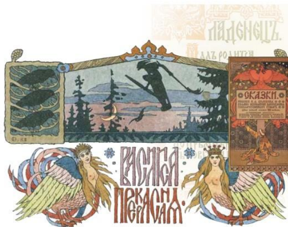
И. Билибин. Василиса Прекрасная