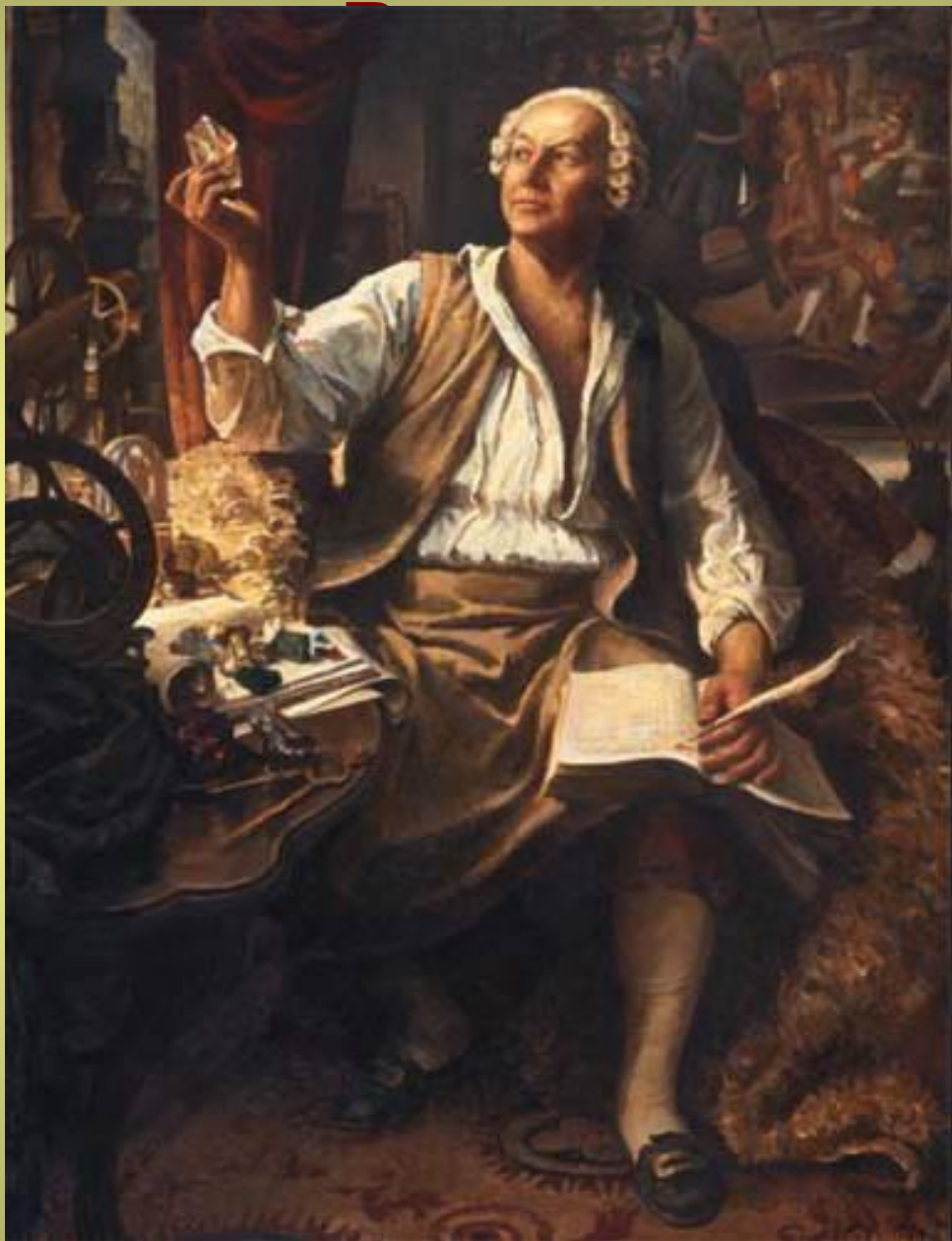
Ломоносов в лаборатории Ломоносову на Руси Ломоносов