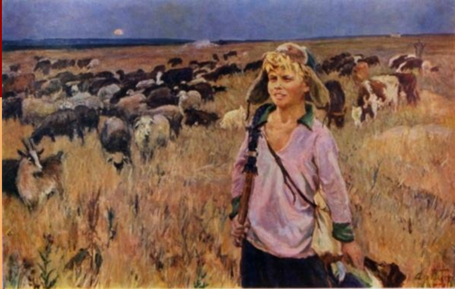
А. Пластов. Витя-подпасок