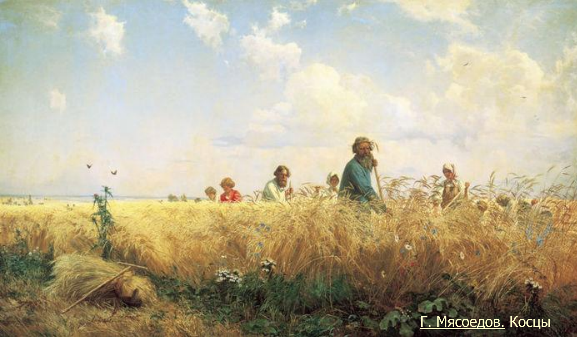
Г. Мясоедов. Косцы

Картина полна поэзии, строгого, торжественного чувства. Композиция картины – вытянутый по горизонтали прямоугольник. На переднем плане из золотого хлебного моря выходят косцы. Первый старик богатырь, за ним косцы помоложе, последний – совсем юный. Их лица спокойны, в движениях нет ни натуги, ни усталости. На голове у старшего крестьянина, словно корона, венок из золотых колосьев.