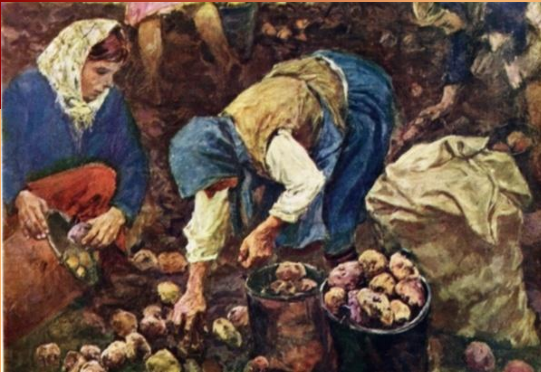
А. Пластов. Сбор картофеля