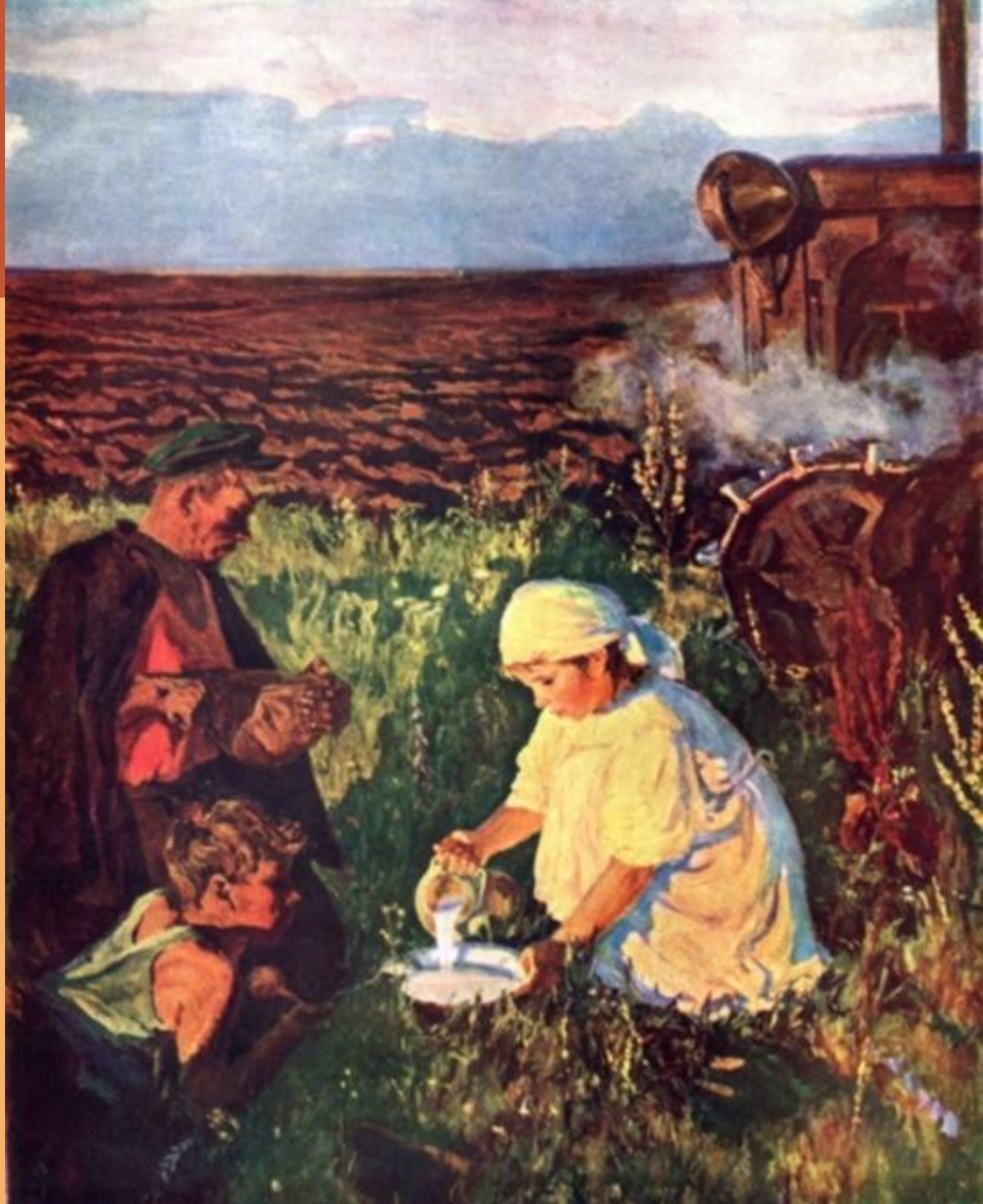
А. Пластов. Ужин тракториста.