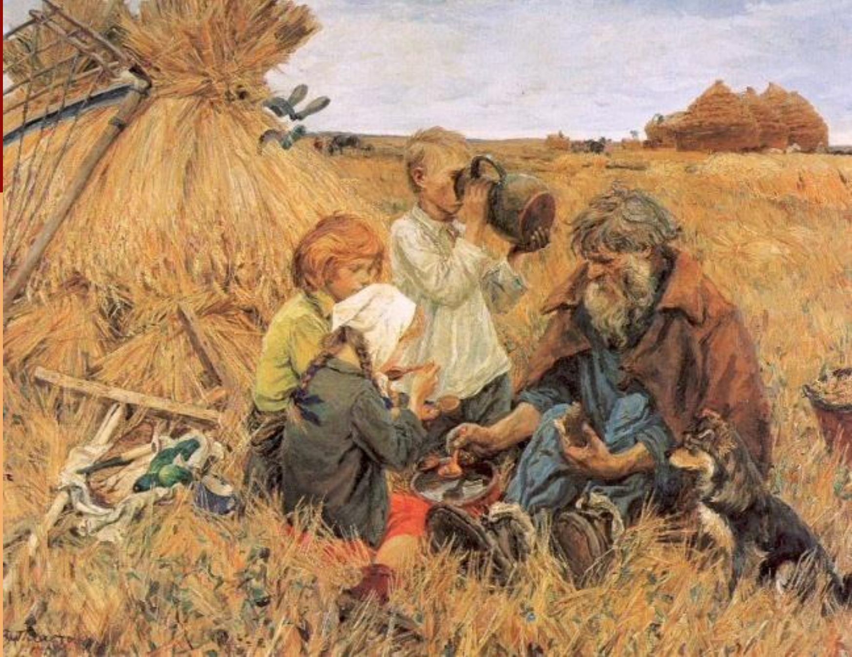
А. Пластов. Жатва