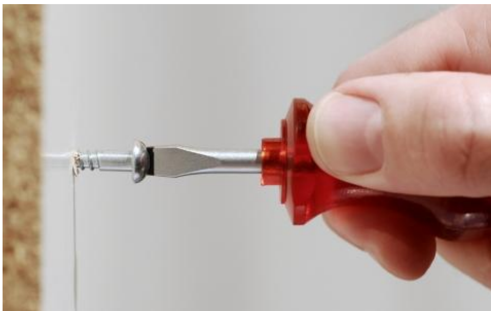
Винтик и отвертка