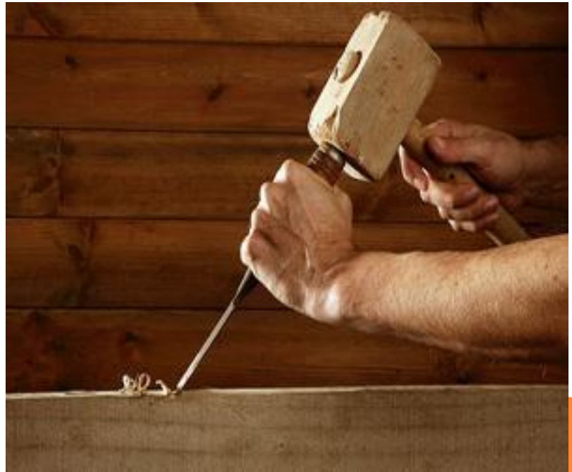
Долото и молоток Шестипёров