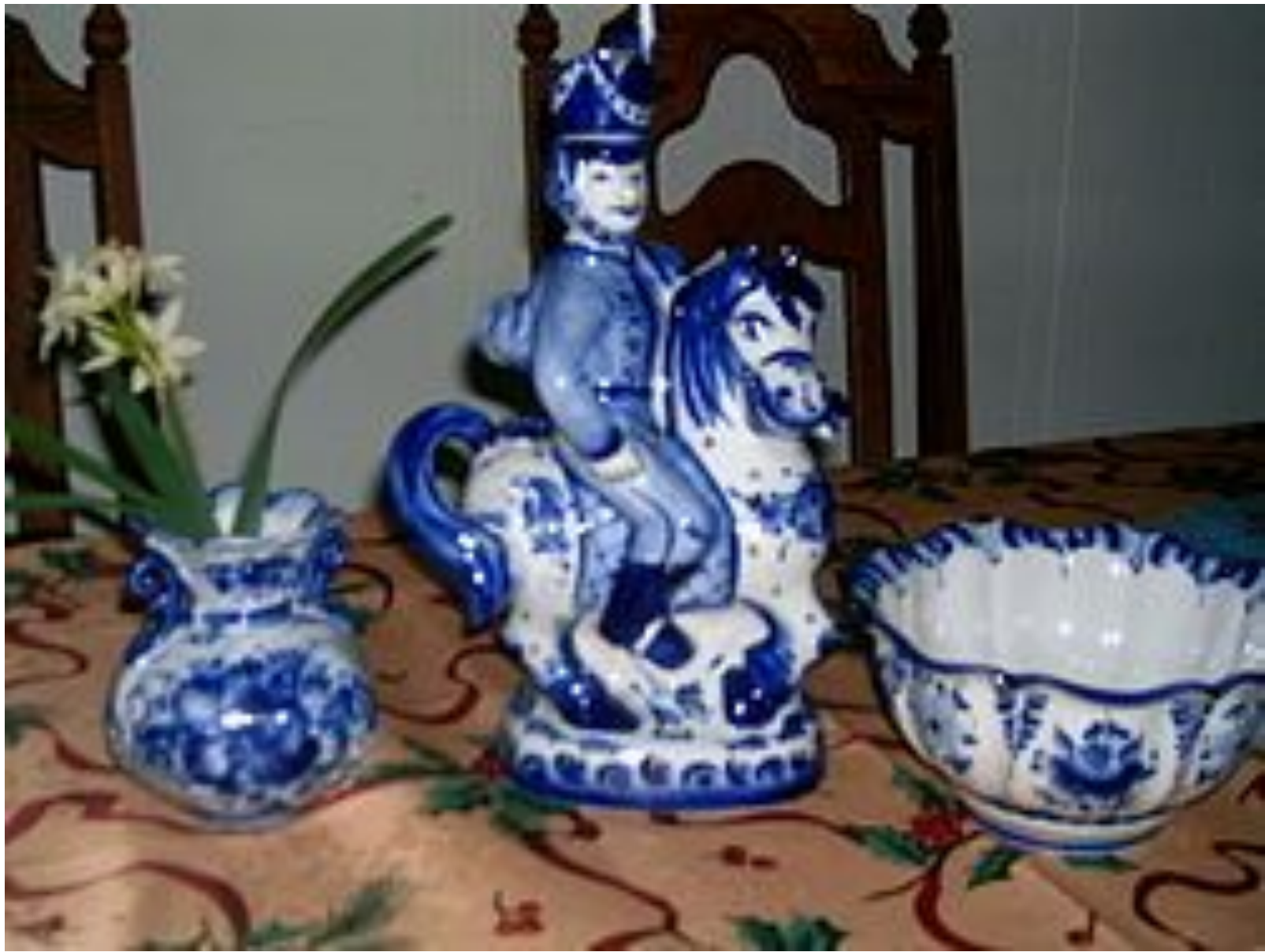
Гжель на фарфоре