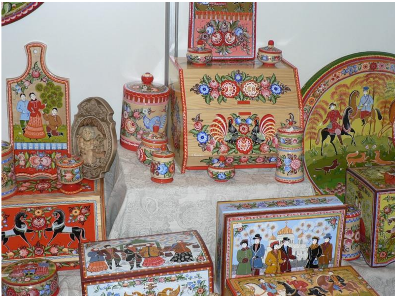
Городецкая роспись Калинкина В.