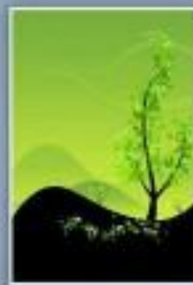
"Change Of Seasons" by Silveryn