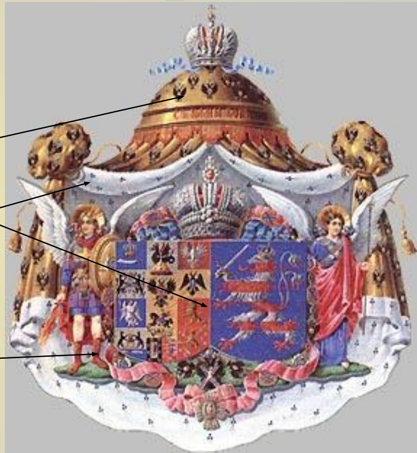
Герб Их Величеств Императриц