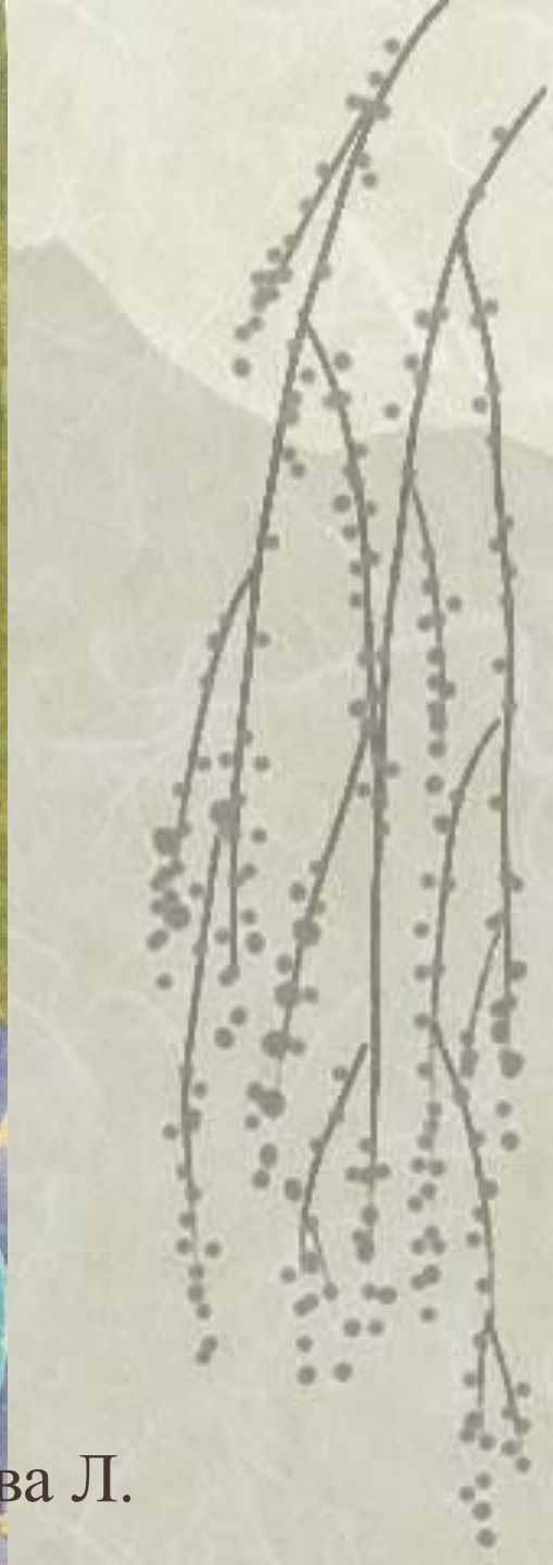
Работа Брюханова Л.