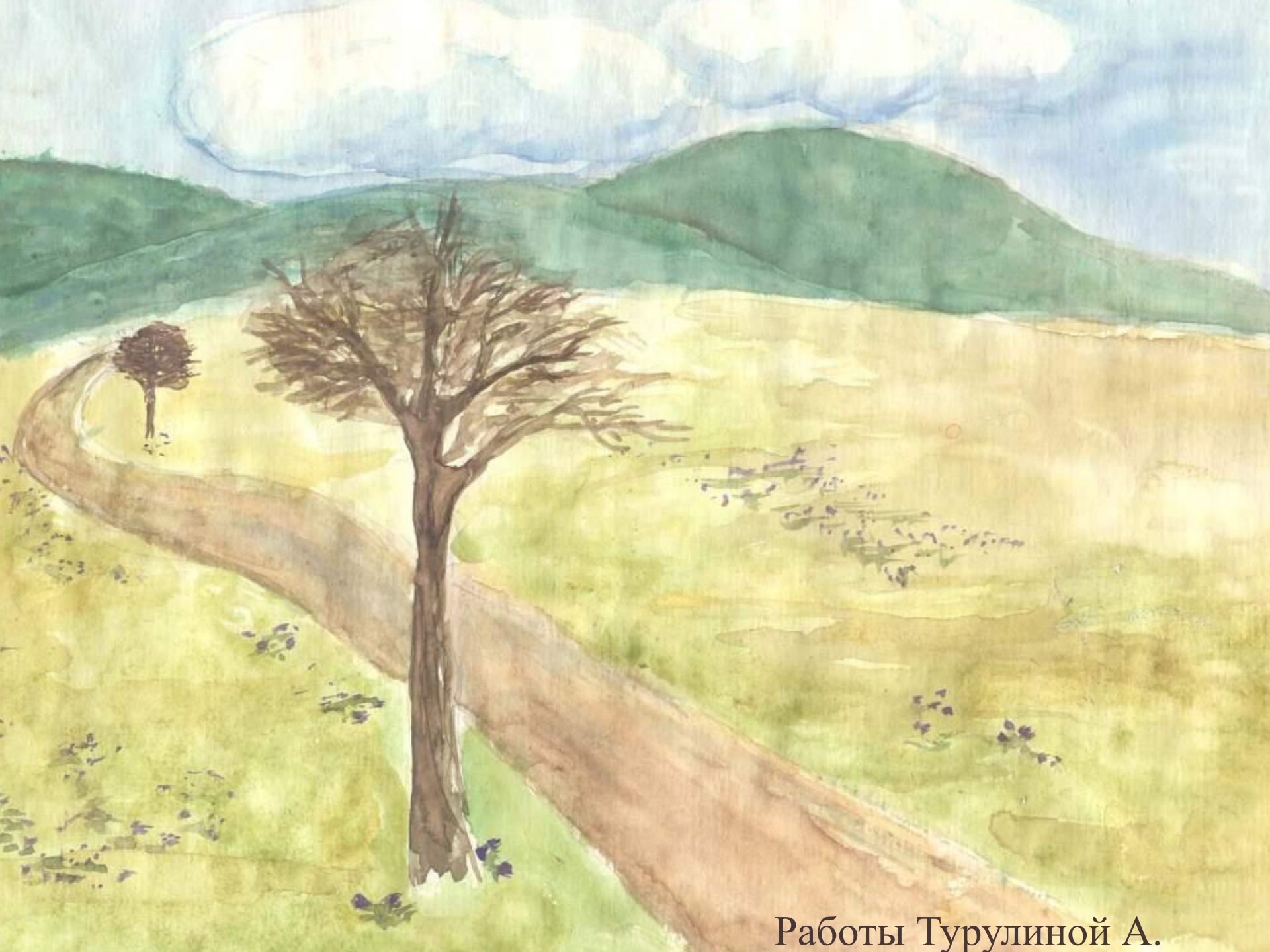
Работы Турулиной А.