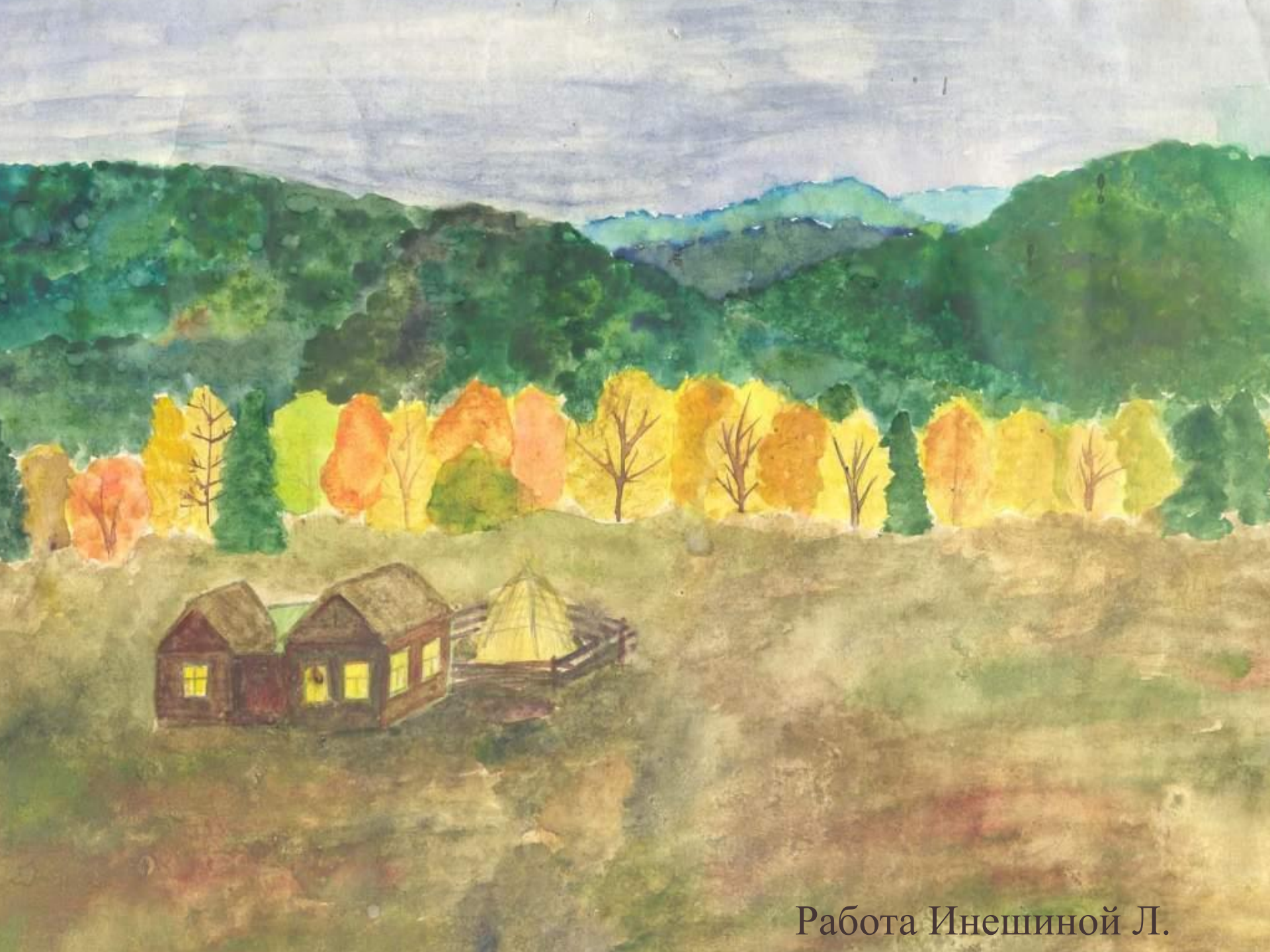
Работа Инешиной Л.