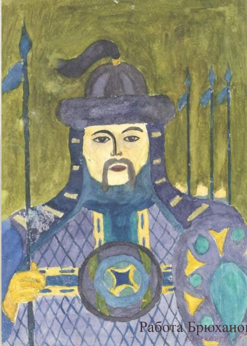
Работа Брюханова Л.