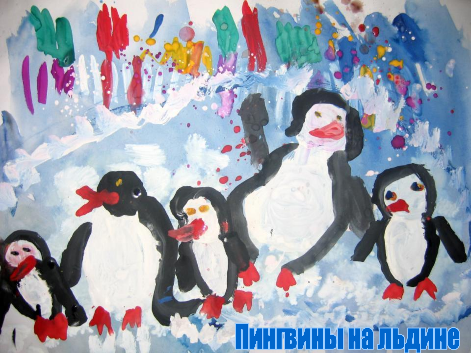
ПИНГВИНЫ НА ЛЬДИНЕ