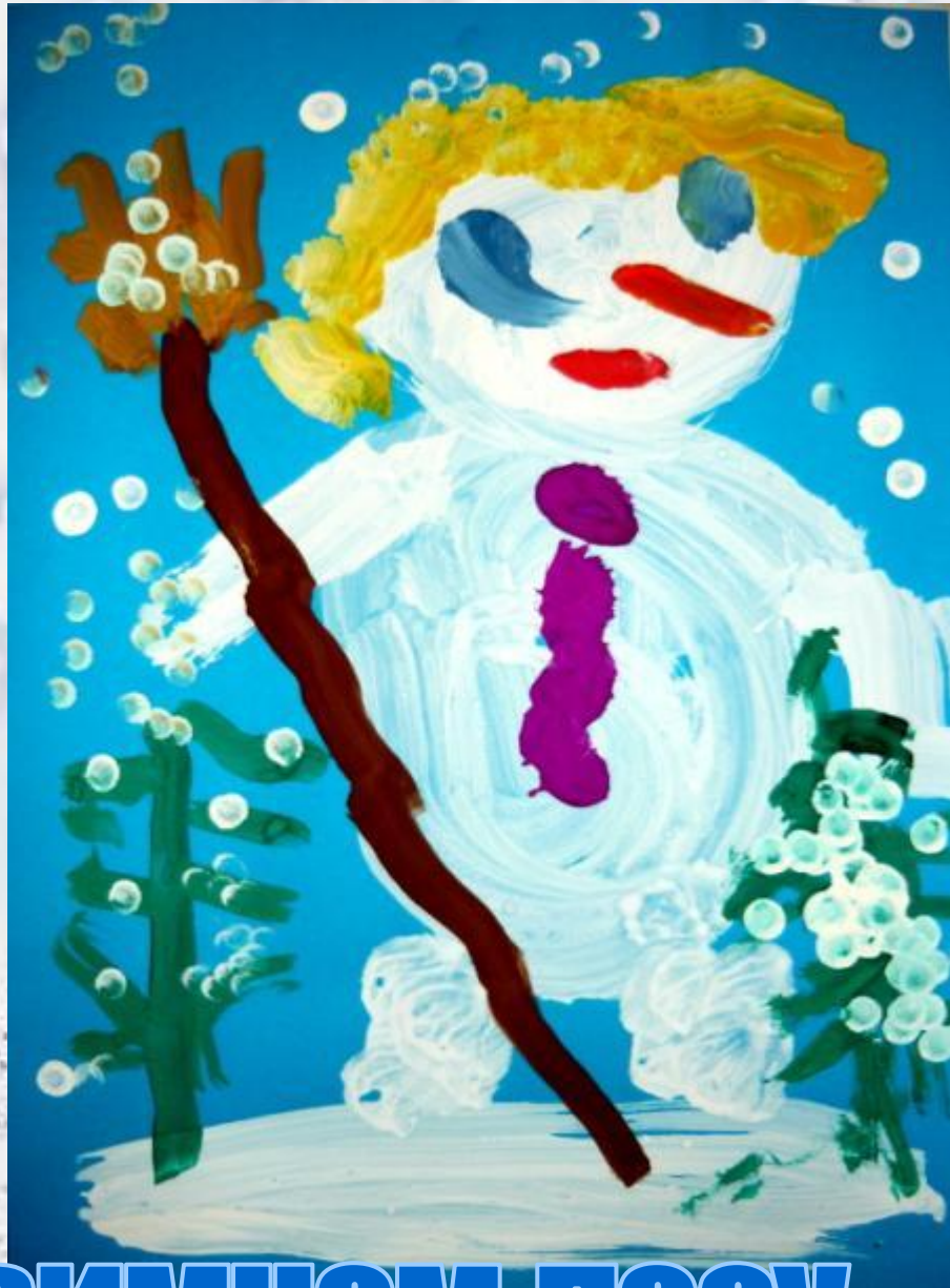
СНЕГОВИКИ В ЗИМНЕМ ЛЕСУ