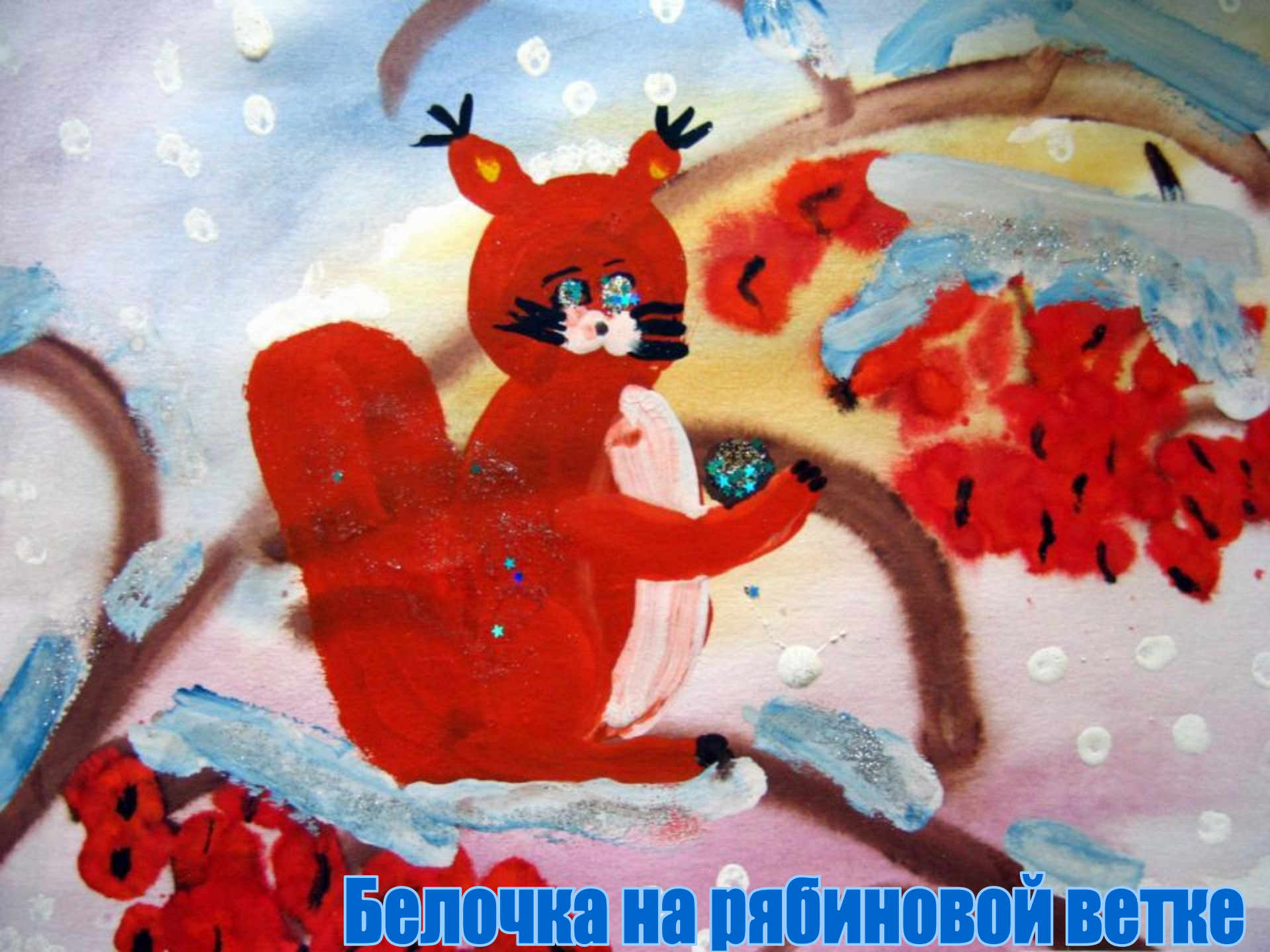
Белочка на рябиновой ветке