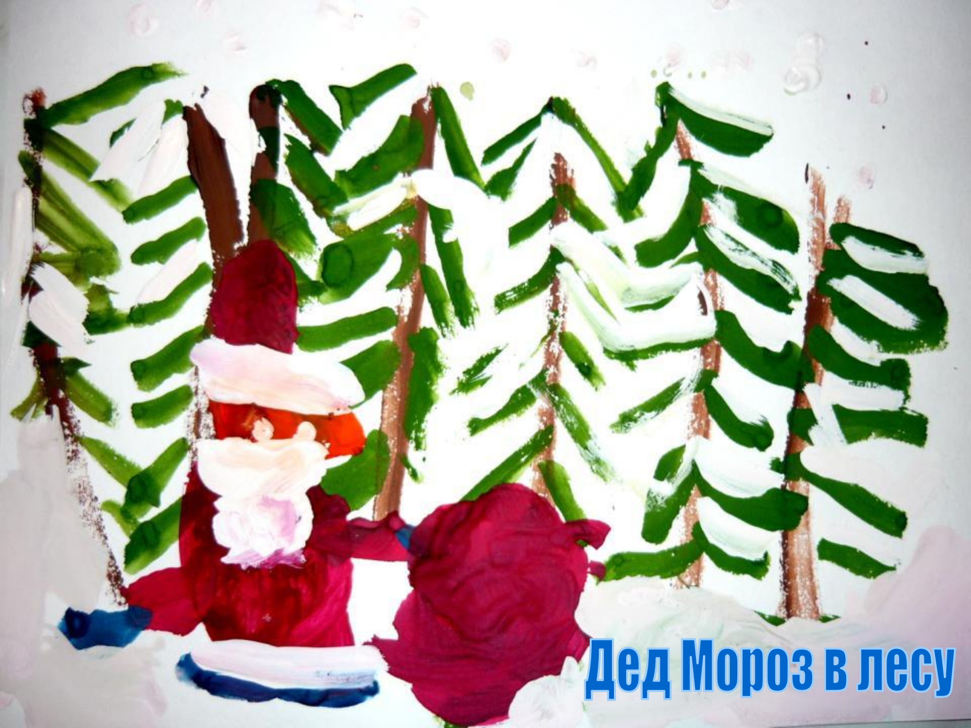
Дед Мороз в лесу