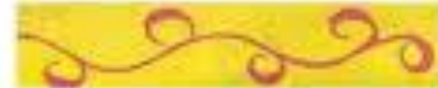
1 этап росписи- стебель.