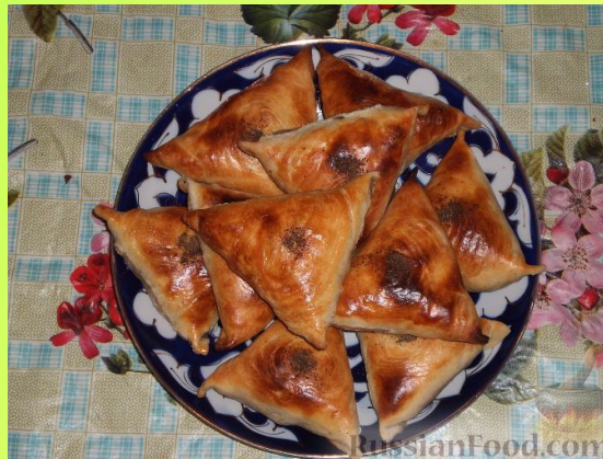
САМСА - ҮЗБӘК МИЛЛИ АШЫ