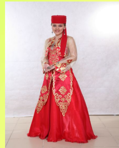
КАЗАК МИЛЛИ КИЕМЕ