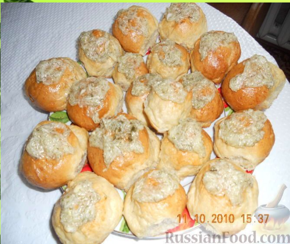
ПАМПУШКИ - УКРАИН МИЛЛИ АШЫ