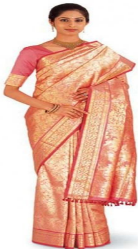
ИНДИЯ МИЛЛИ КИЕМЕ