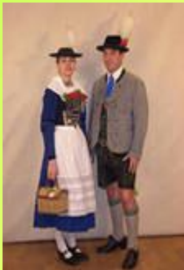
БАВАР МИЛЛИ КИЕМЕ