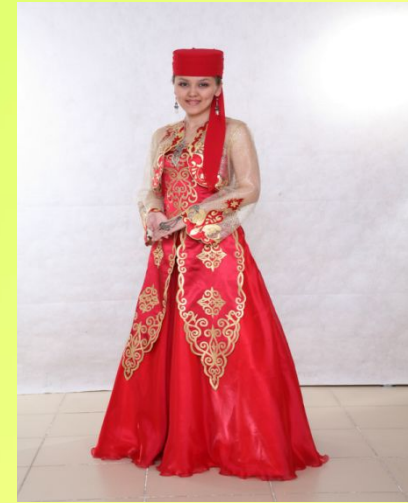
КАЗАК МИЛЛИ КИЕМЕ