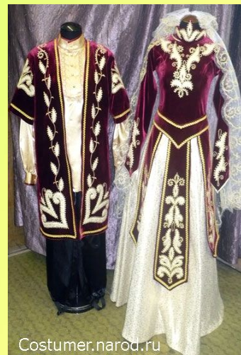
КАВКАЗ МИЛЛИ КИЕМЕ