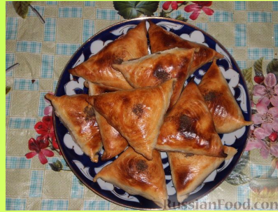
САМСА - ҮЗБӘК МИЛЛИ АШЫ