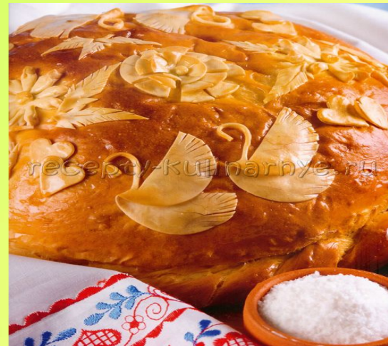
КУРНИК - РУС МИЛЛИ АШЫ