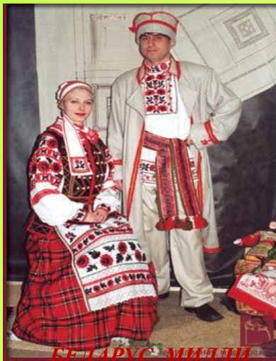
БЕЛАРУС МИЛЛИ КИЕМЕ