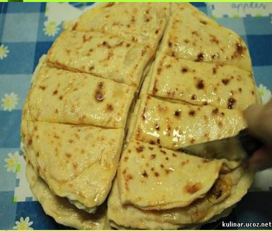
КЫСТЫБЫЙ - ТАТАР МИЛЛИ АШЫ