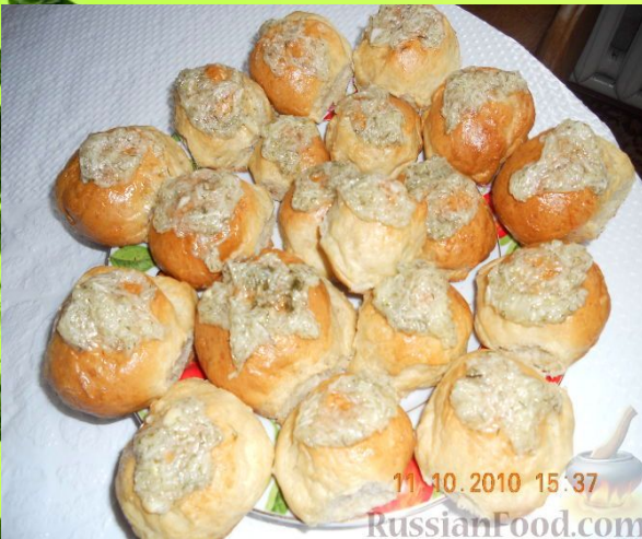
ПАМПУШКИ - УКРАИН МИЛЛИ АШЫ