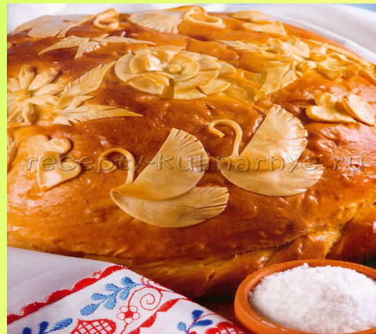
КУРНИК - РУС МИЛЛИ АШЫ