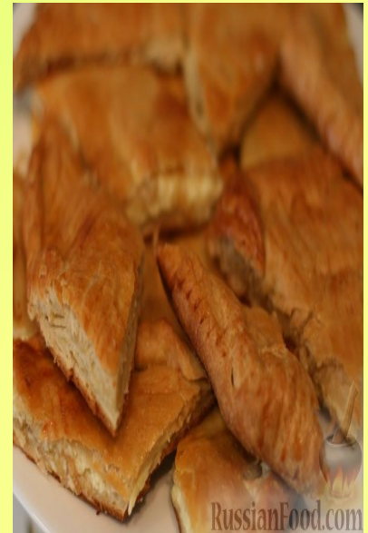
ХАЧАПУРИ - ГРУЗИН МИЛЛИ АШЫ