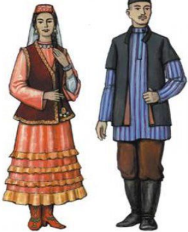
ТАТАР МИЛЛИ КИЕМЕ