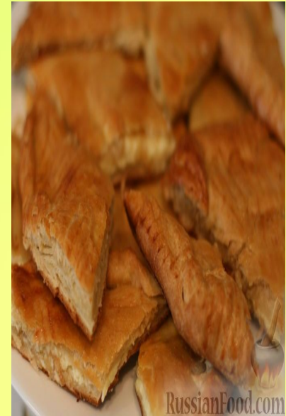
ХАЧАПУРИ - ГРУЗИН МИЛЛИ АШЫ