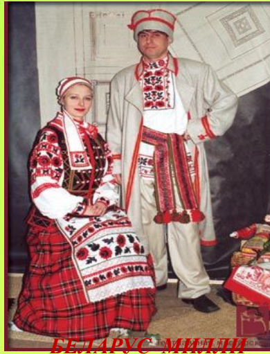
БЕЛАРУС МИЛЛИ КИЕМЕ