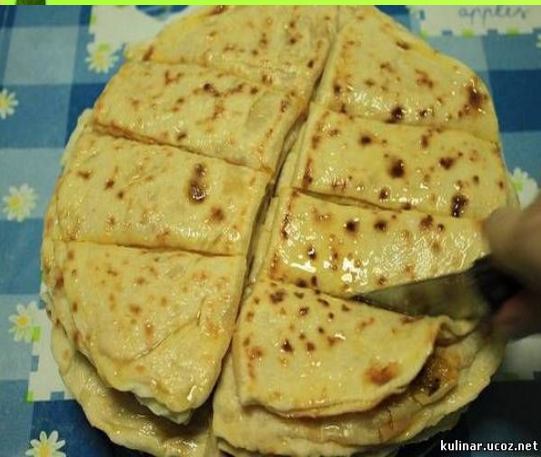
КЫСТЫБЫЙ - ТАТАР МИЛЛИ АШЫ