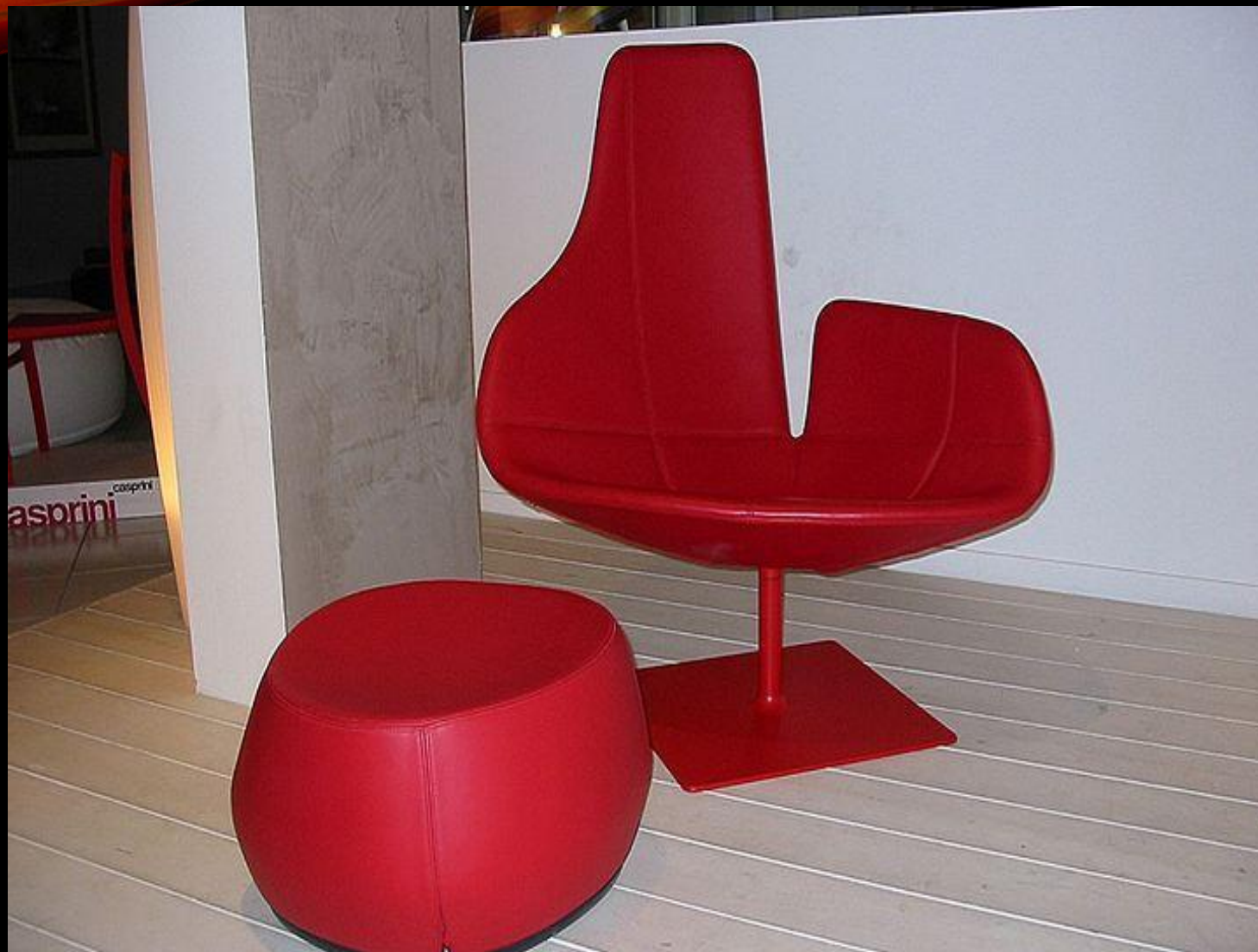
Кресло Fjord в красном исполнении, 2002