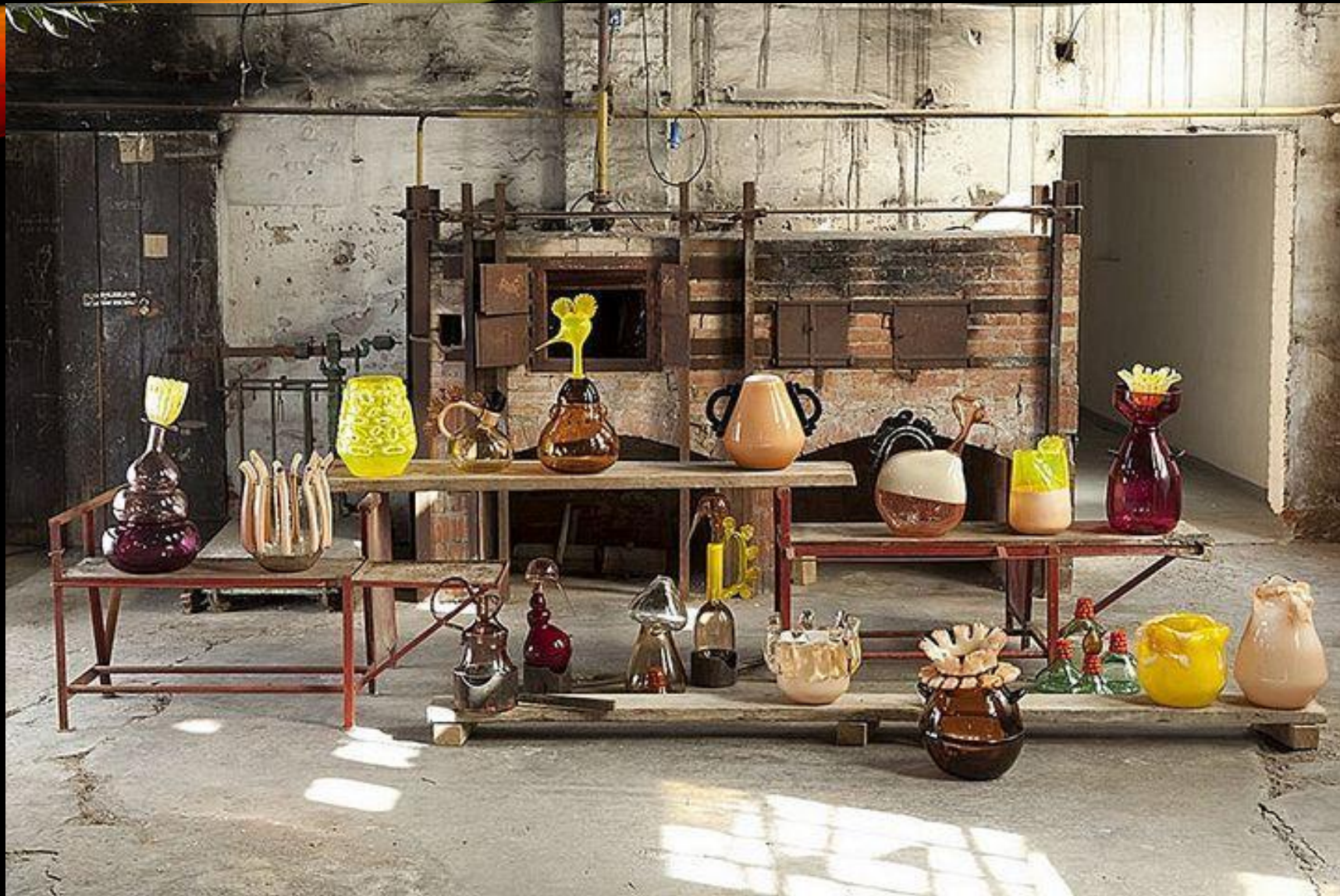
Вазы All Ambiq, інсталляція, 2011