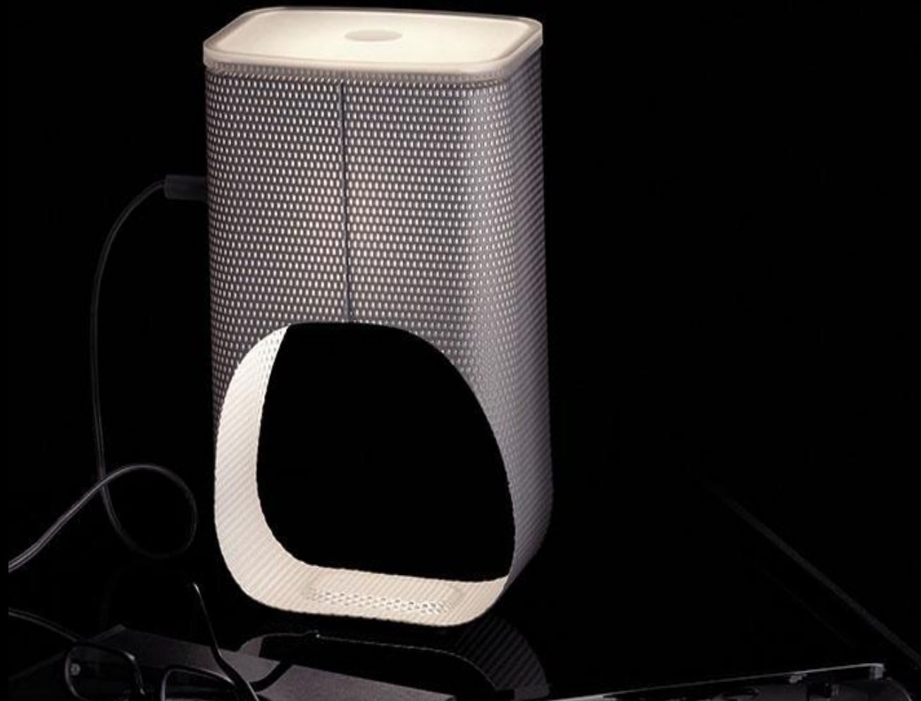
Настольная лампа Ваде, 2008