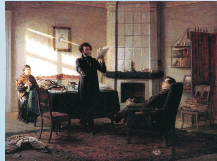
Н.Н. Ге Пушкин в селе Михайловском