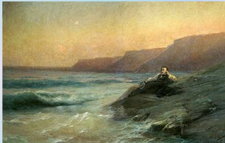
И.К. Айвазовский, "Пушкин на берегу Черного моря"

Ты катишь волны голубые И блещешь гордою красой