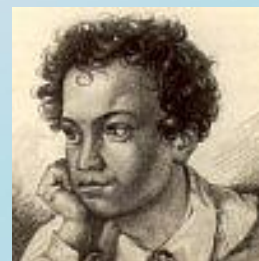
Гравюра на меди