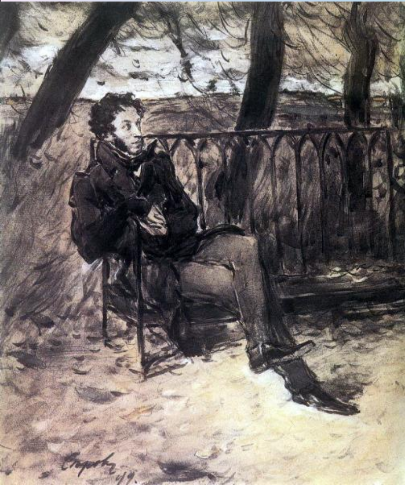
В.А. Серов. "Пушкин в парке"