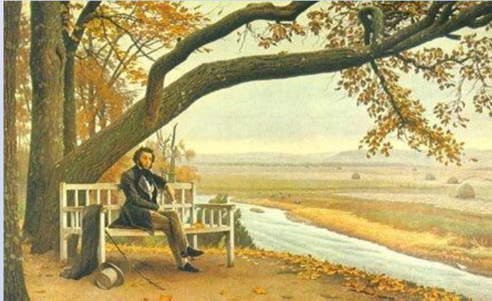
Тригорское (около Михайловского), "Скамья Онегина"