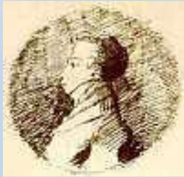
Автопортрет (в круге). 1817-1818 гг. Самый ранний. Предназначался для первой книги стихов поэта