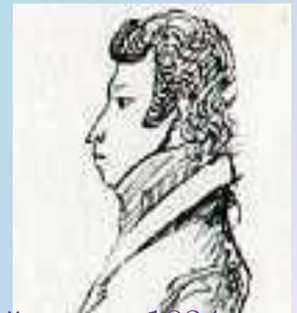
Период ссылки в Михайловское 1824 г