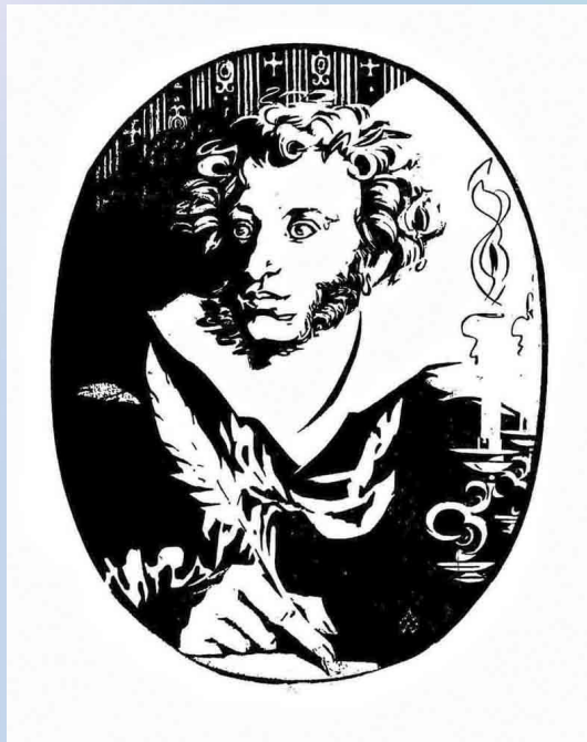
А.С. Пушкин. Эскиз к гравюре. Тушь, перо, кисть