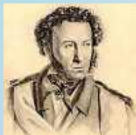
Г. Гиппиус Литография