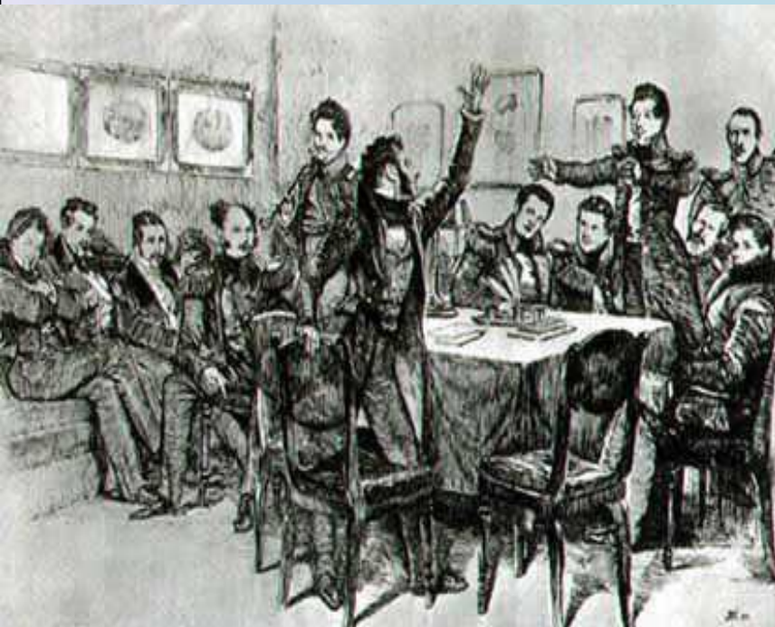
Пушкин среди декабристов в Каменке. Художник Д.Н Кардовский