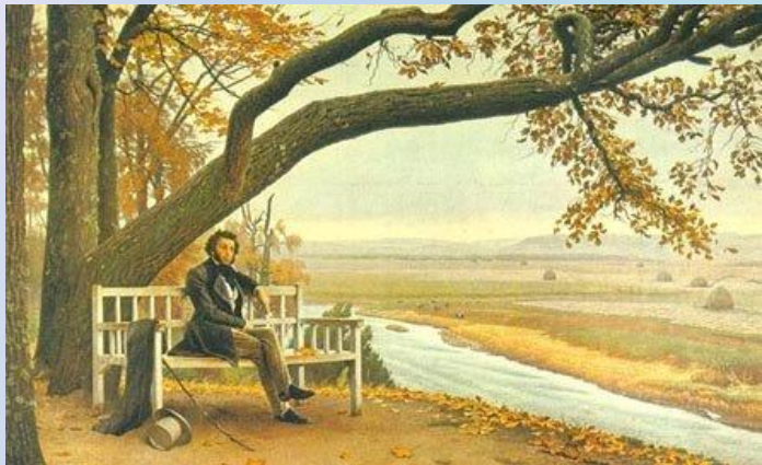
Тригорское (около Михайловского), "Скамья Онегина"