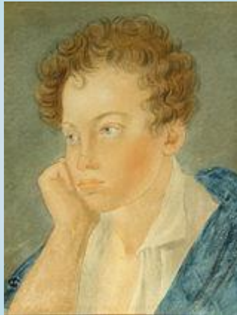
Портрет Пушкина ; Акварель С. Г. Чирикова, 1810