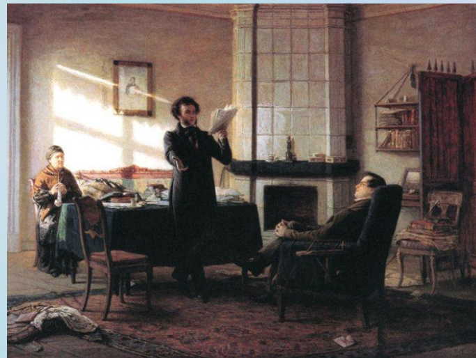
Н.Н. Ге Пушкин в селе Михайловском