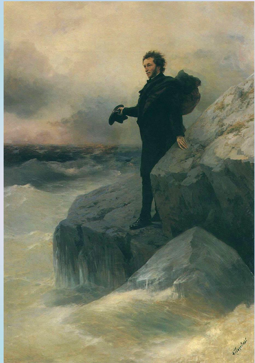
И.К. Айвазовский, И.Е. Репин "Прощание Пушкина с морем"

В леса, в пустыни молчаливы Перенесу, тобою полн, Твои скалы, твои заливы, И блеск, и тень, и говор волн