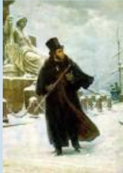
Б.В. Щербаков. "Пушкин в Петербурге"