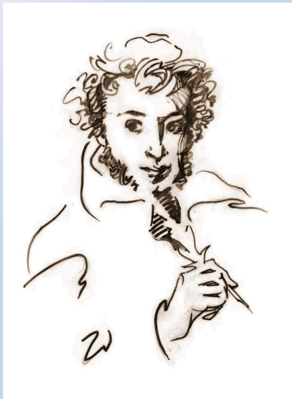
А.С. Пушкин. Рис. Л. Левченко (Еременко). Фломастер