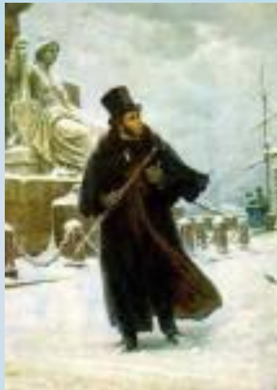
Б.В. Щербаков. "Пушкин в Петербурге"