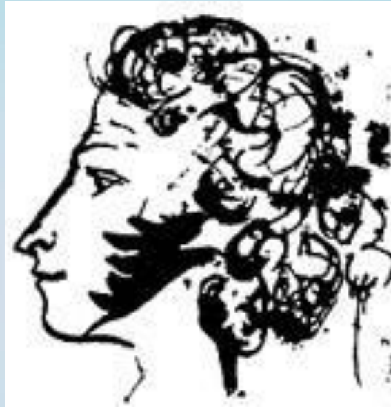
Автопортрет на листе, вклеенном в альбом Е.Н. Ушаковой. 1829г