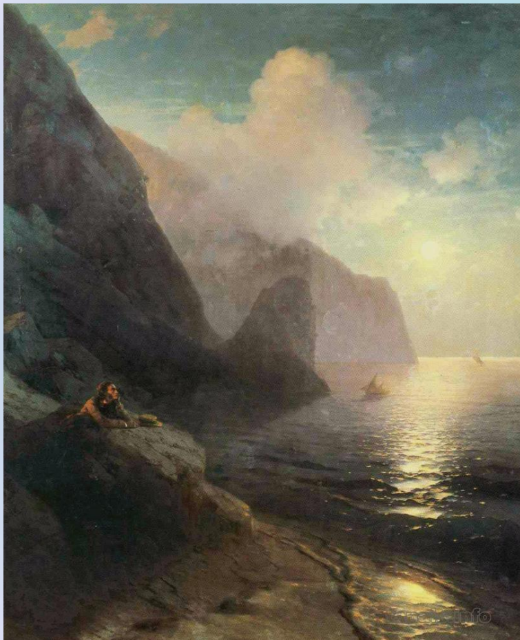
И.К. Айвазовский, Пушкин в Крыму у Гурзуфских скал

Прощай, свободная стихия! В последний раз передо мной