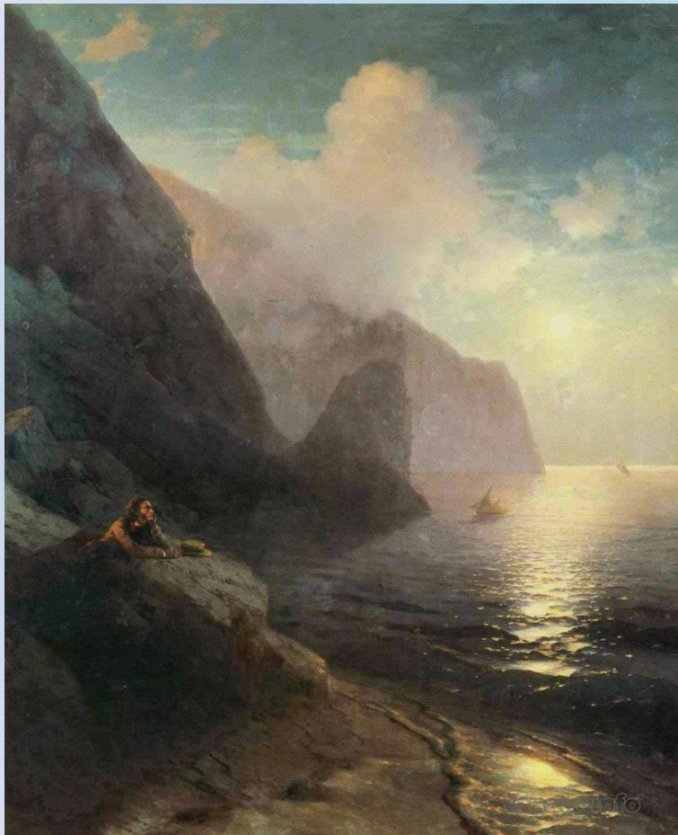
И.К. Айвазовский, Пушкин в Крыму у Гурзуфских скал

Прощай, свободная стихия! В последний раз передо мной