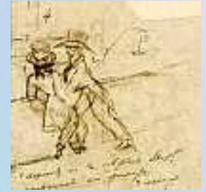
Пушкин и Онегин. Начало ноября 1824 г. Автоиллюстрация к первой главе "Евгения Онегина". Письмо к брату Льву Сергеевичу