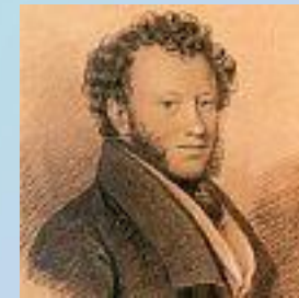
И. Е. Вивьен