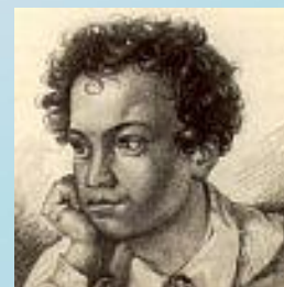
Гравюра на меди