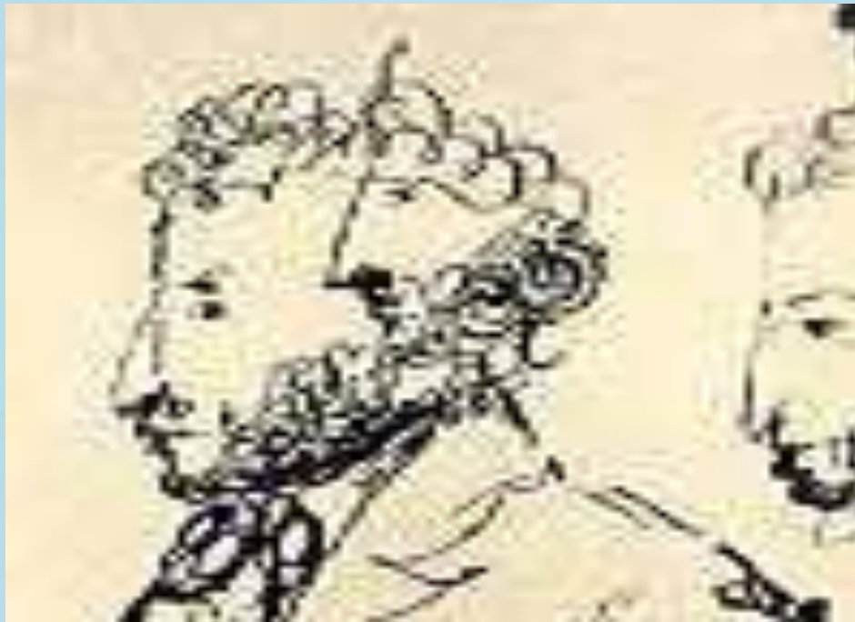
Н.В. Гоголь. "Наброски профиля Пушкина". 1837 г