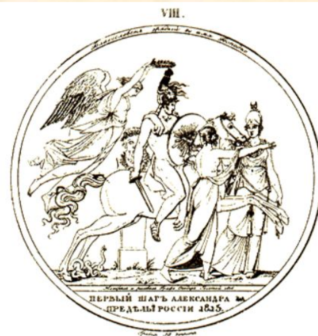
Толстой Федор Петрович Медаль «Первый шаг Александра за пределы России»

Уткин Николай Иванович ПЕРВЫЙ ШАГ АЛЕКСАНДРА ЗА ПРЕДЕЛЫ РОССИИ 1816