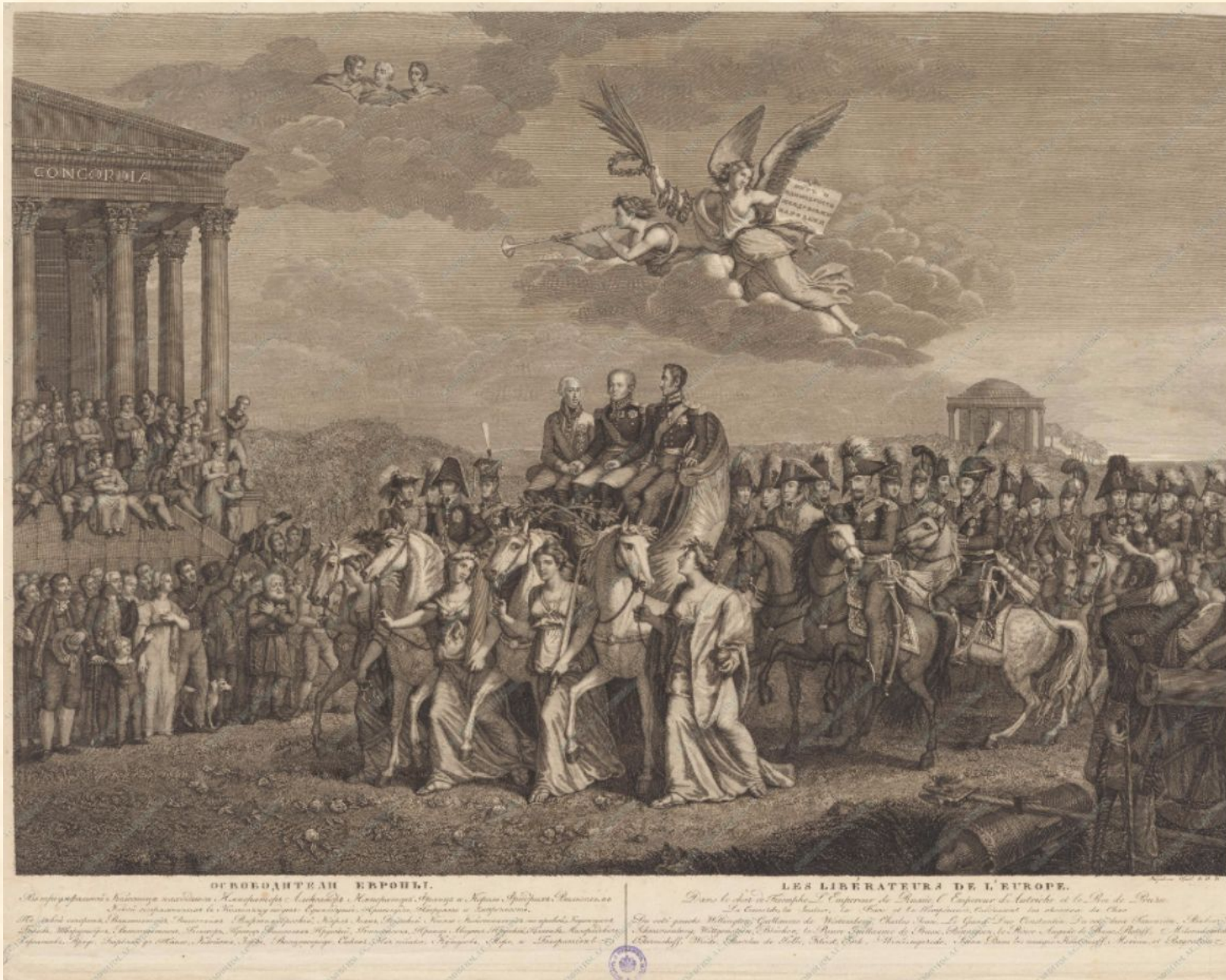
Карделли Сальватор АЛЛЕГОРИЯ «ОСВОБОДИТЕЛИ ЕВРОПЫ» 1815 С оригинала Ф.-Г. Вейча. Офорт, резец. 572x741; 555x720 мм.