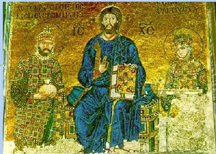
Мозаика Софийского Собора