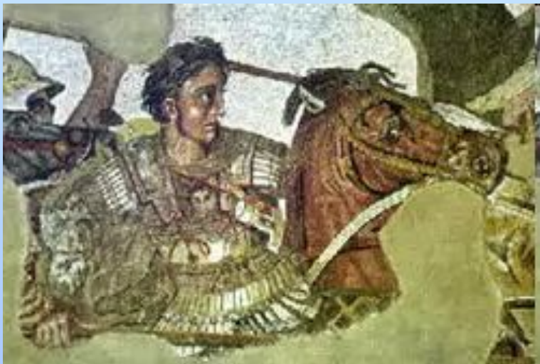
Мозаичное панно, прославляющее подвиги Александра Македонского, Помпеи