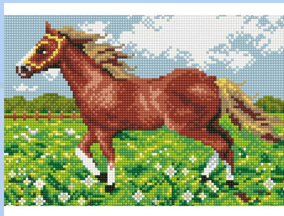
3. Алмазная мозаика