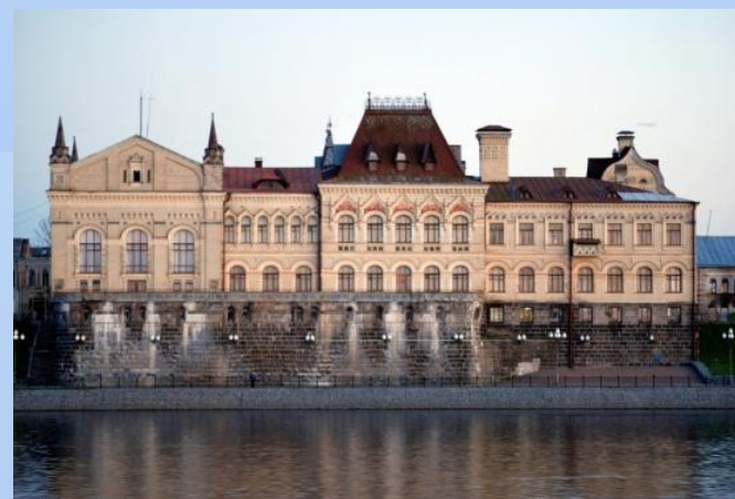
Идея 4. Мой город