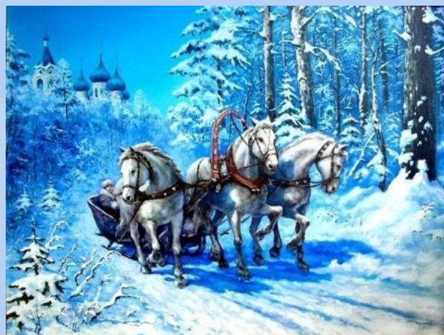
Идея 3. Животные