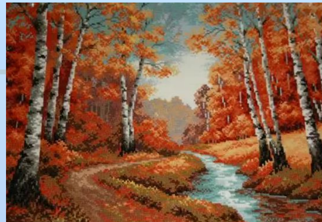
2. Картина бисером