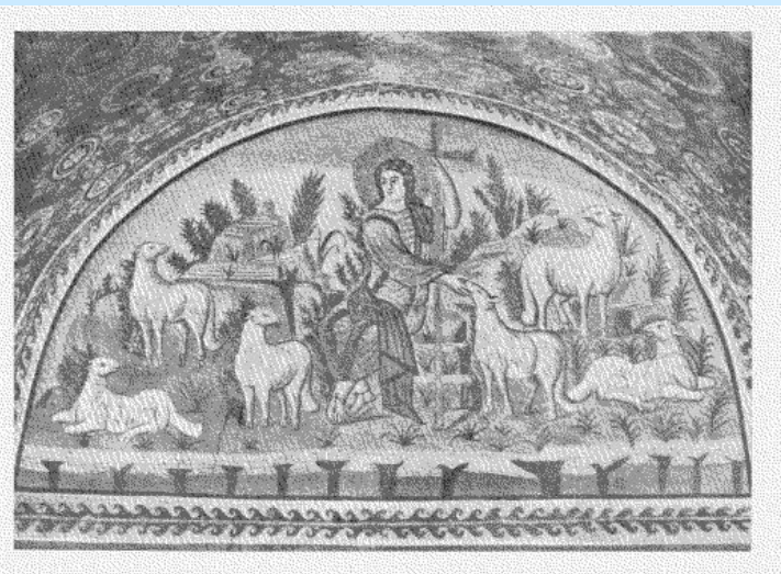
Мозаика в мавзолее Галлы Плацидии в Равенне (5 век нашей эры)