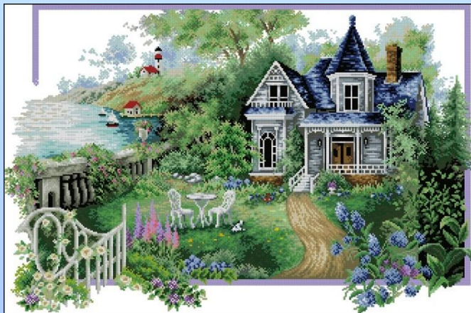
1. Картина, вышитая крестом