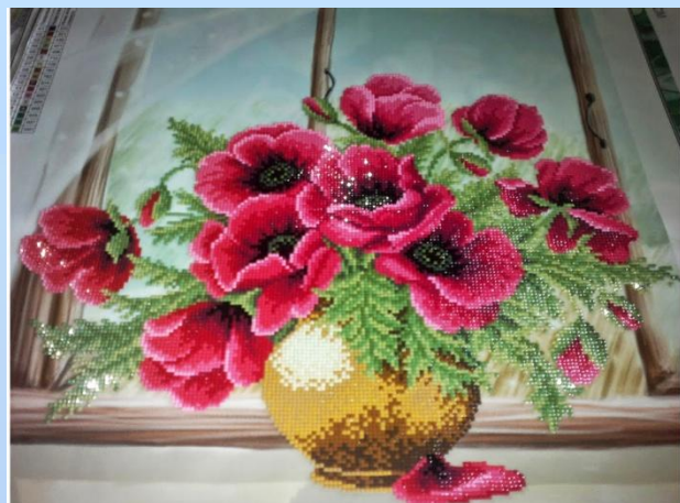
Идея 1. Цветы