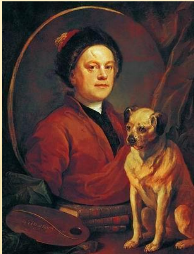
АВТОПОРТРЕТ С СОБАКОЙ 1745