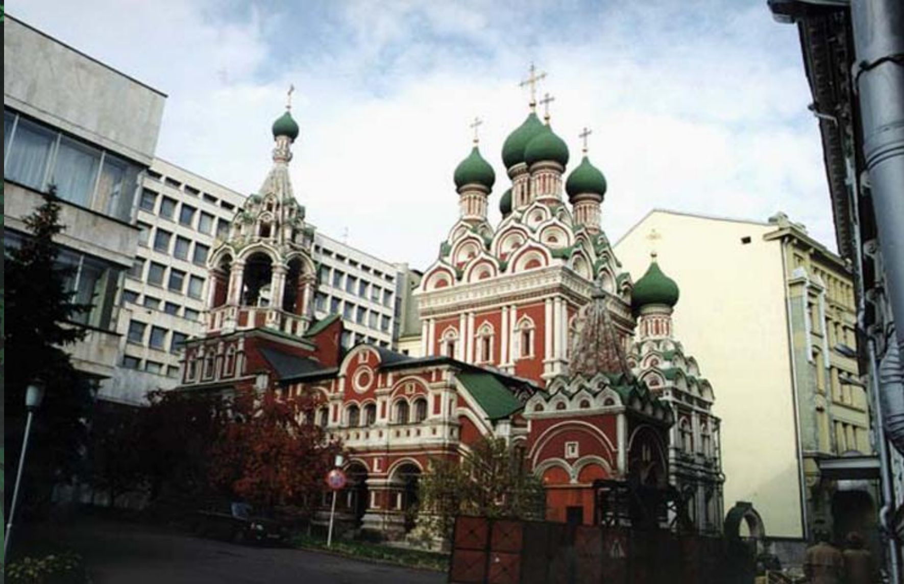
Церковь Троицы в Никитниках