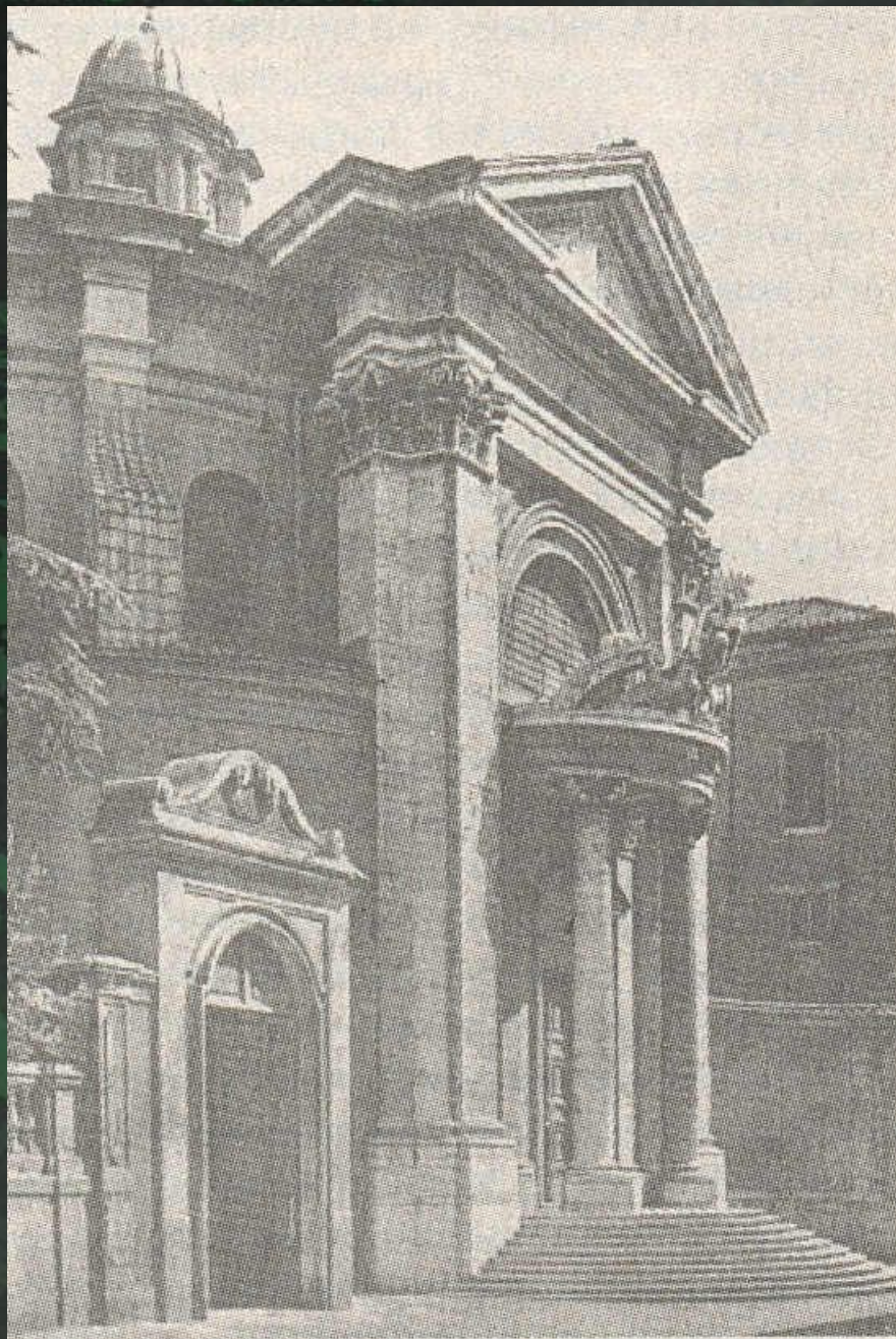
Церковь Сант – Андреа аль Квиринале в Риме. (1658 г.)