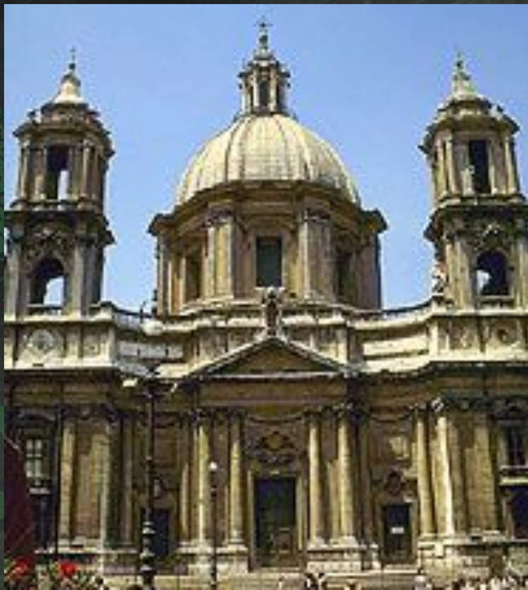
Церковъ Сант Анъезе В Риме. 1653 г.