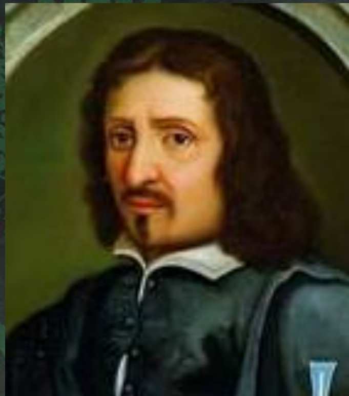
Франческо Борромини (1599 – 1667 г.г.)