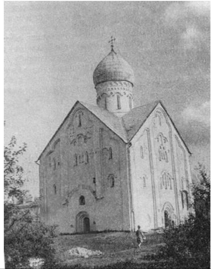
Церковь спаса на Ильине улице. 1374.