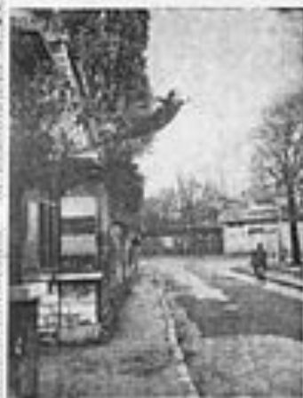
Le peintre de l'espace se jette dans le vide !

Le théâtre du vide est une forme d'art qui se situe à la limite de la peinture et de la sculpture. Il s'agit d'une œuvre qui se crée dans l'espace, à l'aide de matériaux légers et fragiles, et qui est destinée à être vue dans un espace réel. Cette forme d'art a été inventée par Yves Klein, qui a cherché à dépasser les limites de la peinture traditionnelle en créant des œuvres qui se fondent dans l'espace environnant.