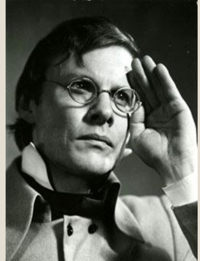
В. Соломин в роли Чацкого