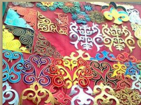
Қазақтың кестелі ою-өрнектері