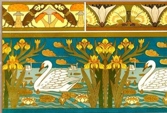
Арт-деко стилінің ою-өрнектері