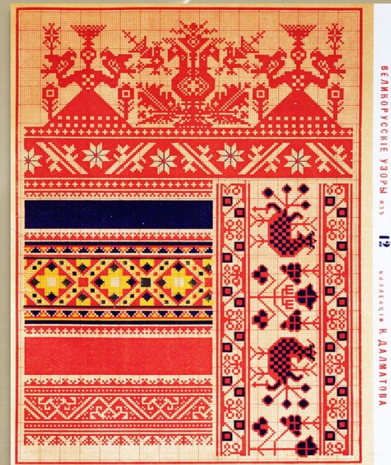
Орыс кестелі ою-өрнектері