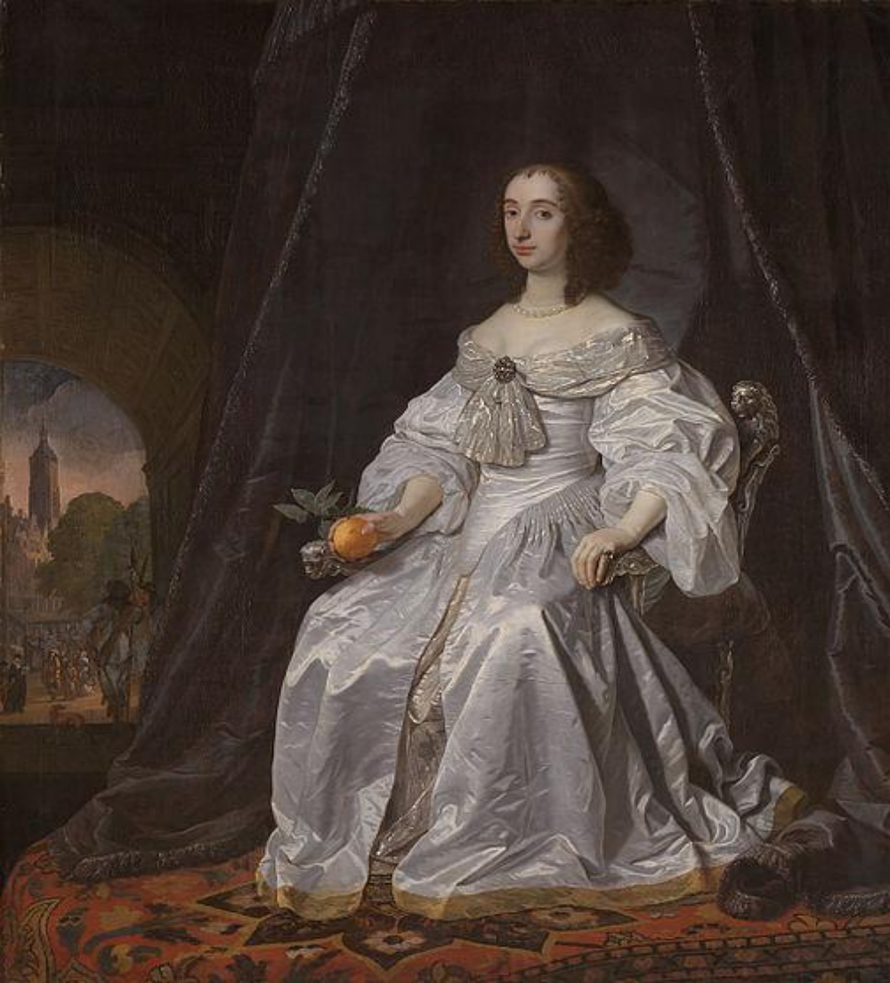
Принцесса Генриетта Мэри Стюарт.