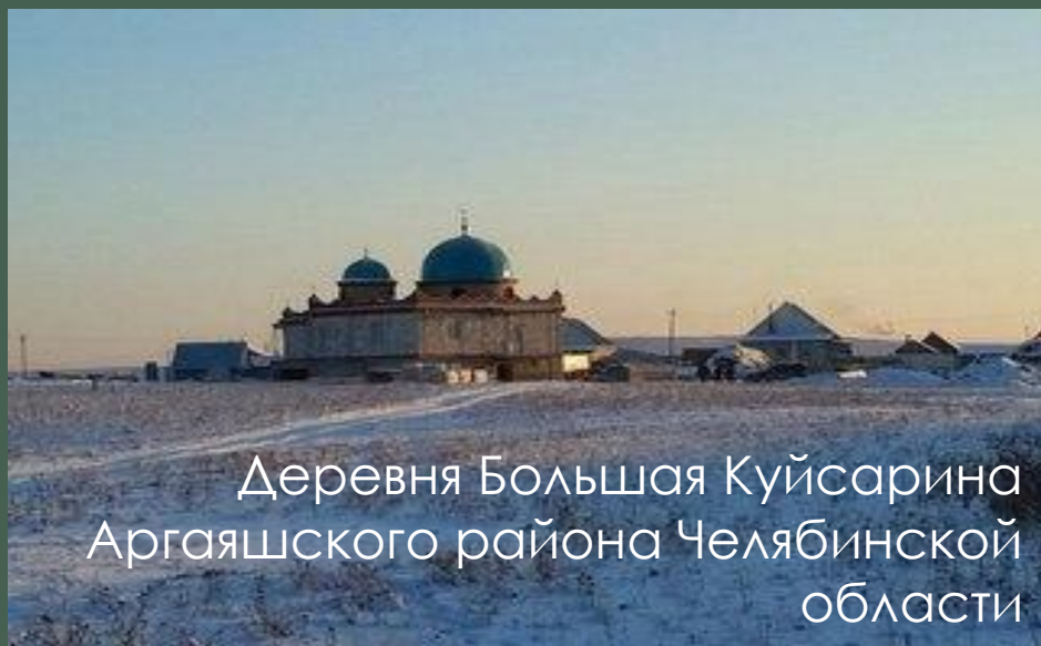
Деревня Большая Куйсарина Аргаяшского района Челябинской области