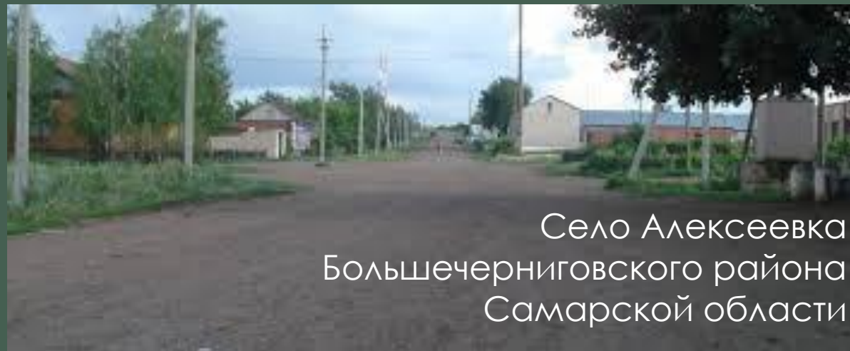
Село Алексеевка Большечерниговского района Самарской области