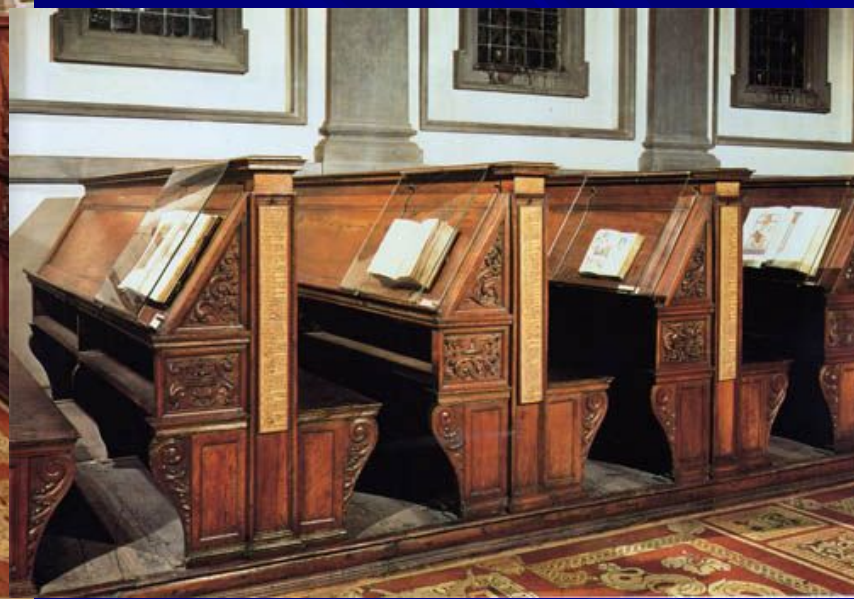
Читальный зал библиотеки Лауренциана. 1524. Библиотека Лауренциана, Флоренция.