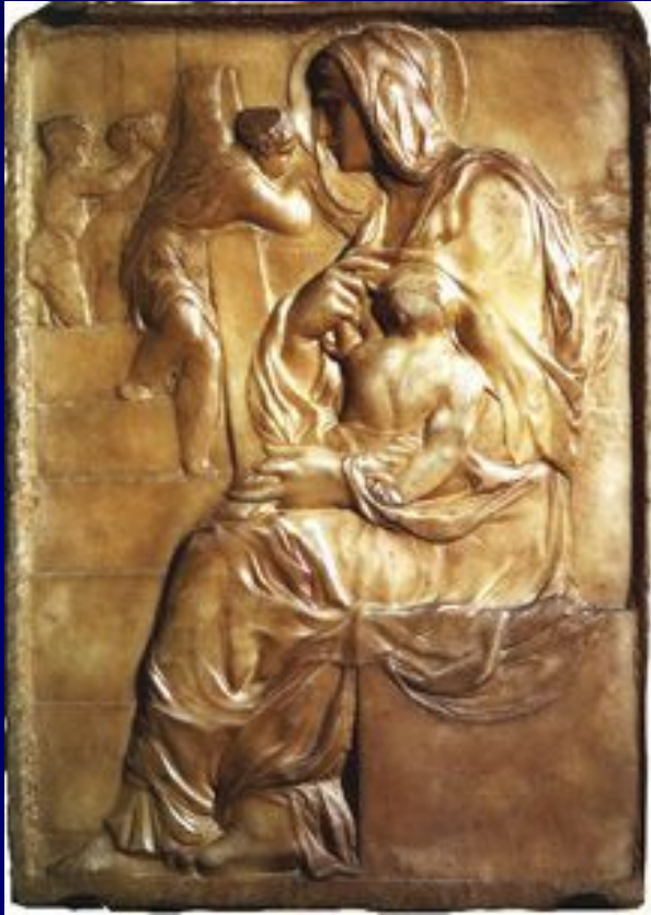
Мадонна у лестницы, 1490. Мрамор. Размер: 56,7 x 40,1 см. Музей Буонарроти, Флоренция.