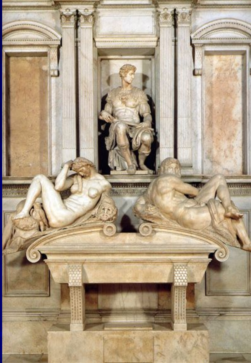
Гробница Джулиано Медичи, герцога Немурского (Капелла Медичи). 1526-1531. Мрамор. Новая сакристия церкви Сан-Лоренцо, Флоренция.