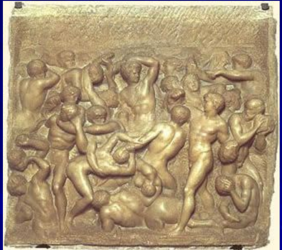
Битва кентавров. ок.1492. Мрамор. Размер: 84,5 x 90,5 см. Музей Буонарроти, Флоренция.