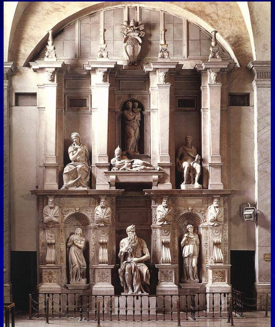
Гробница папы Юлия II: Моисей. ок. 1515. Мрамор. Высота: 235 см. Церковь Сан Пьетро ин Винколи, Рим