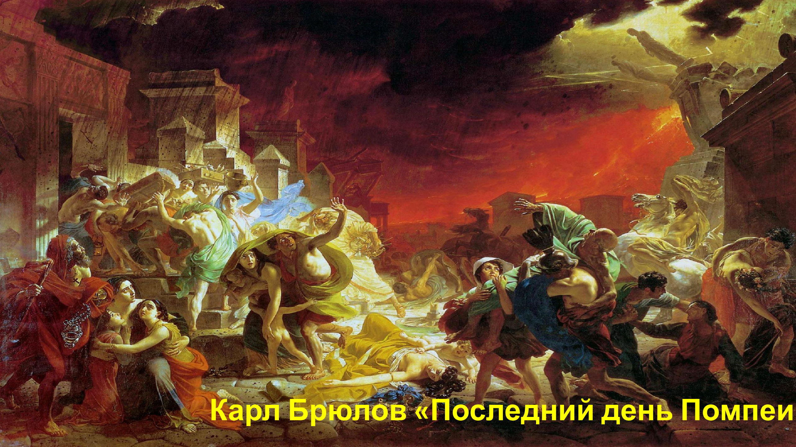
Карл Брюллов «Последний день Помпеи»