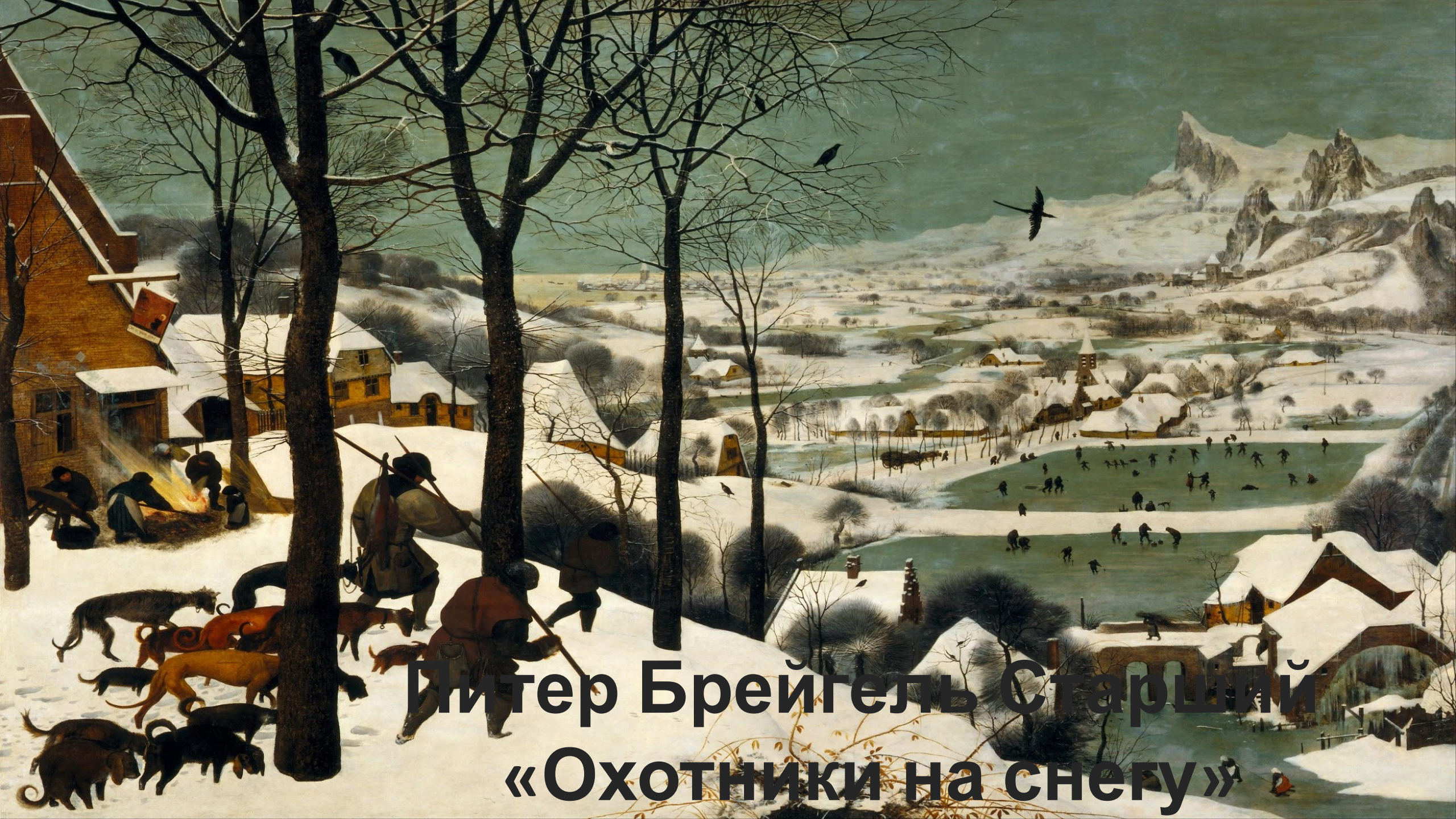
Питер Брейгель Старший «Охотники на снегу»