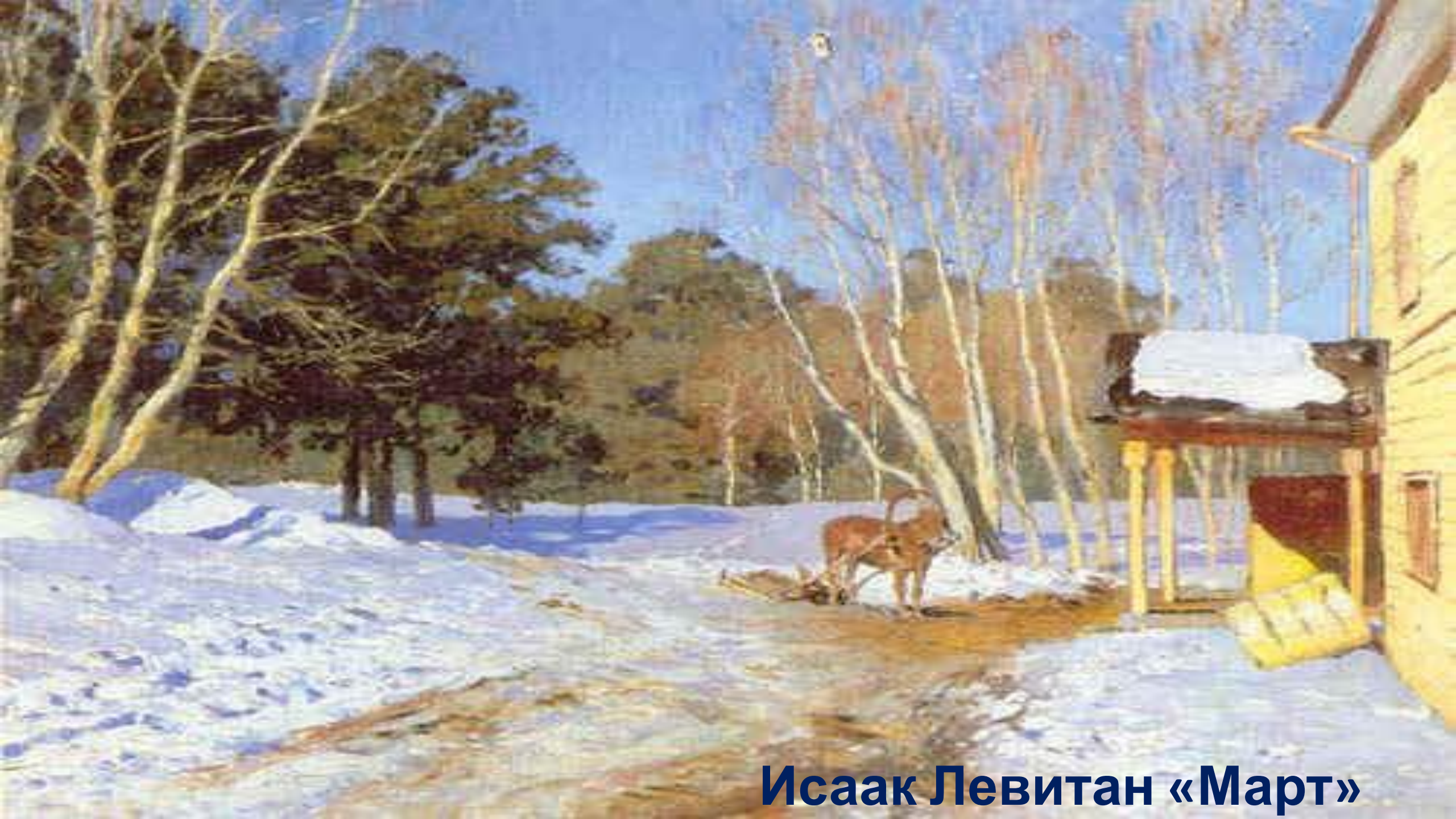
Исаак Левитан «Март»