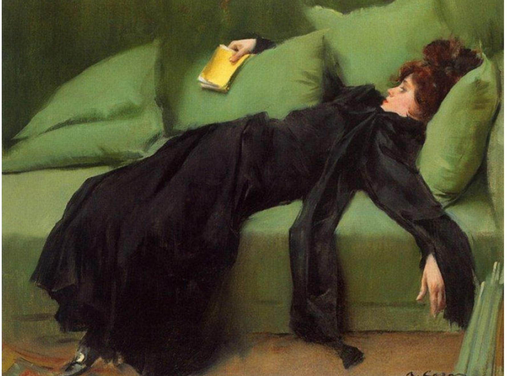
Рамон Касас «Юная декадентка» 1899