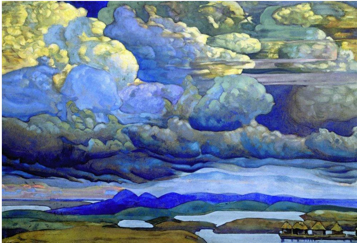
Николай Рерих «Небесный бой» 1912

Символистам присвоили кличку “декаденты” (“упадочники”). Думали их уязвить, а они сделали кличку своим вторым именем