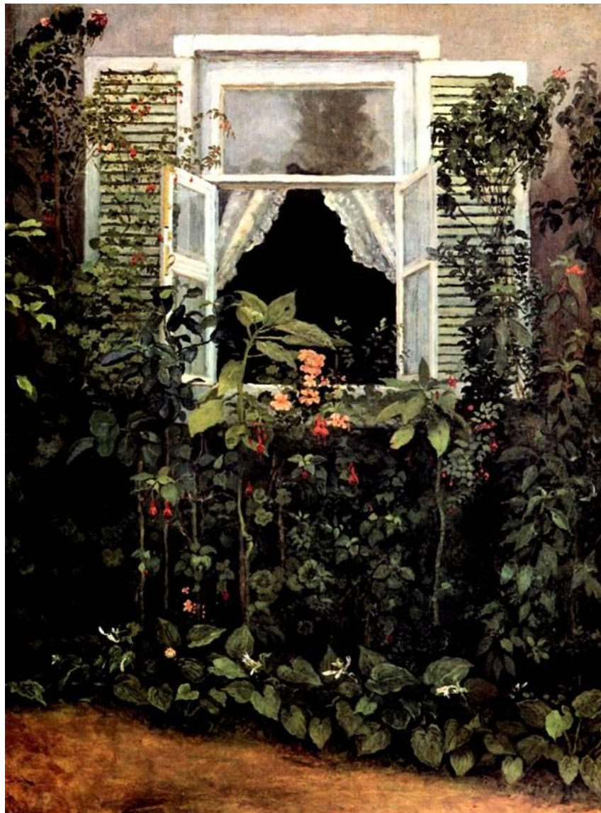
Виктор Борисов-Мусатов «Окно» 1902

Характерными чертами декадентства обычно считаются: субъективизм, индивидуализм, имморализм, отход от общности, и т. п., что проявляется в искусстве соответствующей тематикой, отрывом от реальности, поэтикой искусства для искусства, эстетизмом, падением ценности содержания, преобладанием формы, технических ухищрений, внешних эффектов, стилизации и т. д.