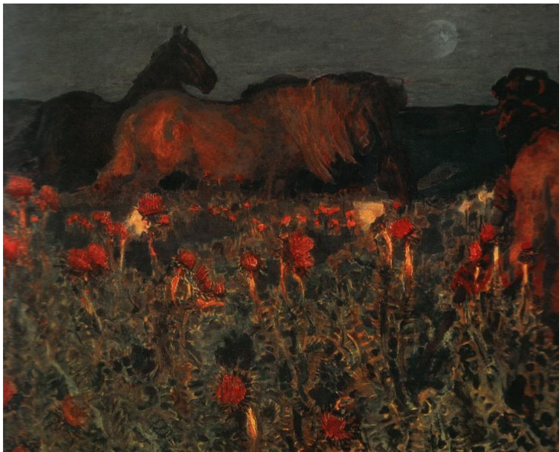
Михаил Врубель «К ночи» 1900

Старшие символисты проповедовали культ красоты и свободного самовыражения поэта. Они резко отрицали окружающую действительность, говорили миру “нет”. Реальная жизнь изображалась как безобразная, злая, скучная и бессмысленная. Особое внимание проявляли символисты к художественному новаторству — преобразованию значений поэтического слова, развитию ритмики, рифмы.