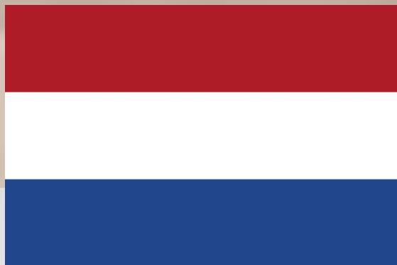
Flag of the Netherlands