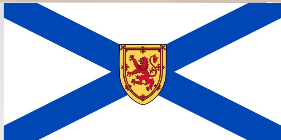
Flag of Newfoundland and Labrador Flag of Nova Scotia