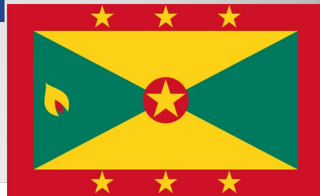
Flag of Grenada