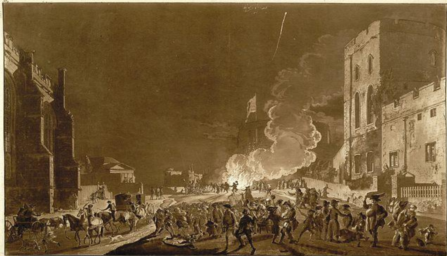
Ночь фейерверков у стен Виндзорского замка, 1776 год

В эту ночь, пятую после Хэллоуин, отмечается провал Порохового заговора, когда группа католиков-заговорщиков попыталась взорвать Парламент Великобритании в Лондоне в ночь на 5 ноября 1605 года, во время тронной речи протестантского короля Якова I, когда, кроме него, в здании Палаты лордов присутствовали бы члены обеих палат парламента и верховные представители судебной власти страны.