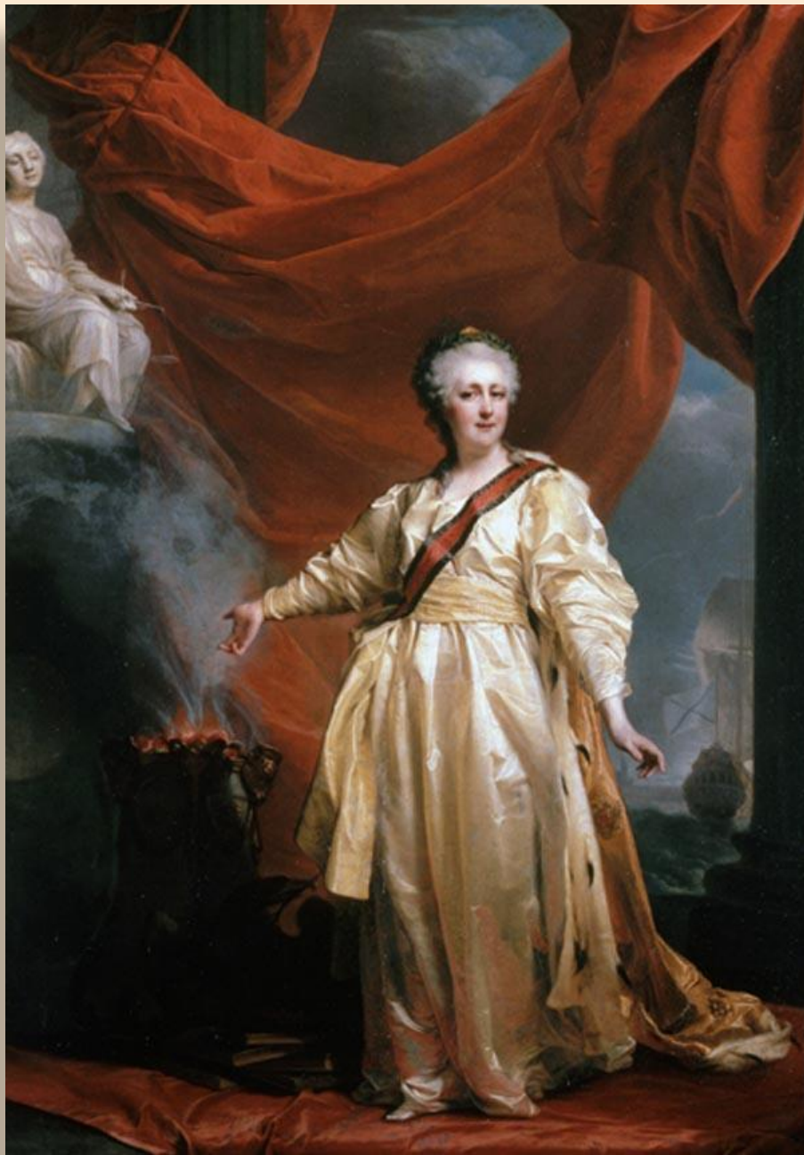
Портрет императрицы Екатерины II в виде законодательницы в храме богини Правосудия Начало 1780-х ГТГ, Москва