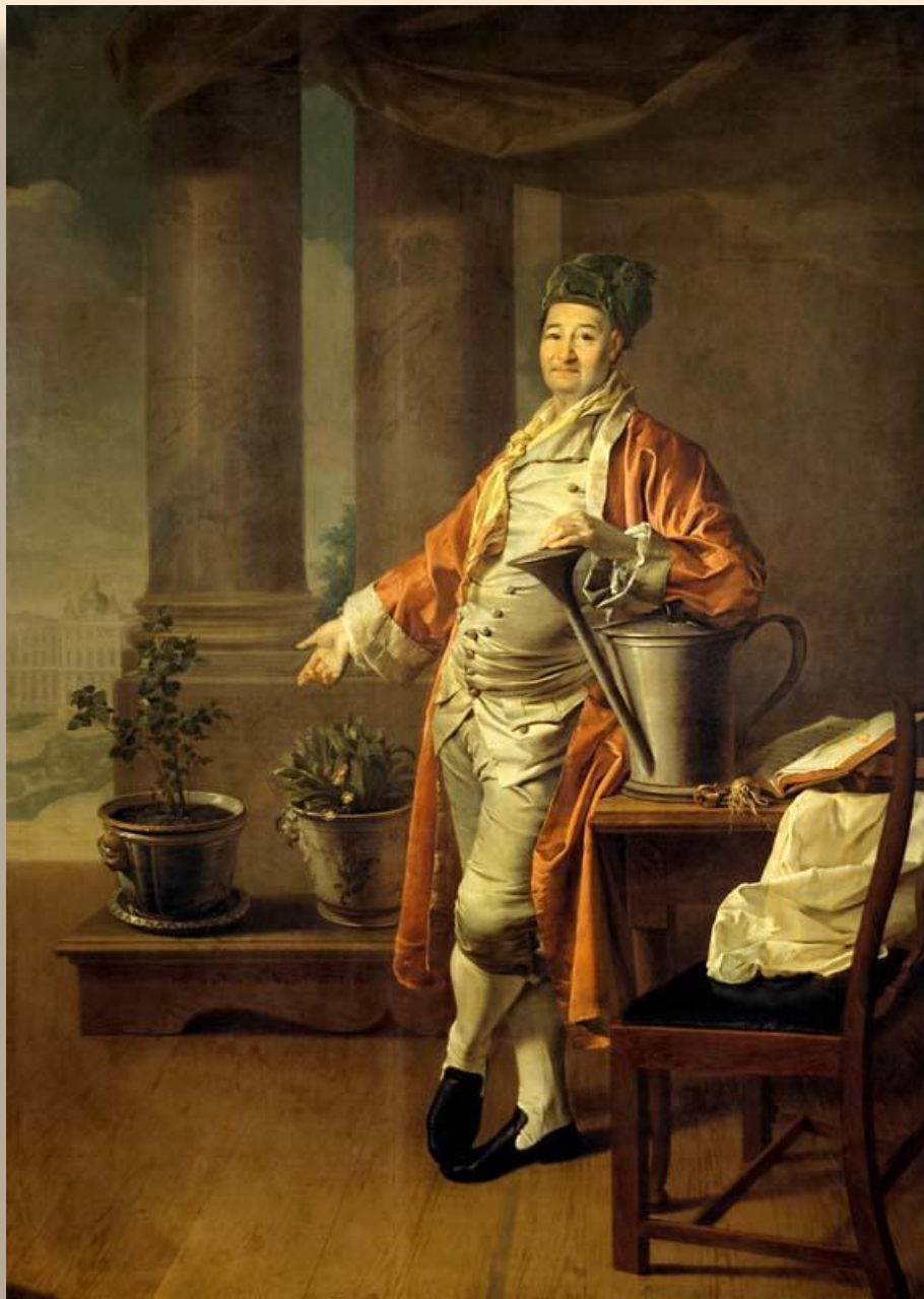
Портрет П. А. Демидова. 1773 ГТГ, Москва