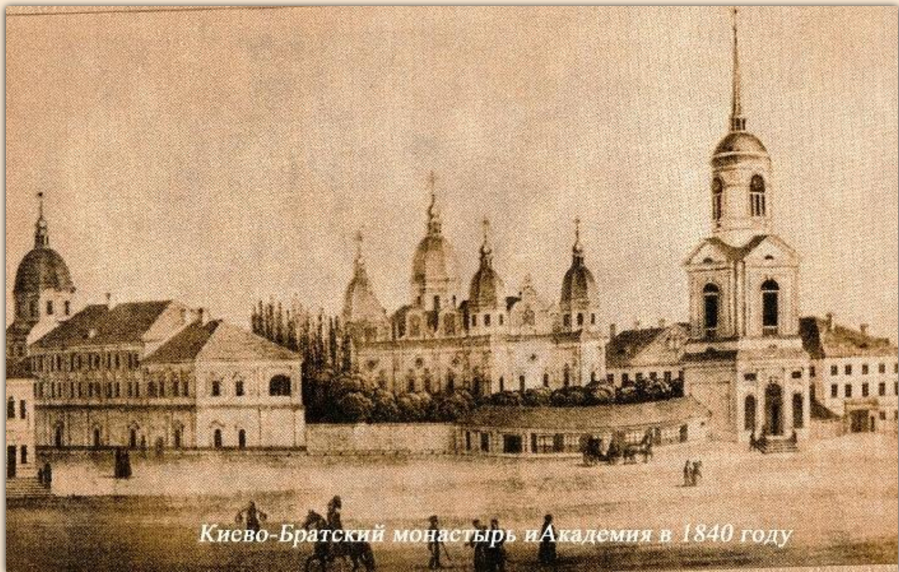
Киево-Братский монастырь и Академия в 1840 году