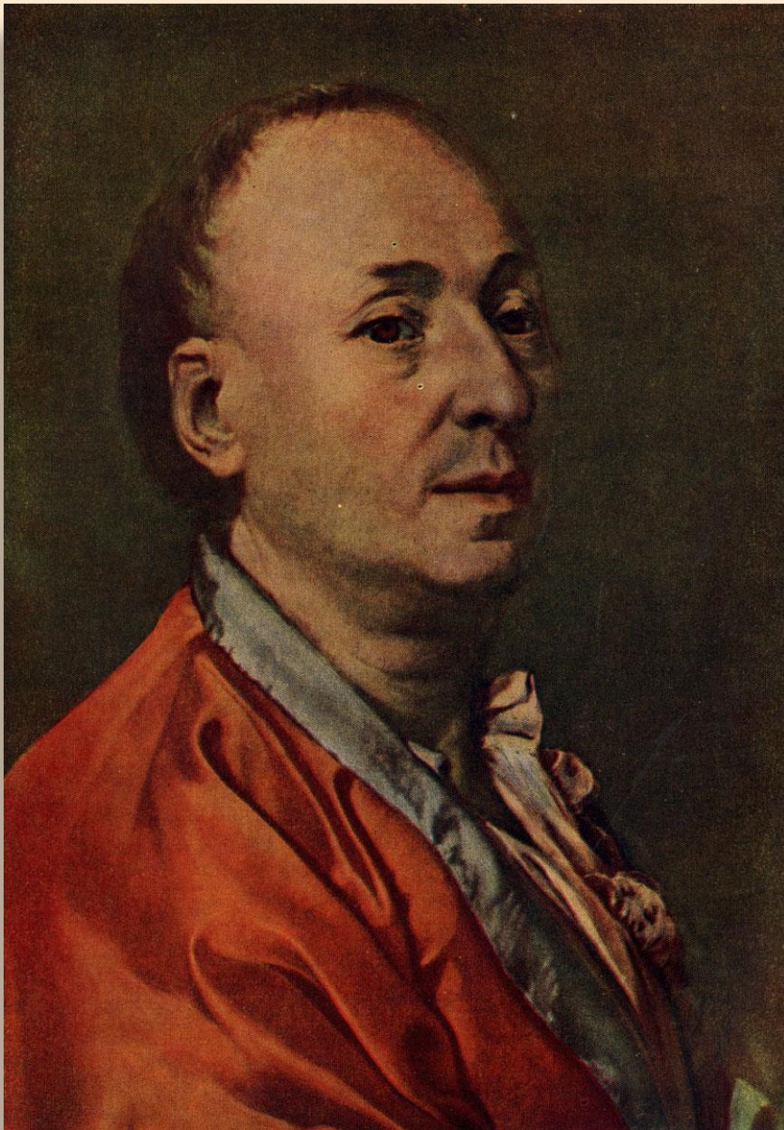
Портрет Д. Дидро. 1773-1774 Музей изящного искусства и истории, Женева