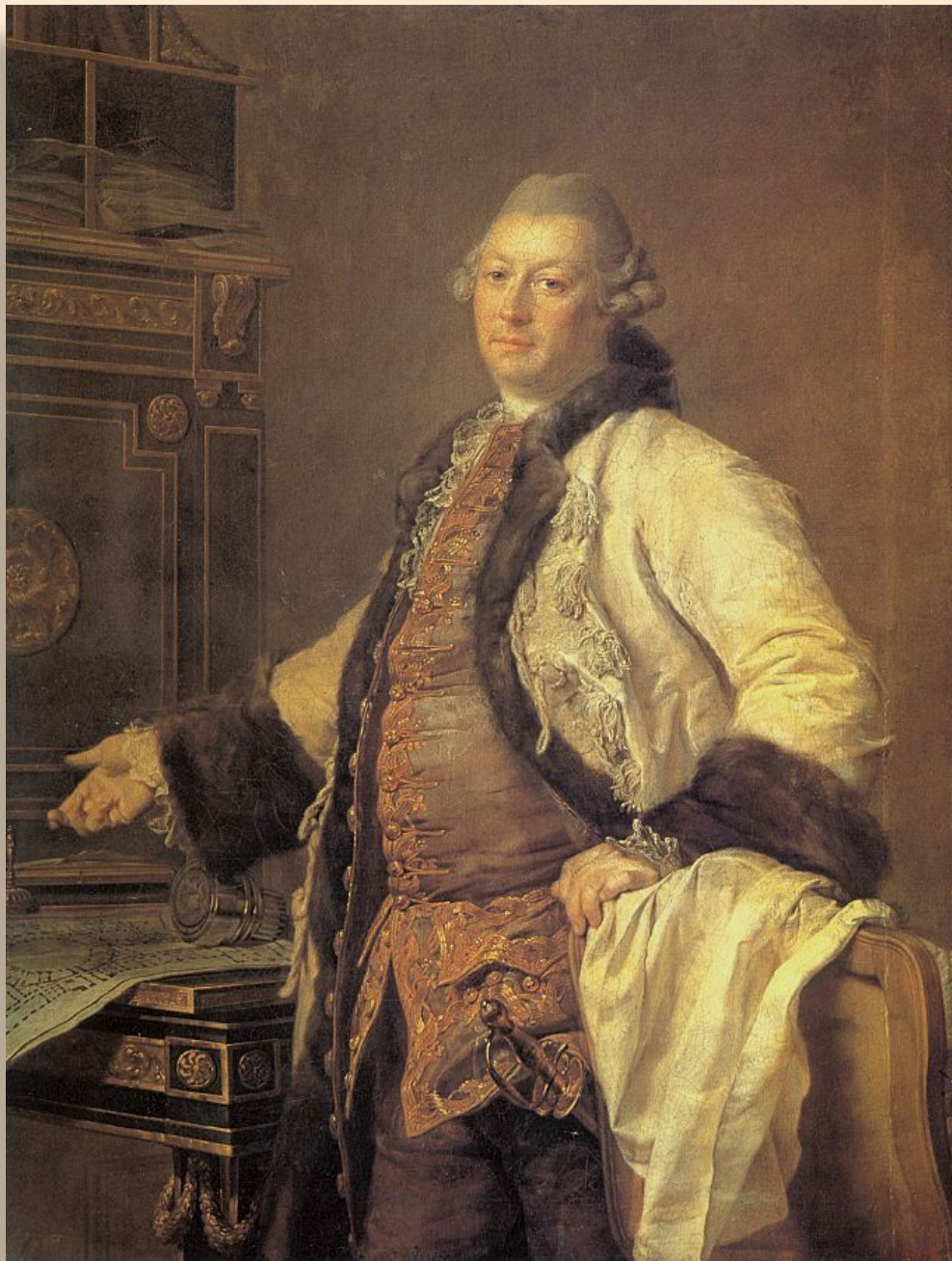
Портрет архитектора А. Ф. Кокоринова. 1769 ГРМ, Санкт-Петербург.