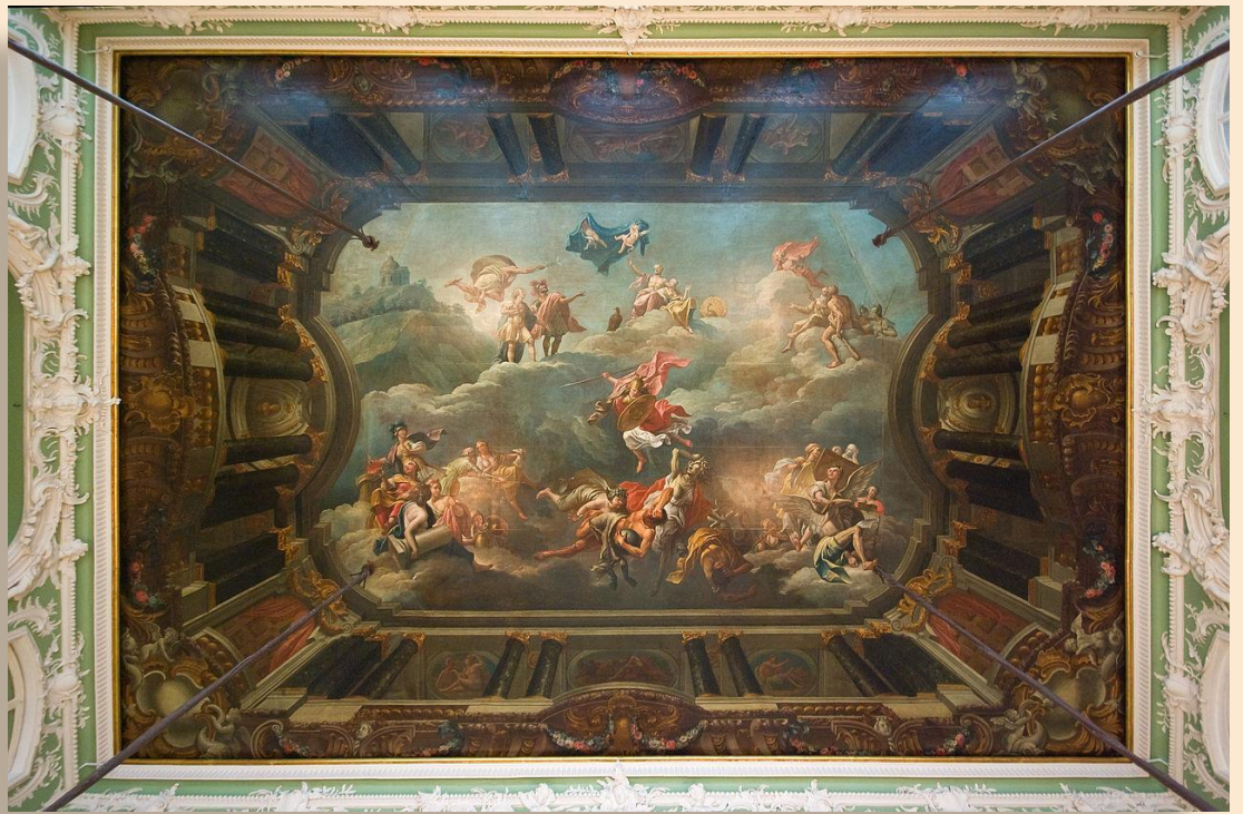
Джузеппе Валериани ( 1708 (?), Рим, — 1761, Петербург) — итальянский художник эпохи позднего барокко, занимался живописью и сценографией. Мастер ведуты и плафонов.