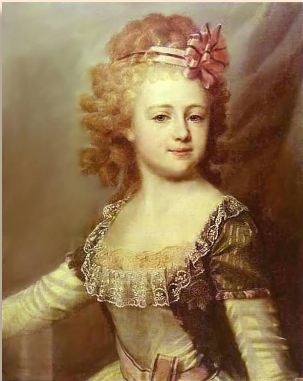
Портрет великой княжны Александры Павловны в детстве 1790-е Музей-заповедник Павловск, Лен. область