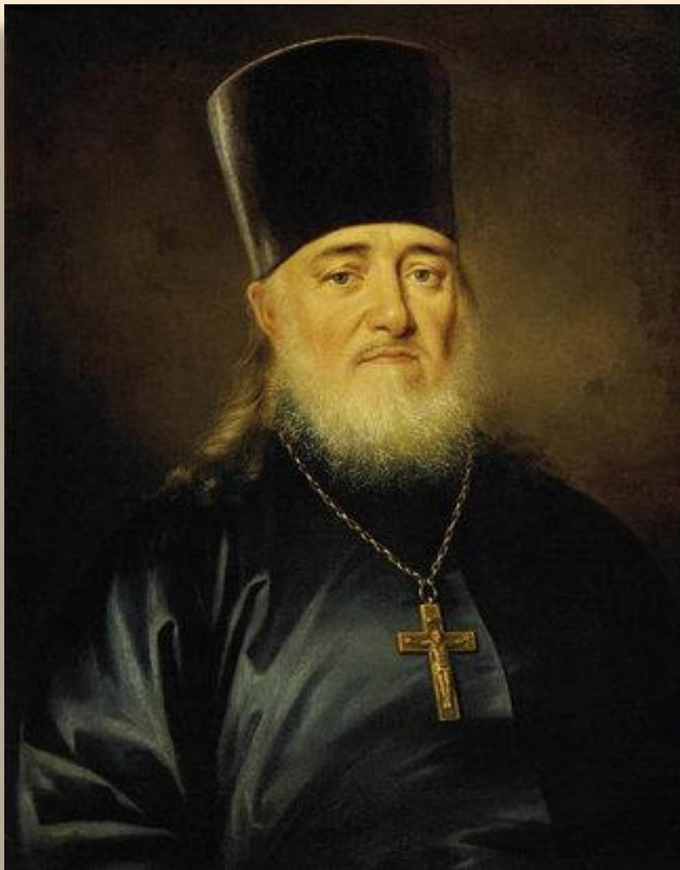
Портрет священника Петра Левицкого 1812 ГТГ, Москва