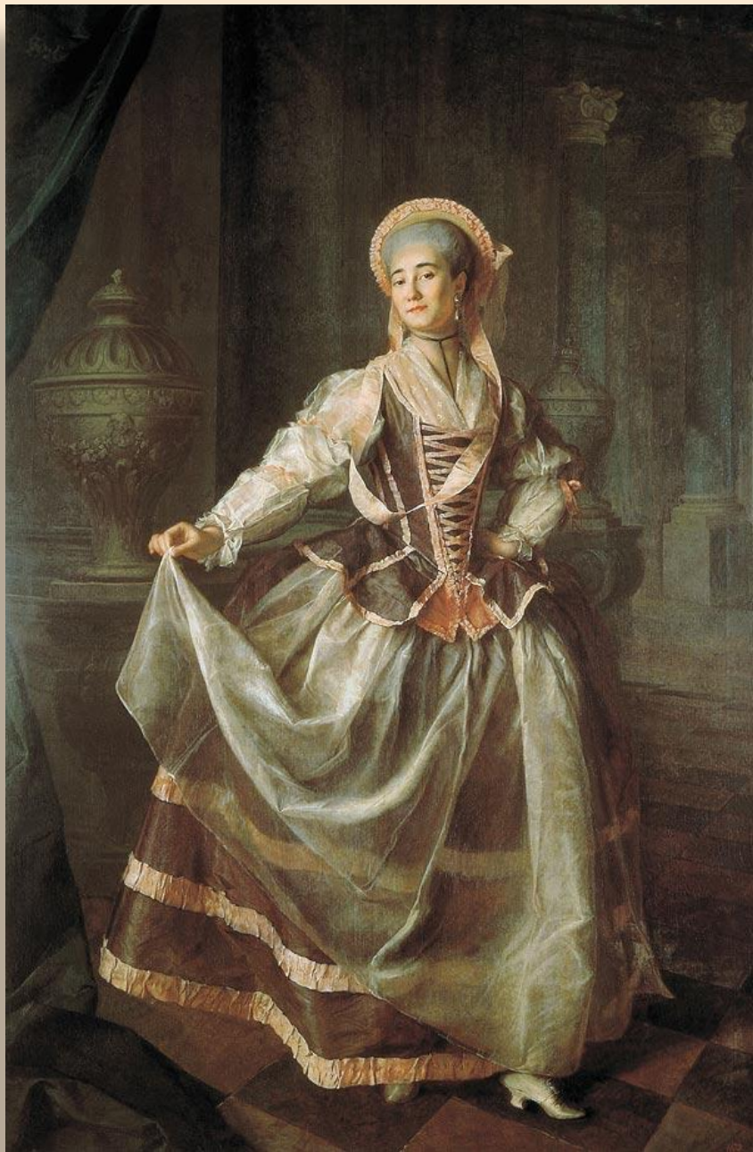
Портрет А. П. Левшиной 1775 ГРМ, Санкт-Петербург