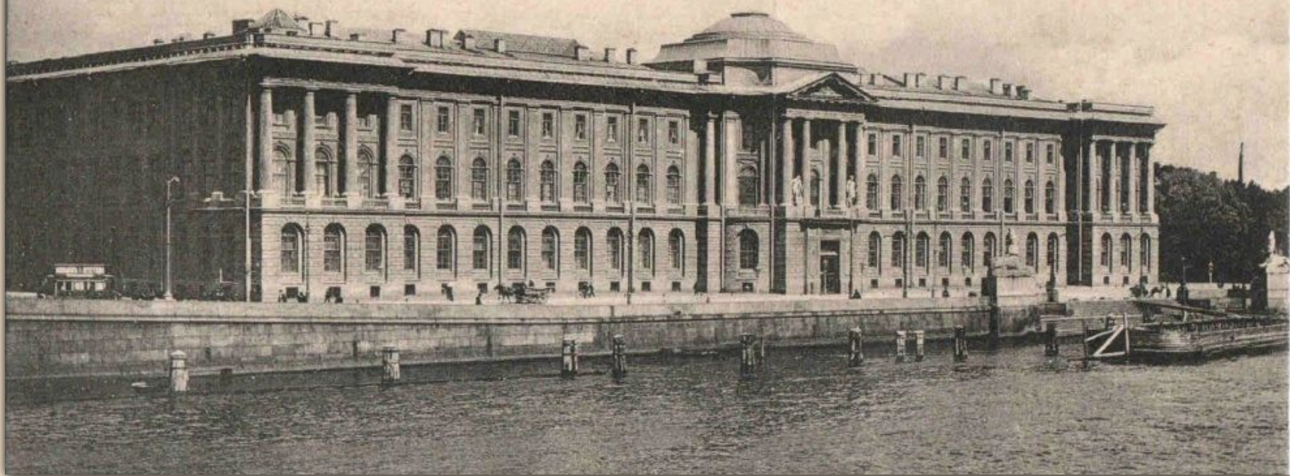
С. Петербургъ — Академія Художествъ