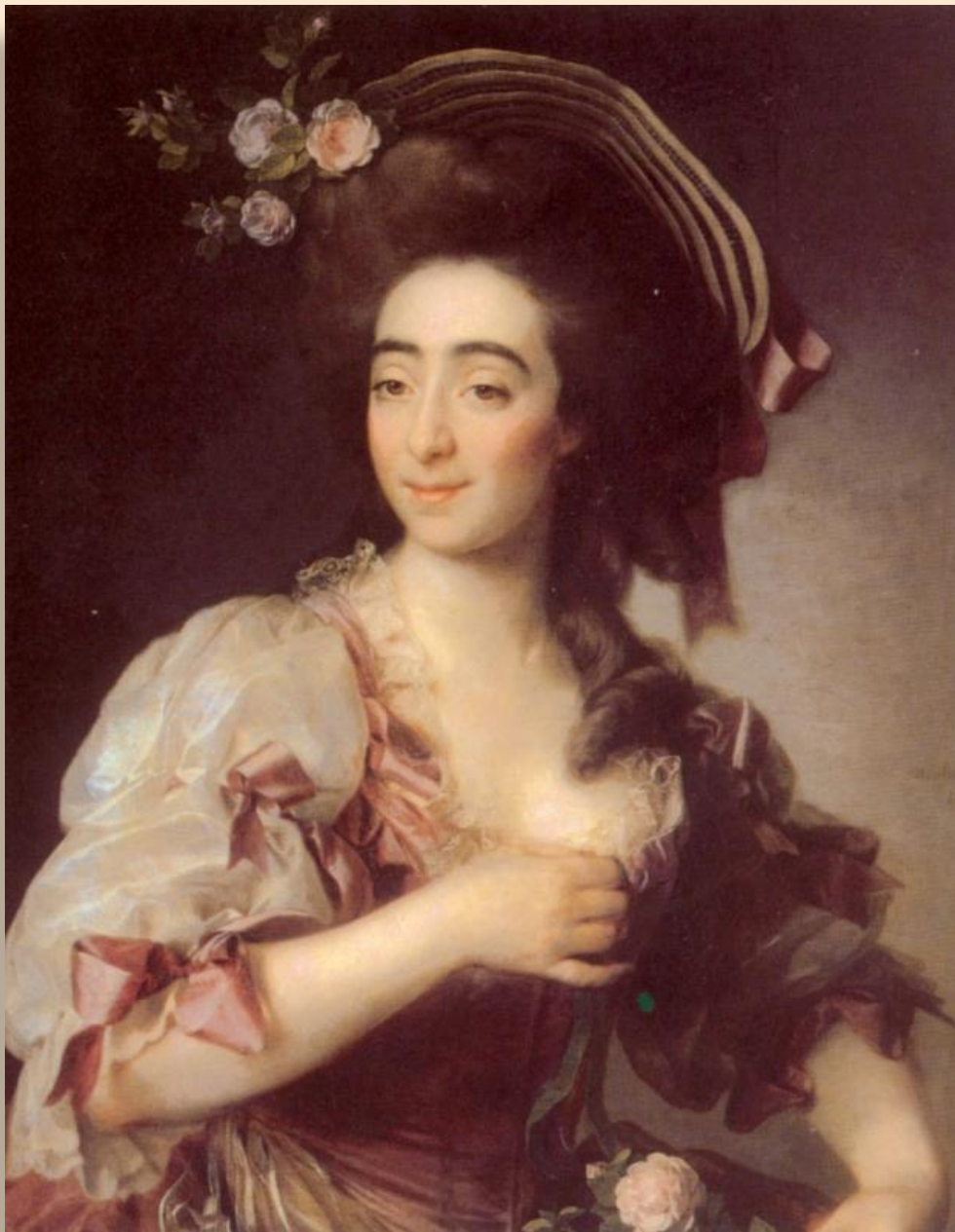
Портрет Анны Давиа-Бернуцци. 1782 ГТГ, Москва