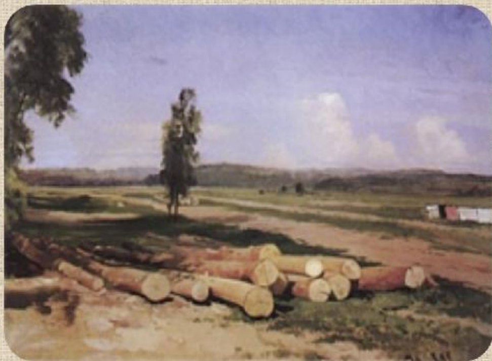
Бревна. Деревня Константиновка близ Красного села. Этюд. 1868-1869