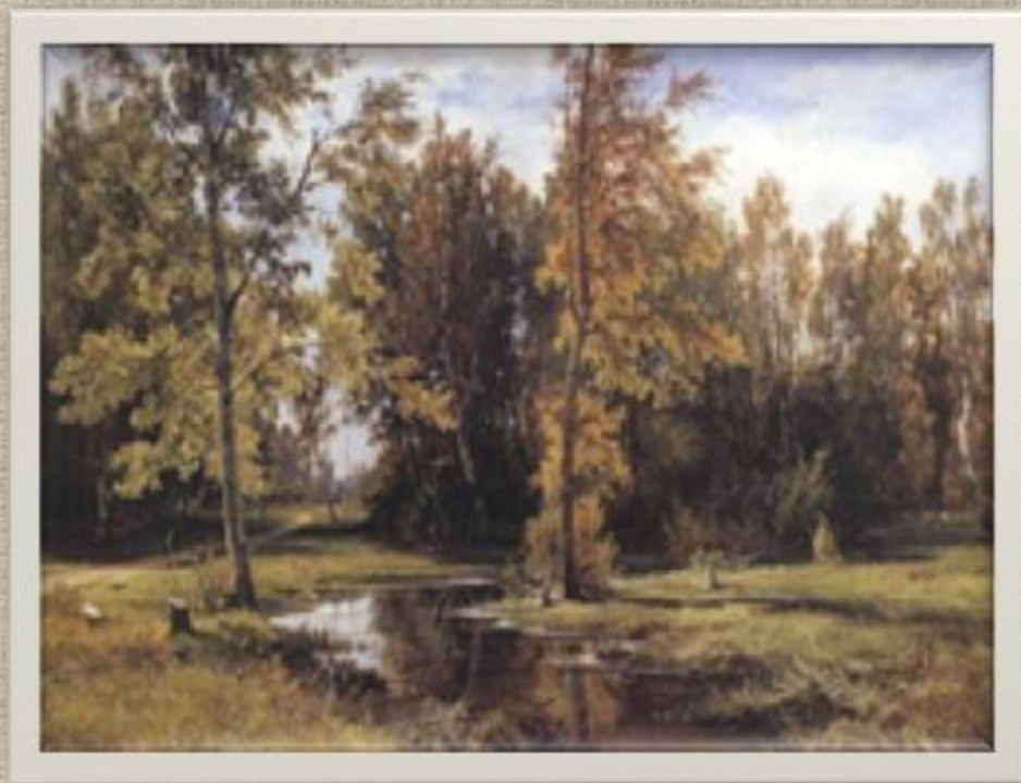
Березовая роща. 1878