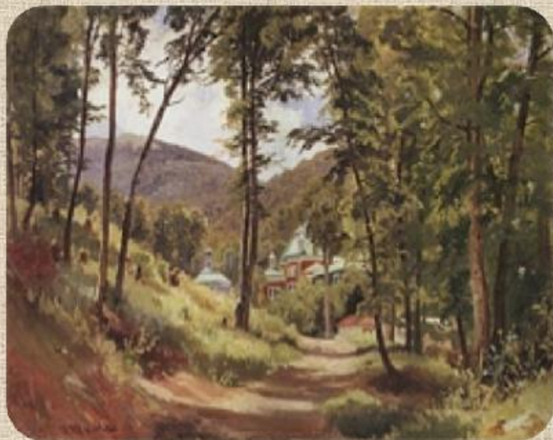
В Крыму. 1880-1890-е