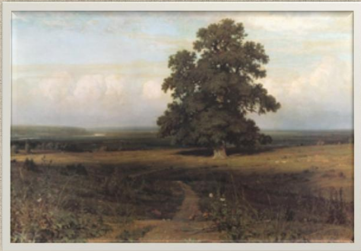
"Среди долины ровныя ...". 1883