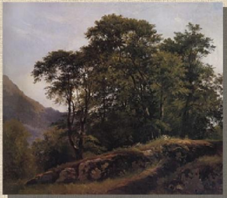
Буковый лес в Швейцарии. 1863