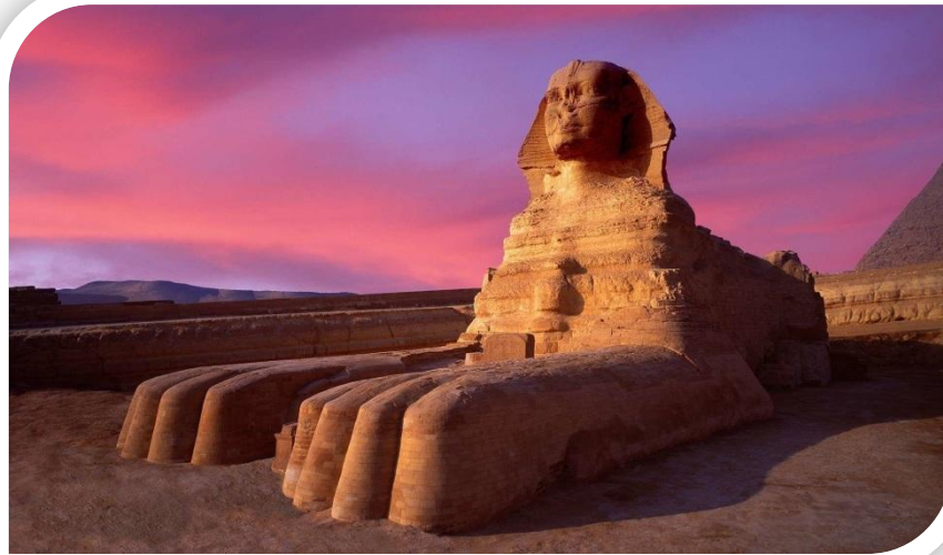
Западный берег Нила в Гизе

Древнейшая сохранившаяся на Земле монументальная скульптура. Высечена из монолитной известковой скалы в форме колоссального сфинкса — лежащего на песке льва, лицу которого, как издавна принято считать, придано портретное сходство с фараоном Хефреном (ок. 2575—2465 гг. до н. э.), погребальная пирамида которого находится поблизости. Длина статуи — 72 метра, высота — 20 метров; между передними лапами некогда располагалось небольшое святилище.