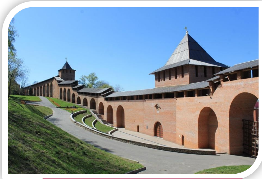
Россия, Нижний Новгород

Нижегородский кремль - крепость в историческом центре Нижнего Новгорода и его древнейшая часть, главный общественно-политический и историко-художественный комплекс города.