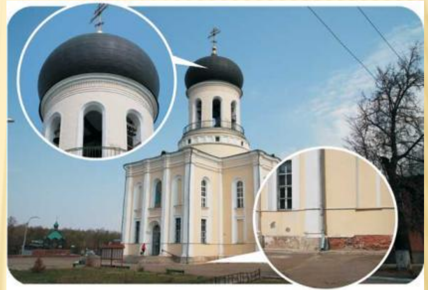
Никольский собор г.Наро-Фоминск