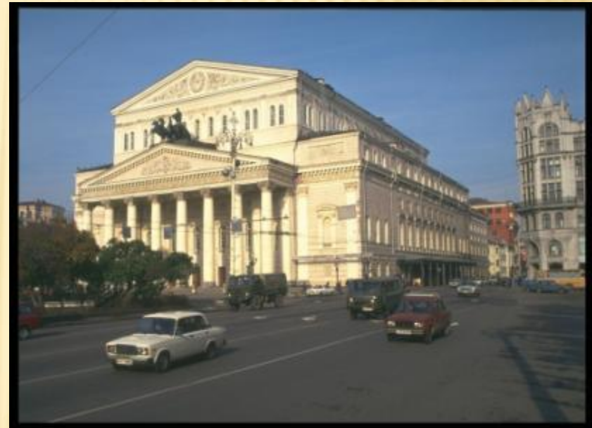
Большой театр г.Москва, 90-ые года