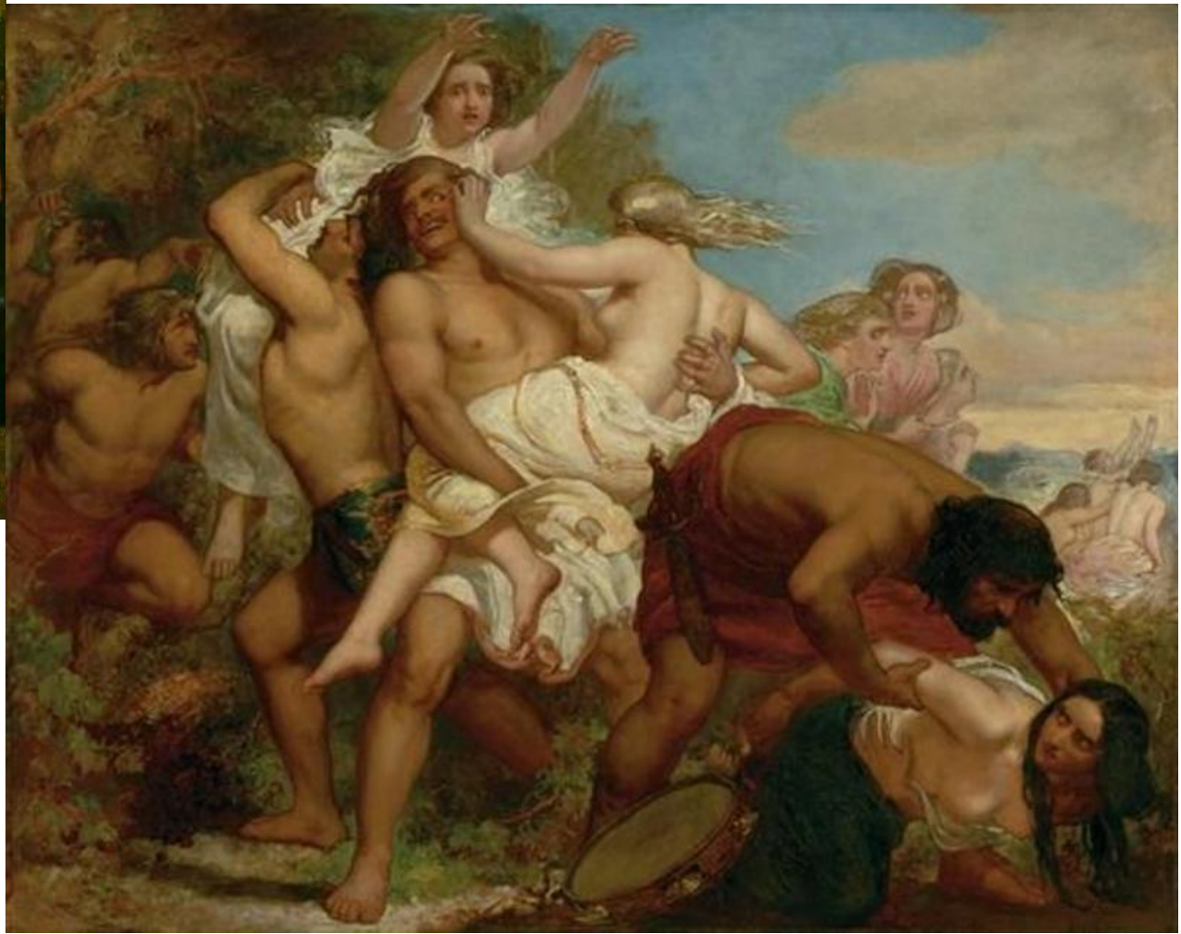
«Нападение колена Вениаминова на дочерей Силоама»