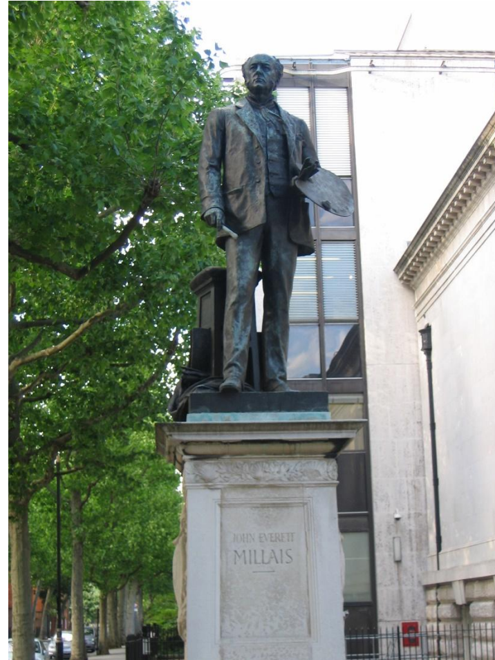
Памятник Д. Э. Милле в Лондоне

В настоящее время Милле относится к числу самых любимых англичанами художников середины XIX века.