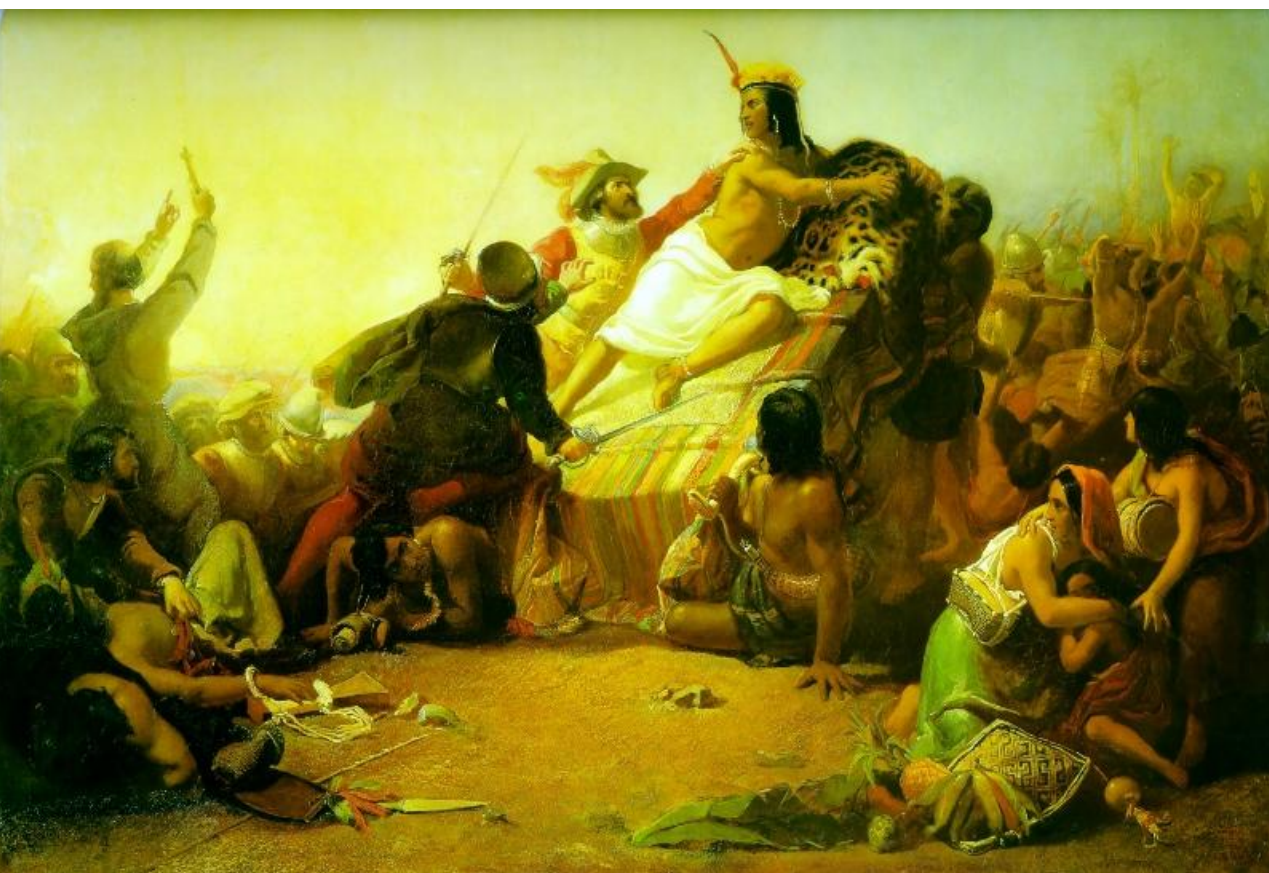
«Писарро берет в плен перуанских инков»