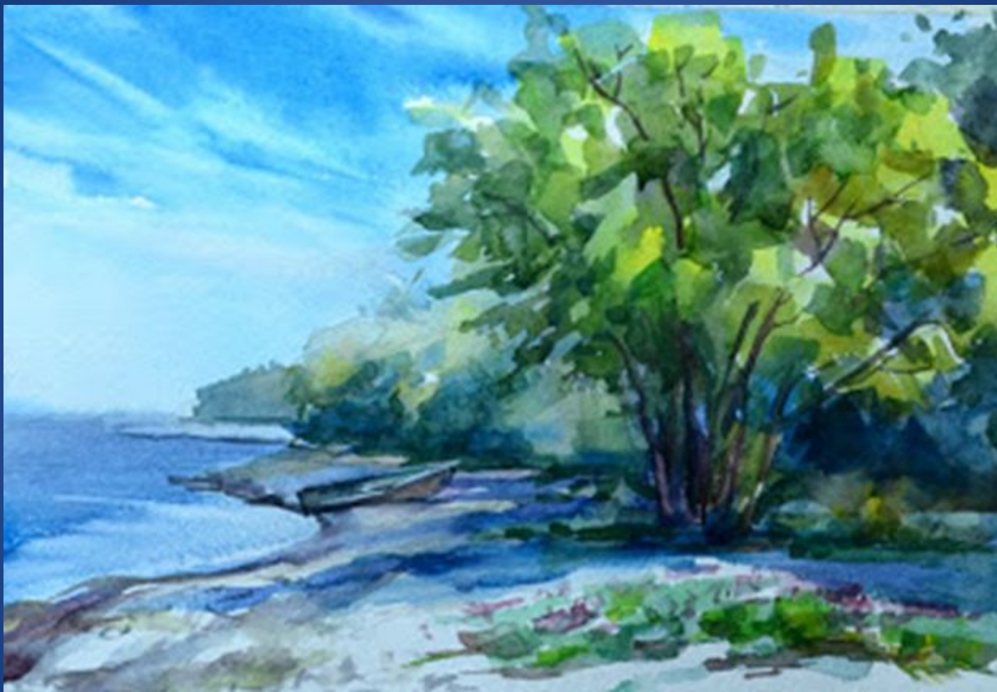
Марина Трушникова "На берегу Байкала", 2012 г.