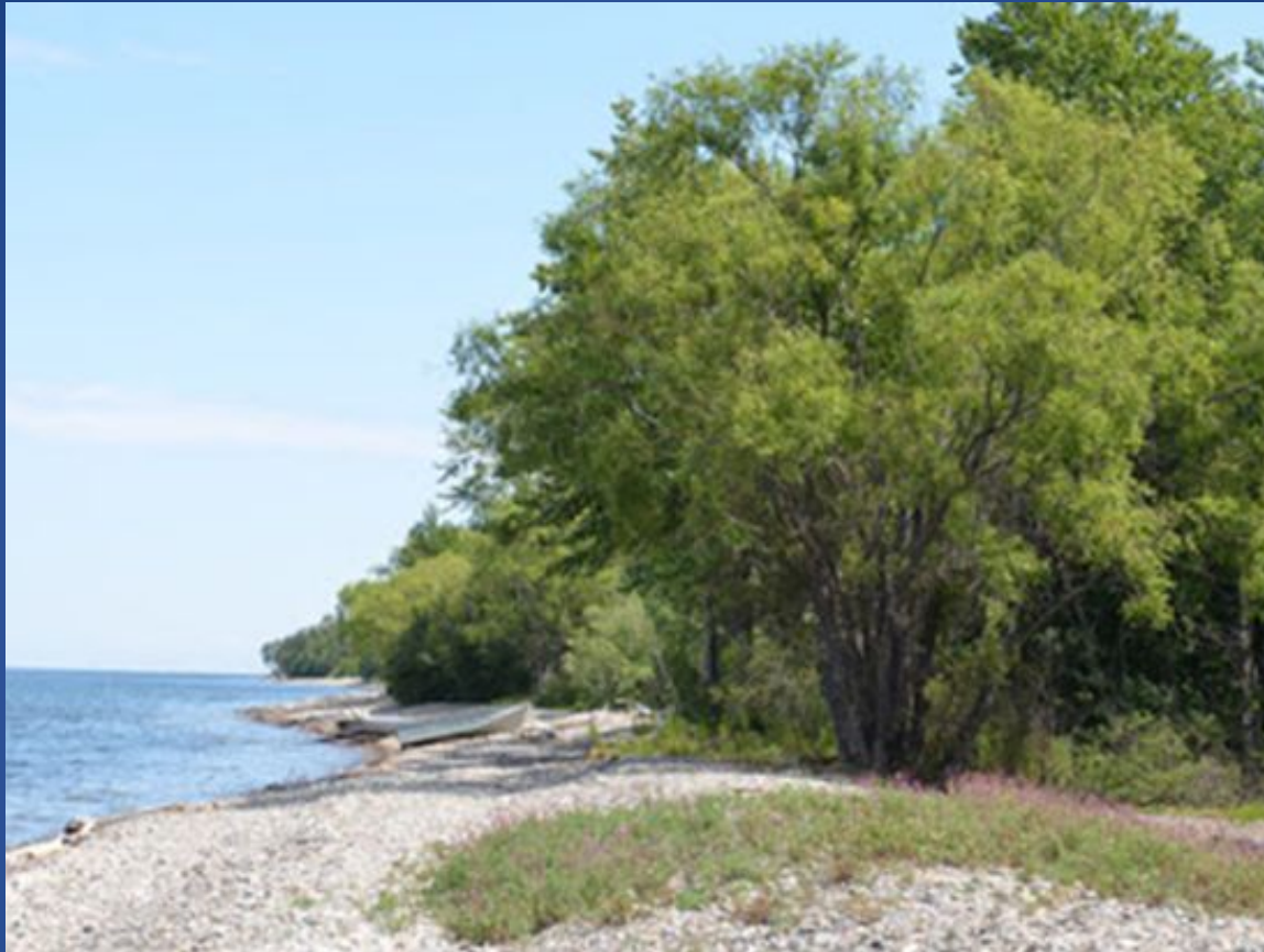
Поэтапный этюд пейзажа акварелью Этюд написанный Мариной Трушниковой на озере Байкал