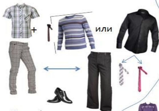
Парадная форма – костюм.

Повседневной мужской школьной одеждой считаются брюки, рубашки, джемпера, водолазки и д.т.